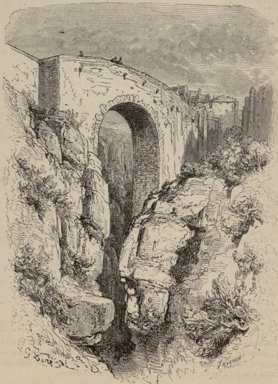
PUENTE ROMANO DE RONDA (Gustavo Doré).