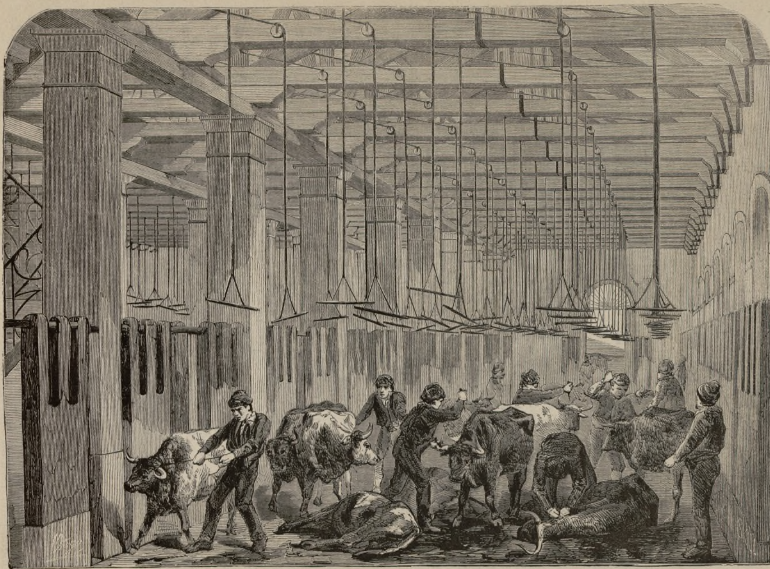
MATADERO DE MADRID