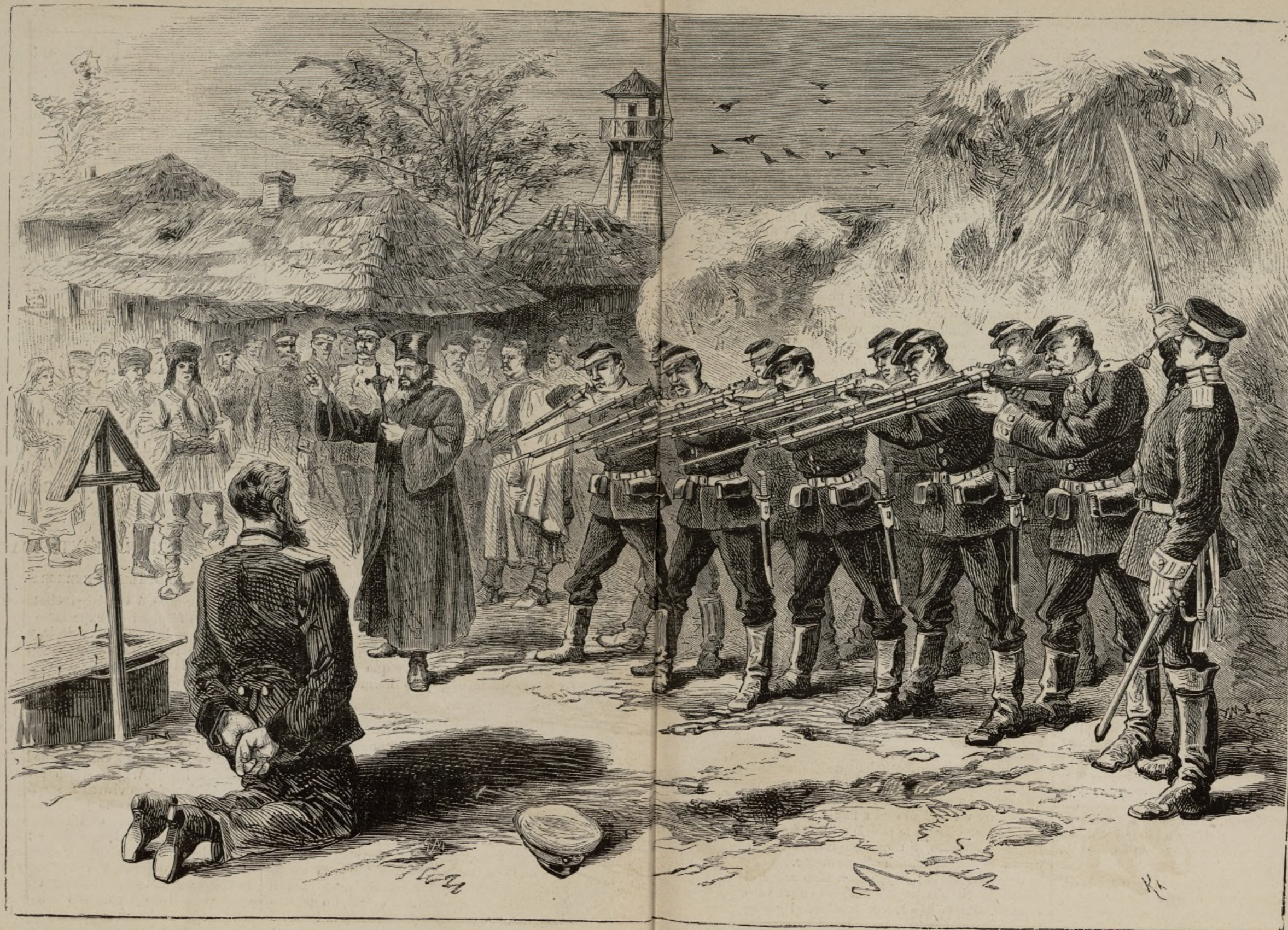
FUSILAMIENTO DE UN NIHILISTA