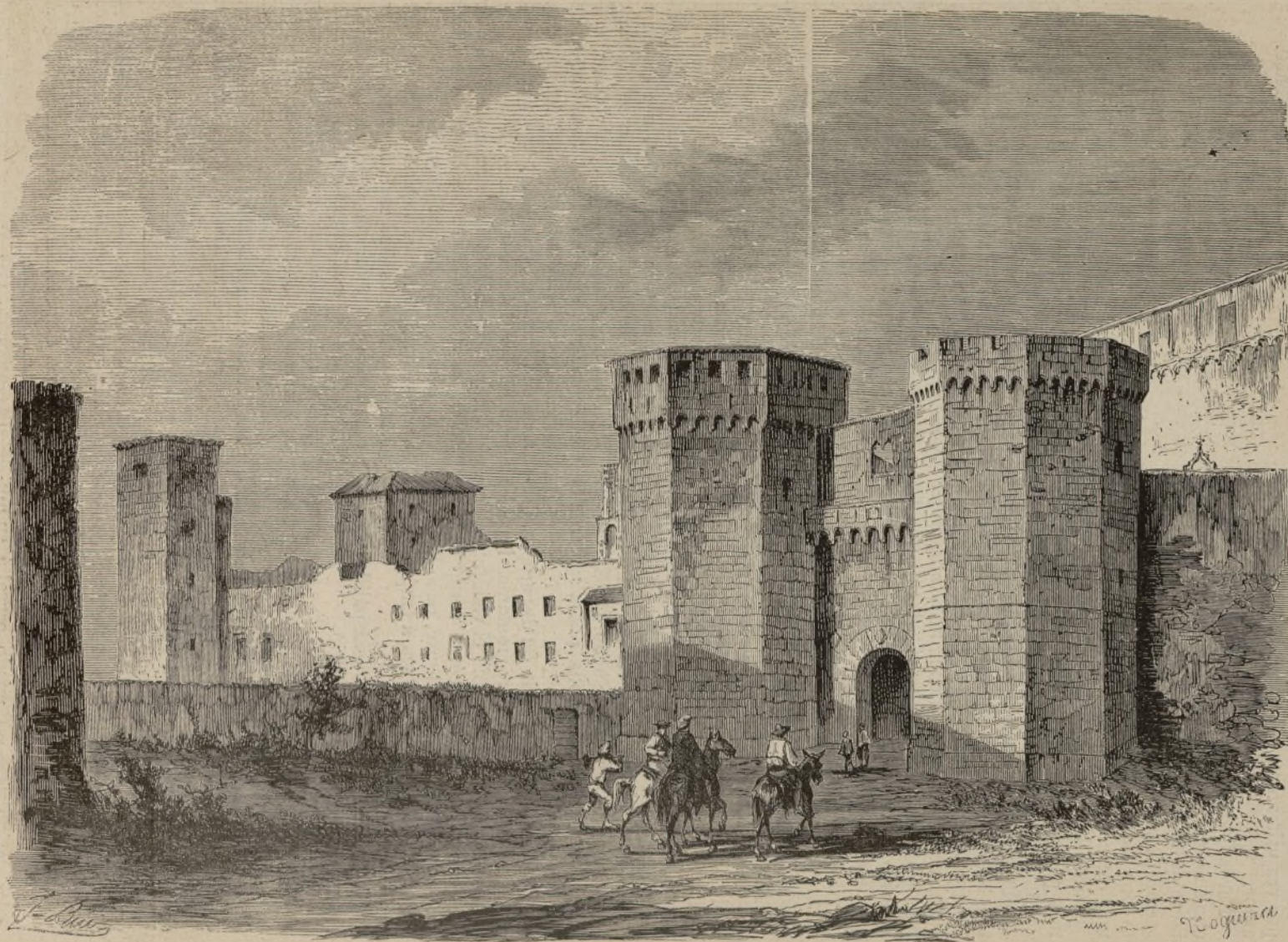
EL MONASTERIO DE POBLET