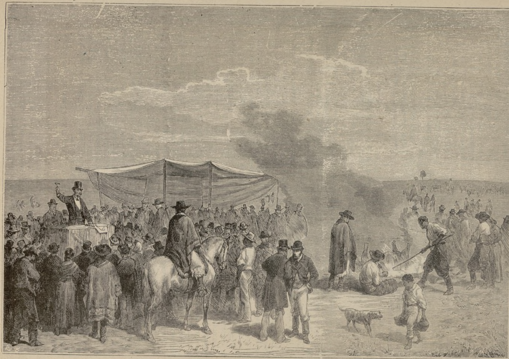
MERCADO DE CUEROS, EN TEJAS