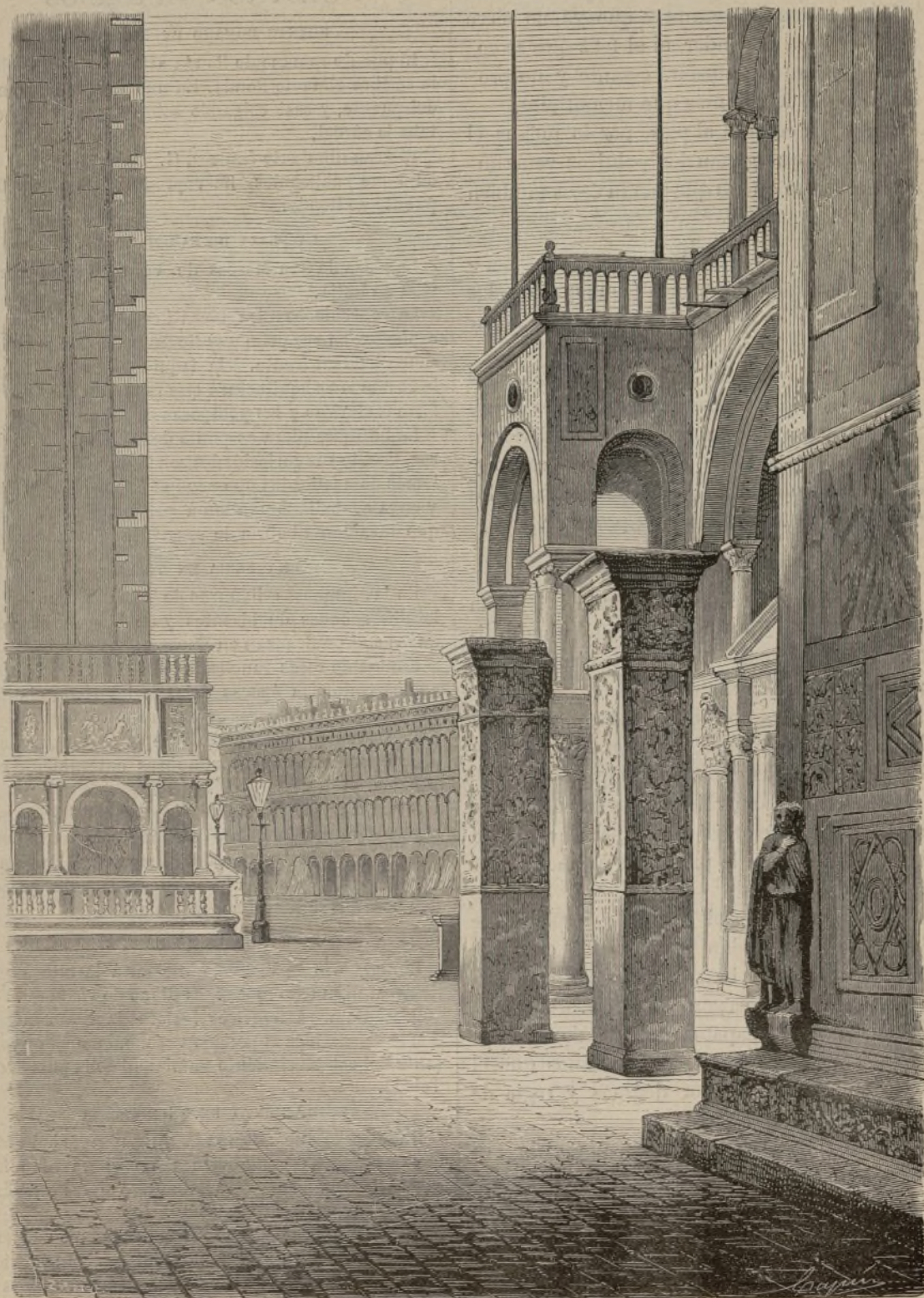
PLAZA DE SAN MARCOS, EN VENECIA