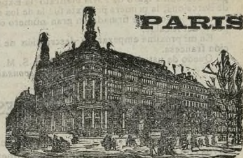
GRANDES ALMACENES DEL