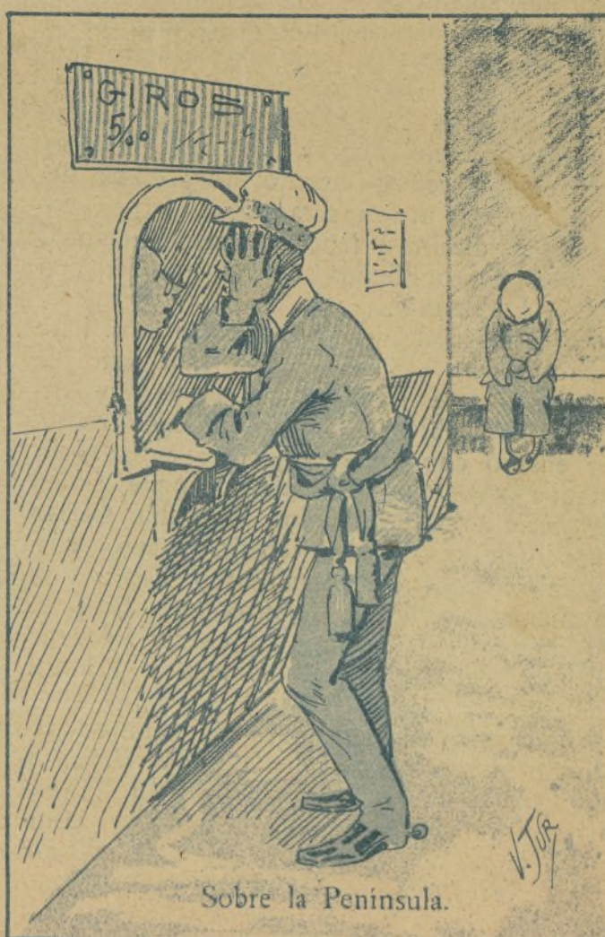
Sobre la Península.