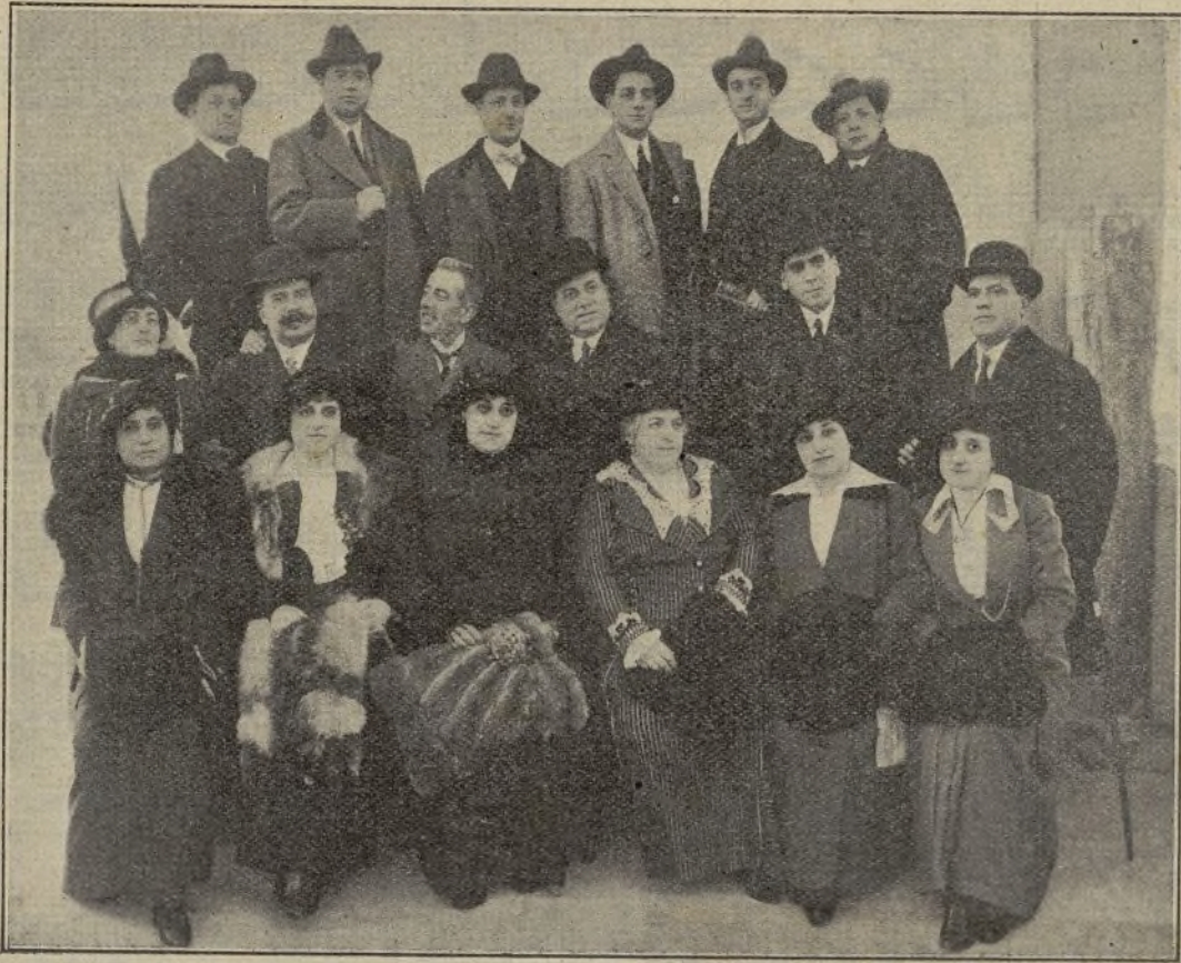
Grupo de artistas que componen la compañía del Teatro Romea