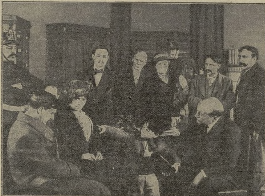
Una escena de la película La Gitanilla