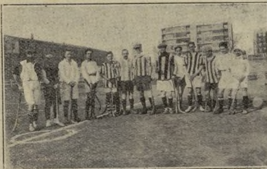
Socios del «R. C. D. Español» que jugaron un interesante partido de Hockey, el día 25.