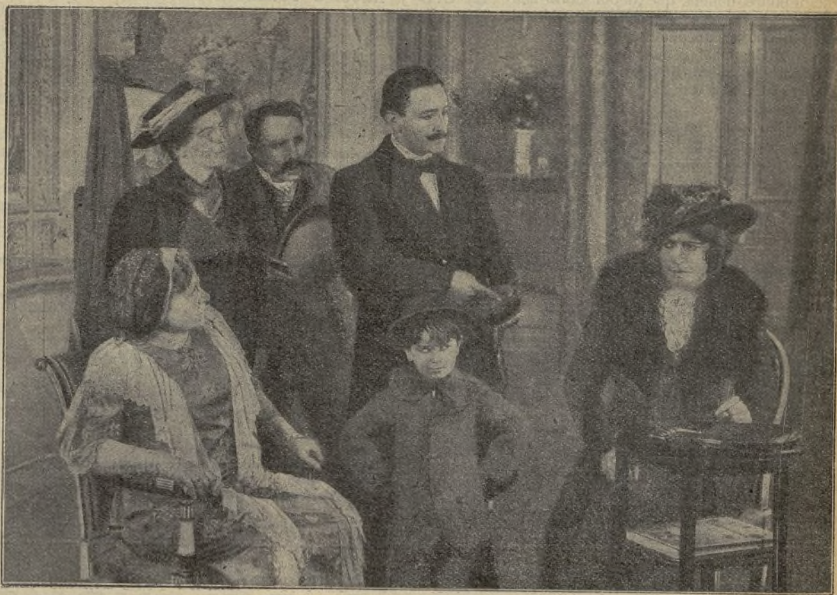
Una interesante escena de la película La Gitanilla

Más no bien acaba de hacerse esta reflexión, cuando, apareciendo en la lejanía un ca-