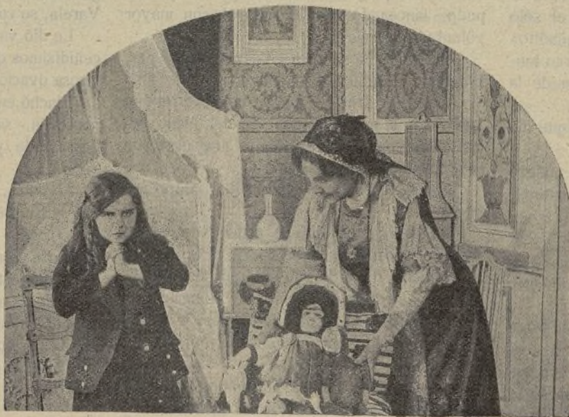
Una interesante escena de la película La Gitanilla (Gaumont)

Hace pocos días, se pasó ante unos cuantos invitados la primera cinta, en Londres; y según la prensa de la populosa ciudad, el éxito fué propio de uno de los más grandes acontecimientos artísticos de la cinematografía moderna.