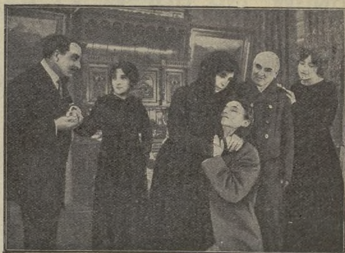
Una escena de la película El miedo a la dicha (Pathé)

ro de gitanos, la niña, poseída de una emoción extraordinaria, se levanta sobre su asiento y se pone a gritar: ¡Papá! ¡Mamá! Maugars se arroja encima de ella y la impone silencio.