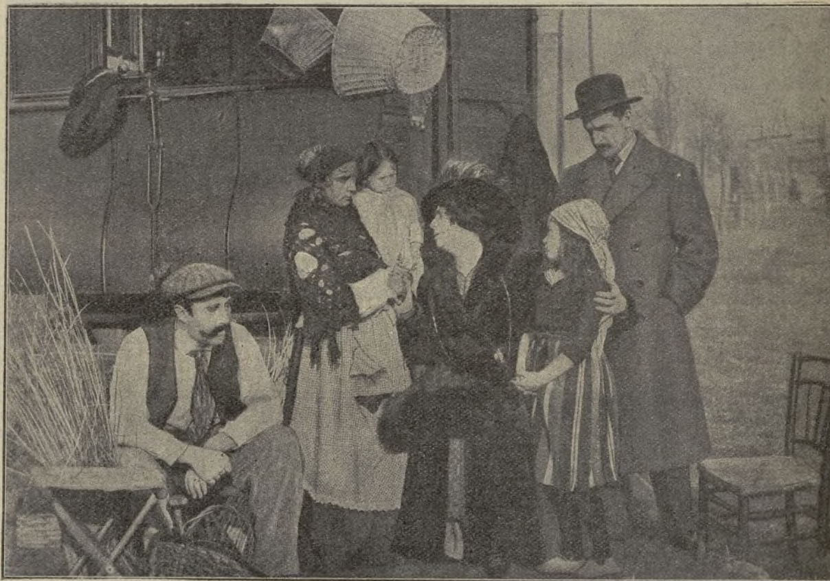
Una interesante escena de la película La Gitanilla

Para reír un rato de los envidiosos, como antes lo han hecho de los mujeriegos, de común acuerdo se presenta ella como adivina, y no tarda en recibir la visita del consejero de comercio al que predice una próxima condecoración, para realizar lo cual él, haciéndose pasar por un elevado personaje presentase en la aldea y para dar mayor realce a la fiesta, or-