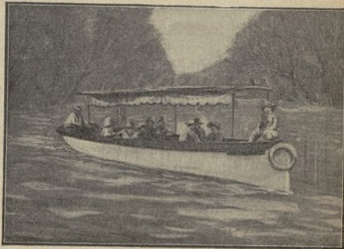
Una escena de la película El miedo a la dicha (Pathé)