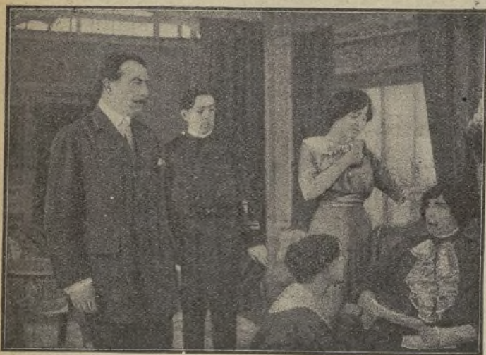
Una escena de la película El miedo a la dicha (Pathé)