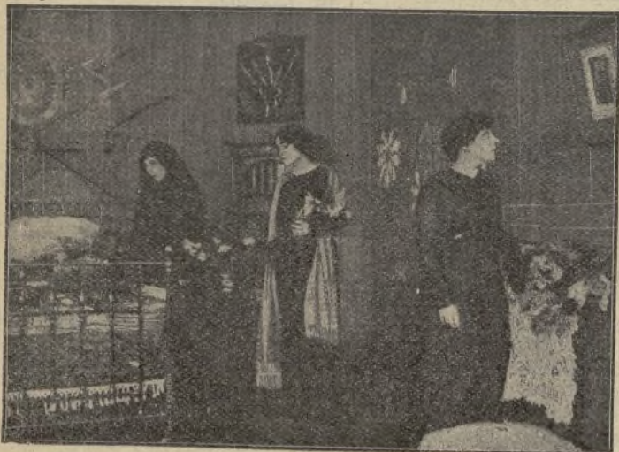
Una escena de la película El miedo a la dicha (Pathé)

Gwendoline acepta; pero la generosidad de Crane ha sabido reconciliarla con la vida, y cuando «Master» Swart llega acompañado de Charley, que le ha comunicado la fatal resolución de Gwendoline, la encuentra sonriente en los brazos de Wilbur. Para hacer completa la felicidad de su hija, Swart abre entonces la caja fatal, extrayendo de ella el