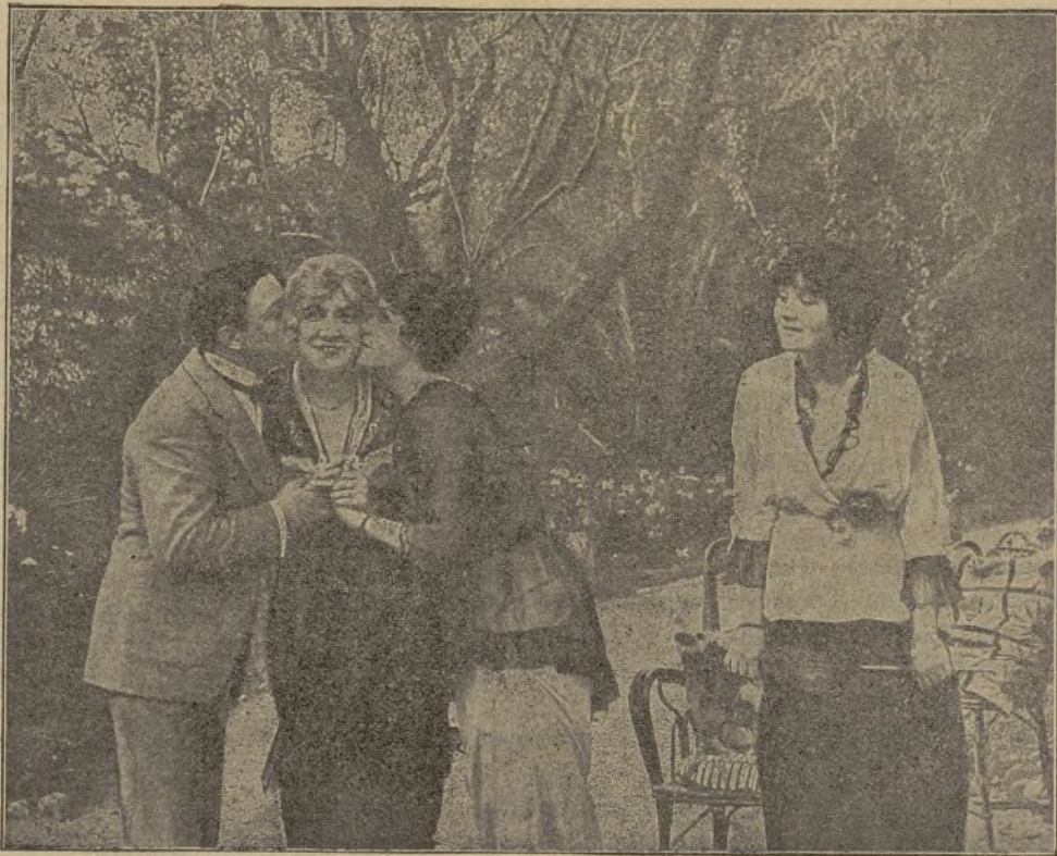
El arte de ser abuela (Gaumont)

«La desilusión de Bergorno 205 mts. (cómica). — «Lucha grego-Romana» por los colosos más pequeños del mundo 80 mts. (acrobacia). — «Los leones de la condesa» «literaria» 915 metros. — «El inquilino tiene prisa» 165 mts. (cómica). — «Robo-kong gran puerto inglés» 95 mts. natural. — «Revista Pathé» nú-304 — «Consecuencias de una apuesta» «A Kinema» 250 mts. (comedia). — «Cataratas y rápidos de Sivasanudran» 120 mts. natural. — «Venganza del pintor» (Sánchez) 120 mts. natural. — «Nick Sinter y la Gruta misteriosa» «Eclectic» 790 mts. — «Ejercicios acrobáticos» 140 mts. (acrobacia) — «Sacrificio de amor» «A Kinema» 285 mts. (drama). — «Revista Pathé» n.º 305. — «Una casa tranquila» 205 mts. (cómica).