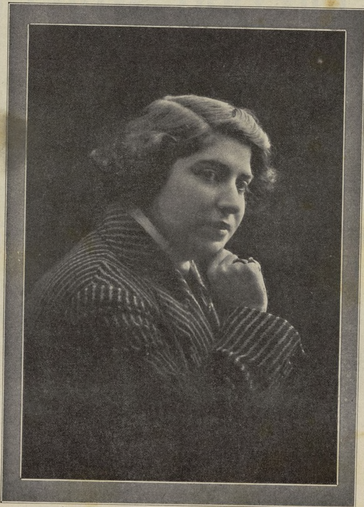
LA TROYANA (celebrada canzonetista)