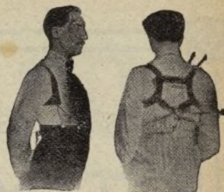
Con Benefactor El Benefactor de espalda

Riera San Juan, 8 - BARCELONA que mandará folleto gratis a quien lo pida