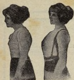
Sin Benefactor Con Benefactor