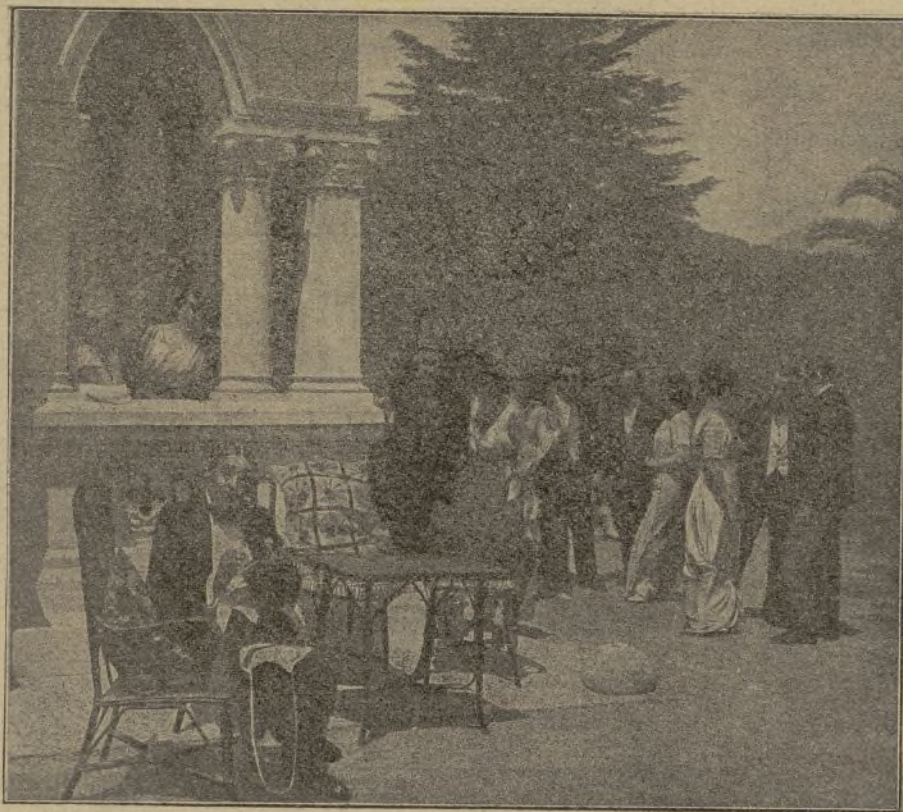
El arte de ser abuela (Gaumont)

Siguiendo sus correrías, llegaron a cierto mesón donde la hija del mesonero se enamoró de Andrés (que tal fué el nombre que Don Juan tomó entre la gitanería). Pero Andrés rehusó la pasión de la Carducha, y esta por