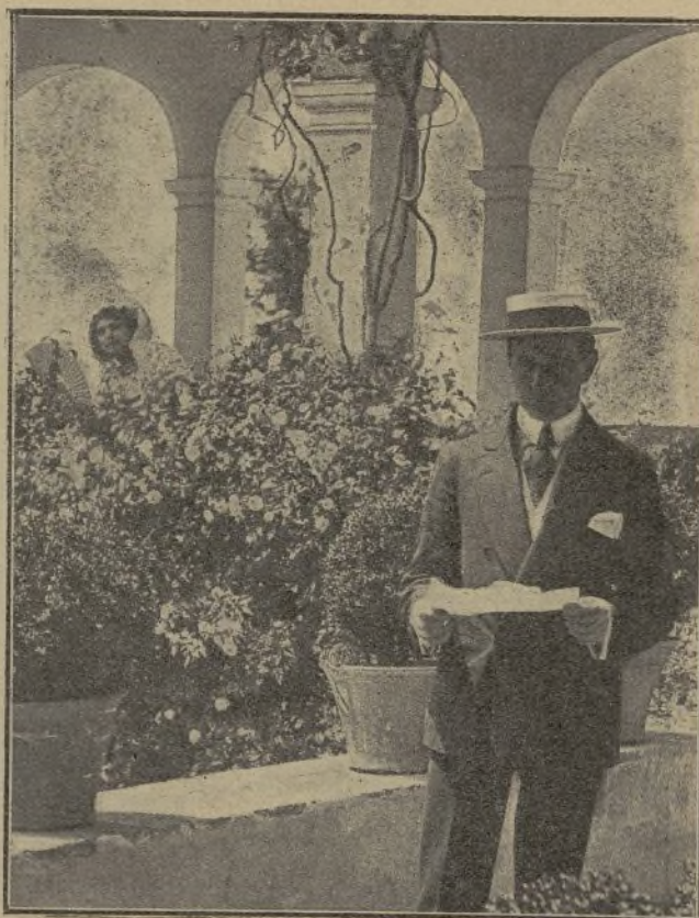
Una escena de la película La novena (Gaumont)

Romano y su mujer en el interior del vehículo, duermen ya: Charly entra sigiloso,