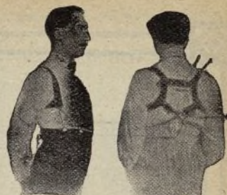
Con Benefactor El Benefactor de espalda

Riera San Juan, 8 - BARCELONA que mandará folleto gratis a quien lo pida