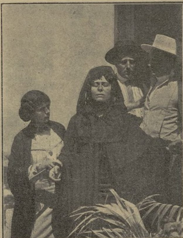
Una escena de la película La Novena (Gaumont)

Procuró él, ocultarlo, pero su repentino cambio de humor, el recelo que mostraba, des-