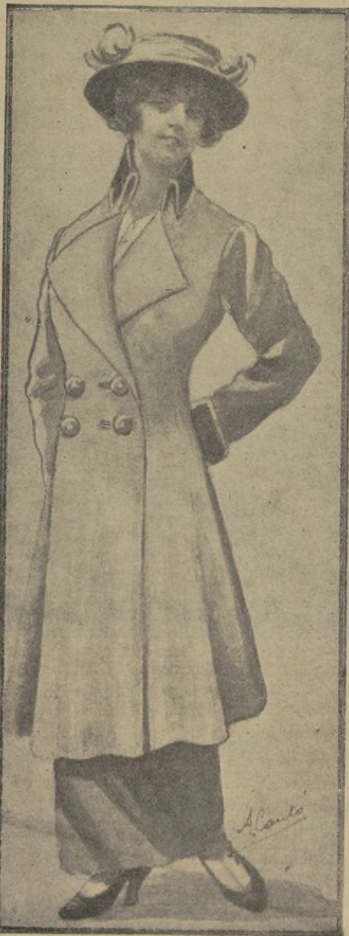
Traje sastre, cuello y puños de terciopelo negro, y chaleco de gamuza crema.