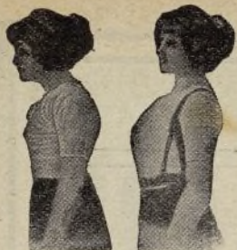
Sin Benefactor Con Benefactor