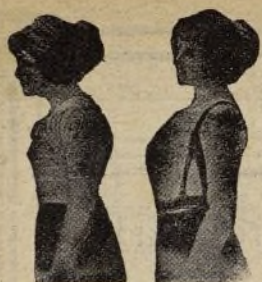
Sin Benefactor Con Benefactor