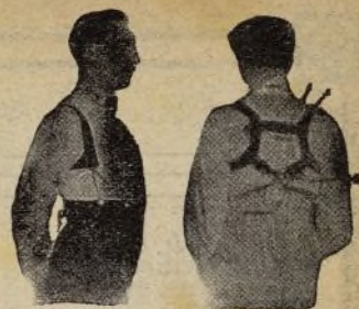
Con Benefactor El Benefactor de espalda

Riera San Juan, 8 - BARCELONA que mandará folleto gratis a quien lo pida