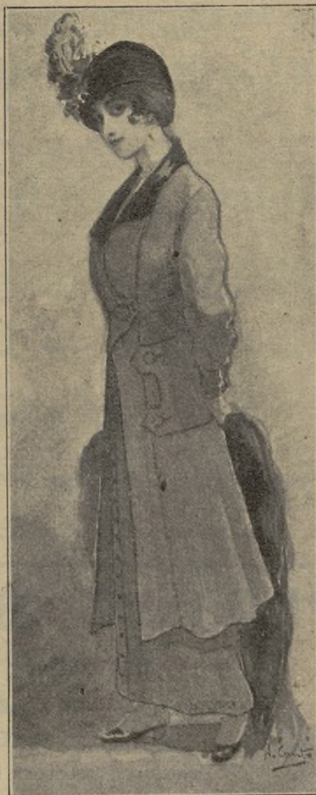
Traje sastre color topo, cuello y bocamanga de terciopelo del mismo tono

La prisionera le dirigió una profunda mirada de desprecio, y murmuró secamente antes de salir:—Gracias.