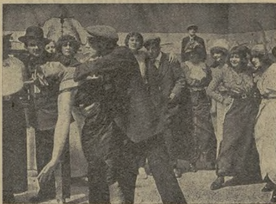
Una escena de la película Los cuervos

Entretanto, la madre enterada de la desaparición de su hijo, se abandona a la más acer-