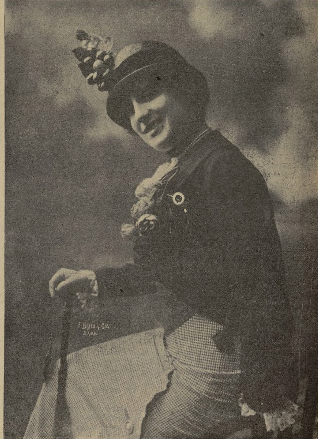
Antonia Plana, primera actriz del «Teatro Romea»