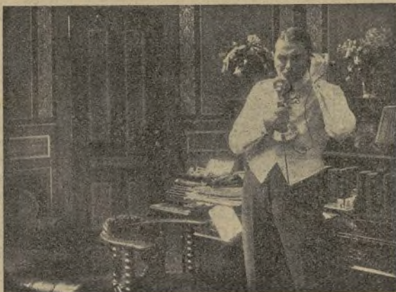
Una escena de la película Los cuervos

El tributo, «Vitagraph» (dramática) 562 metros.