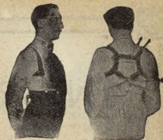
Con Benefactor El Benefactor de espalda

Riera San Juan, 8 - BARCELONA que mandará folleto gratis a quien lo pida