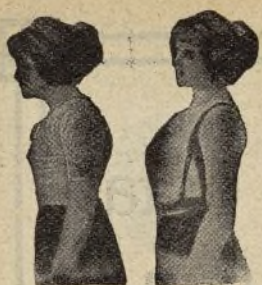
Sin Benefactor Con Benefactor