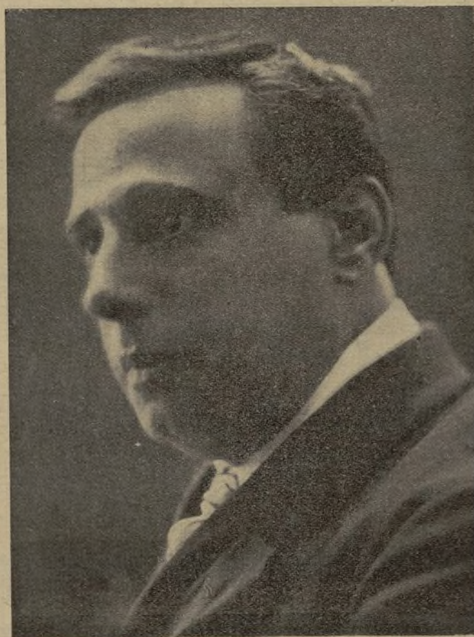
Sr. San'olaria, protagonista de la película El cuerpo del campamento , que ha editado la marca española «Segre Films»

chachos que siguen con ojos ávidos todas las abyecciones que en la cinta se les enseña, hemos temido que muchos de ellos aprendan demasiado bien la lección que se les da. Cuando estos muchachos hayan cumplido los veinte años ni el latrocinio, ni la prostitución, ni el apachismo tendrá un solo secreto para ellos. Conocerán todos los narcóticos, todos los venenos, todas las armas; sabrán cómo se escala, cómo se asesina y cómo se escapa.