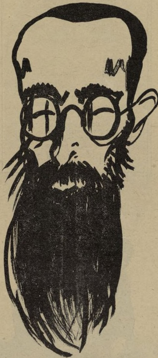
D. Ramón del Valle-Inclán