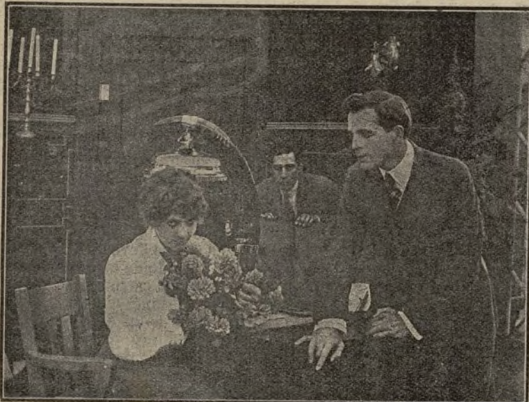
Los dos caminos