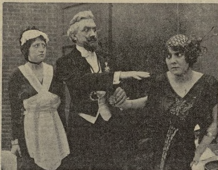
Al borde de la guerra

En Inglaterra y a consecuencia de la guerra europea los anuncios solicitando y ofreciendo colocaciones para personas entendidas en el ramo cinematográfico, son cada día más numerosos, pues existe una gran carencia de personal con motivo de la movilización.