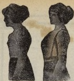
Sin Benefactor Con Benefactor