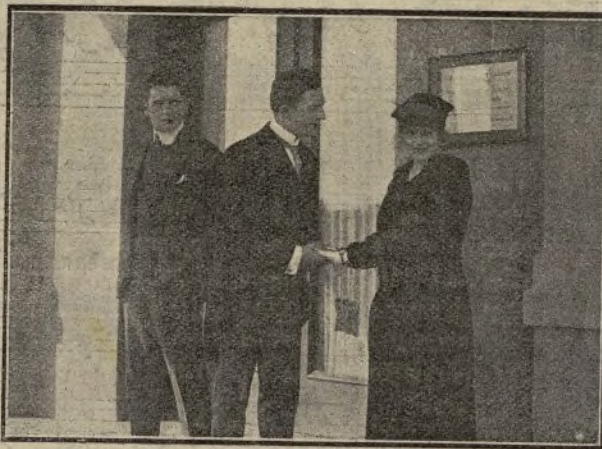
El amor no tiene ley

La Condesa Drillard razona la teoría que en estas palabras basa, con palabras persuasivas, y en el tono ameno y grato de una dulce