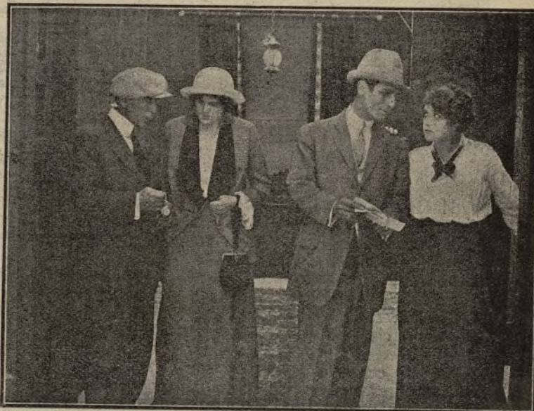
Los dos caminos