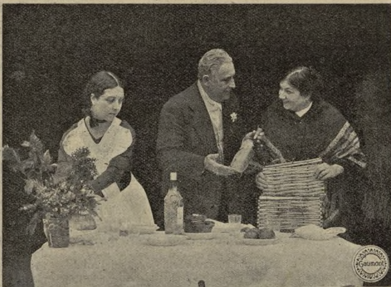
Bodas de plata

castle, pero se encuentra tan turbado que no se atreve a levantar los ojos para mirarla y se deshace de la entrevista de la mejor manera que puede. Más tarde, no obstante, al encontrar a miss Hardcastle vestida con el traje de casa que su padre le hace poner cada noche, la toma por la camarera, y en el acto, con toda familiaridad, se va haciendo intere-