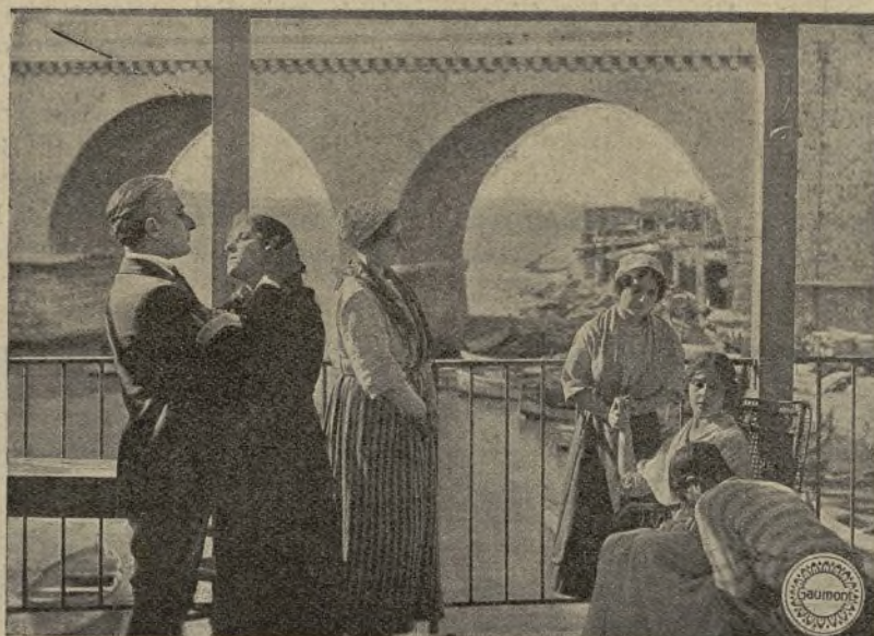
Bodas de plata

nen una gran sorpresa cuando le ven aparecer con las «antigüedades» que habían enterrado. Deben combinar otro plan y dicen a Jorge que han encontrado una estatua muy hermosa, que es Magda disfrazada, y él cuando la ve siente por ella un verdadero amor. Al mismo tiempo viene el comerciante con una factura de importe muy crecido, pero el padre no se enoja, pues ya ha encontrado un yerno, que seguramente hará feliz a su estimada hija.