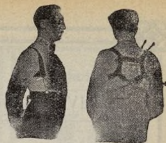
Con Benefactor El Benefactor de espalda

Riera San Juan, 8 - BARCELONA que mandará folleto gratis a quien lo pida