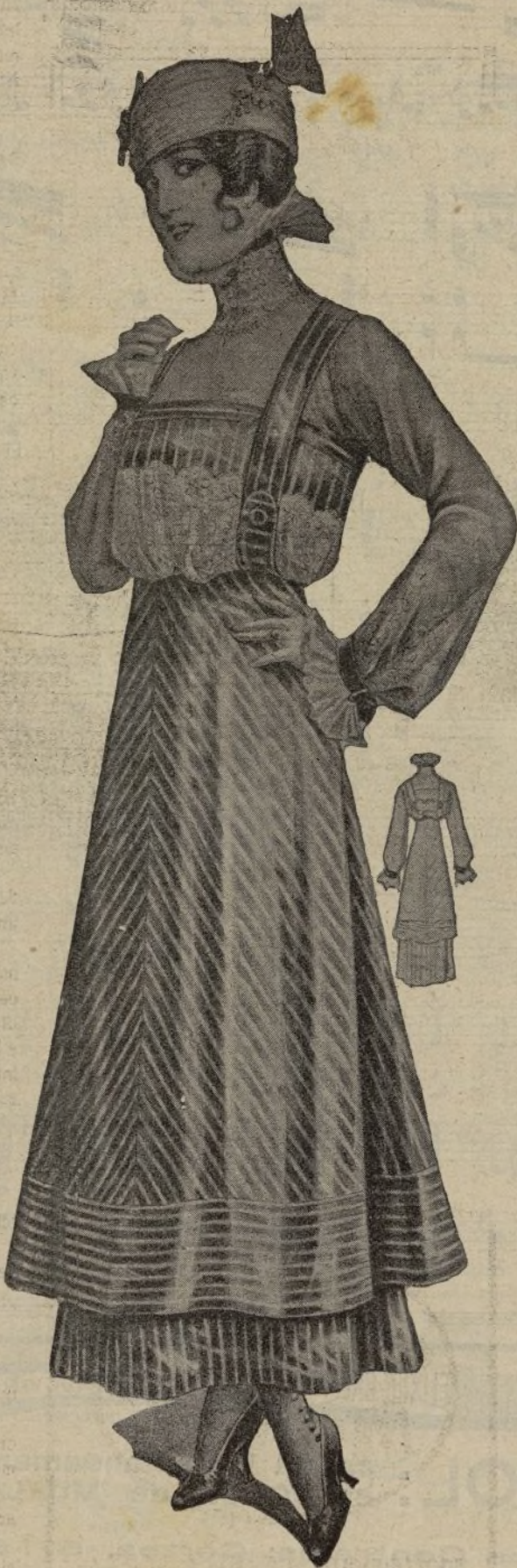
Vestido de seda negra, de pequeño listado blanco. Falda lisa; sobrefalda de media capa con jaretón al través en el bajo. Blusa de pita blanca recubierta de gasa moteada; coselets y tirantes como la falda, y sobrecoselets de encaje.

Pero los nuevos adaptadores de la cosa que anoche se estrenó en la Zarzuela han tenido la rara habilidad de quitar a la obra todo el in-