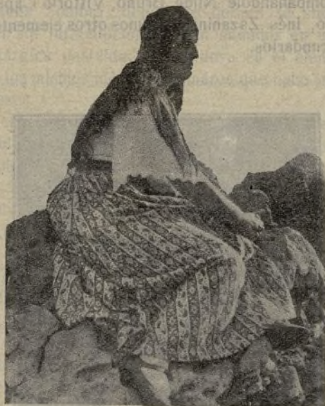
La leyenda de la roca negra

La pobre viuda, rendida de trabajar rudamente para ganar muy poco, había enfermado. La pobre criatura comprendía ciertamente que su madre sufría tanto por el hambre que pasa-