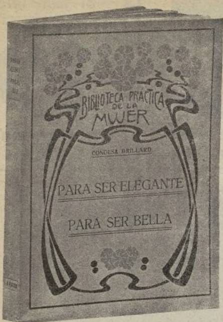
Facsimile muy reducido de la obra

Para ser elegante-Para ser bella inicia la serie de diez volúmenes que ha de formar la BIBLIOTECA PRÁCTICA DE LA MUJER. Cada uno de estos libros será una adaptación a nuestra lengua, a nuestras costumbres y a nuestros gustos, de los publicados en París con éxito extraordinario por la Condesa Drillard .