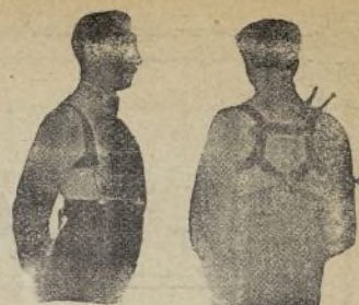
Con Benefactor El Benefactor de espalda

Riera San Juan, 8 - BARCELONA que mandará folleto gratis a quien lo pida