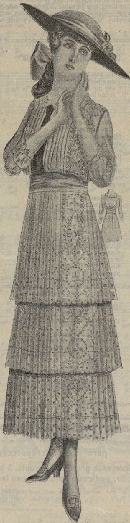
Elegante toilette de muselina moteada Falda de tres volantes plisados, blusa plisada también y ancha banda de arriba abajo de bordado inglés. Corbata negra

Entonces recordé que en los bajos de mi casa había una panadería. El vigilante, si-