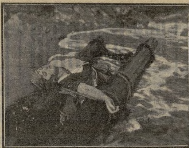
La leyenda de la roca negra Santiago Bolibar

No obstante haber conseguido a medias sus propósitos, Minoret-Levrault continúa persiguiendo ferozmente a la pobre niña y soborna al miserable pasante de notario Coupil, para que la joven se marche ma del país, humillada por los frecuentes insultos de que es víctima por los habitantes del mismo excitados por Coupil.