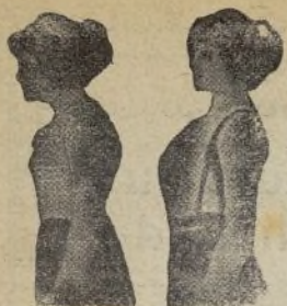
Sin Benefactor Con Benefactor