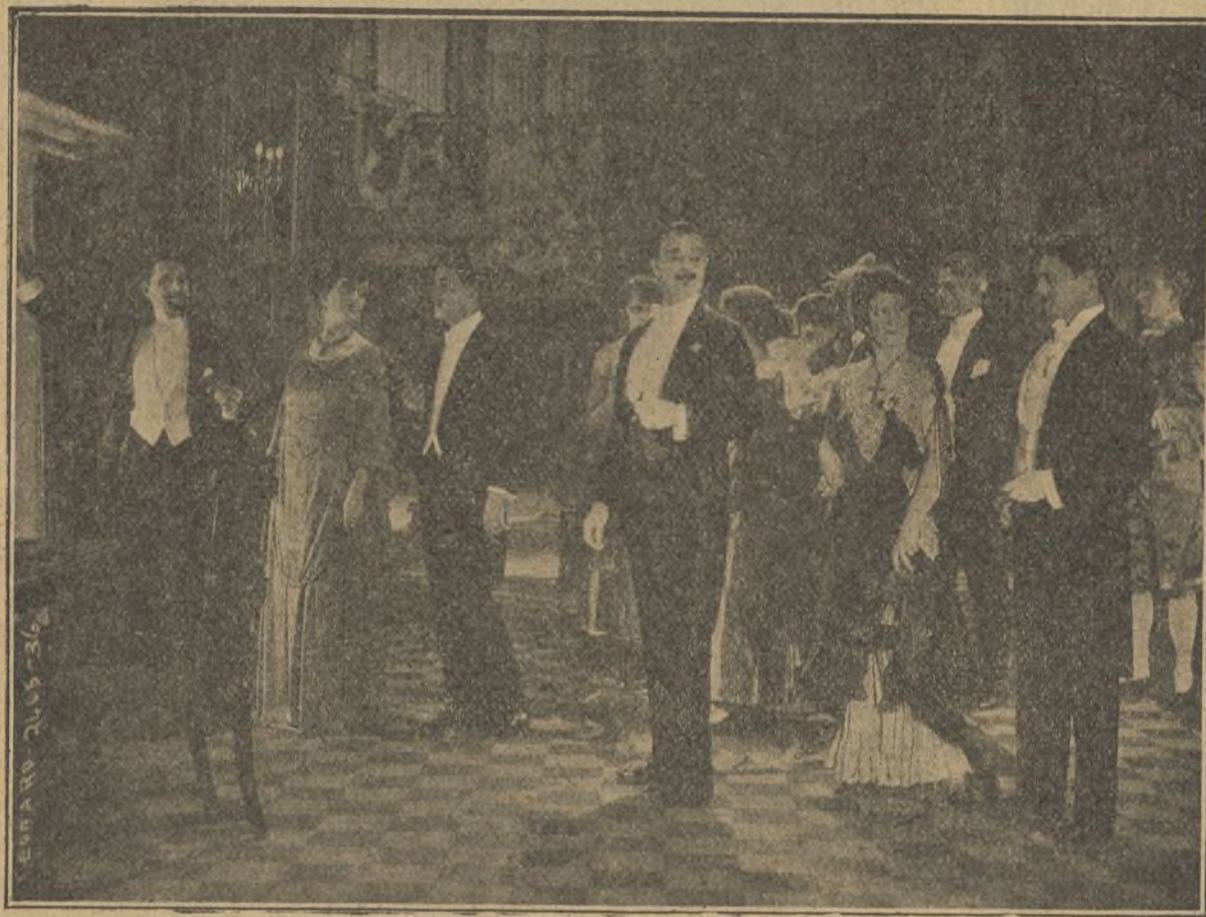
Una interesante escena de la película «La princesa virtud»

Bonitas piedras. Supongo que vendrás a venderlas; te doy por ella tres mil pesetas.