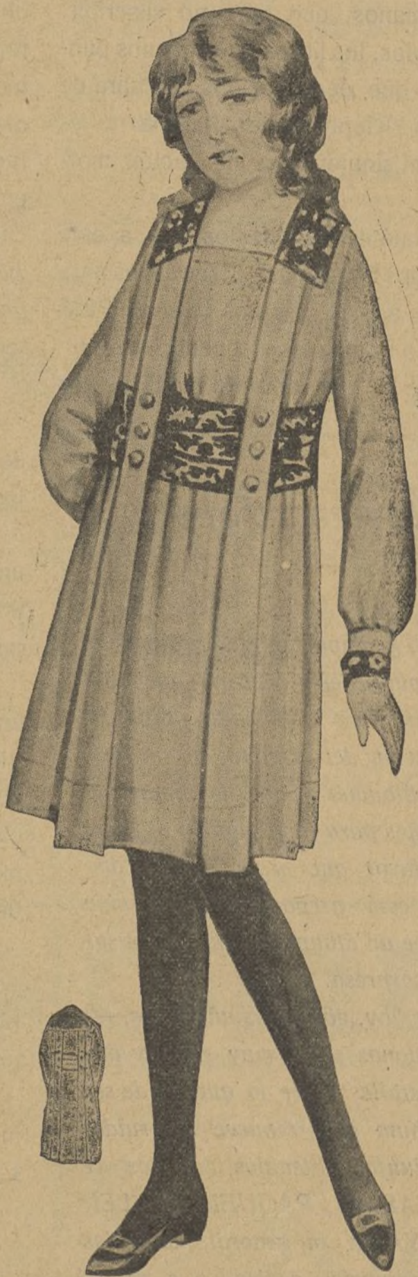
Vestido de pañete, para nena, compuesto de una túnica con canales que sostiene en la faja; ésta y el cuello son de terciopelo adamascado, de color que resalte armoniosamente

Se fué un momento mi esposo y el sombrero se dejó y cuando él vino, el tricornio por los picos le creció.