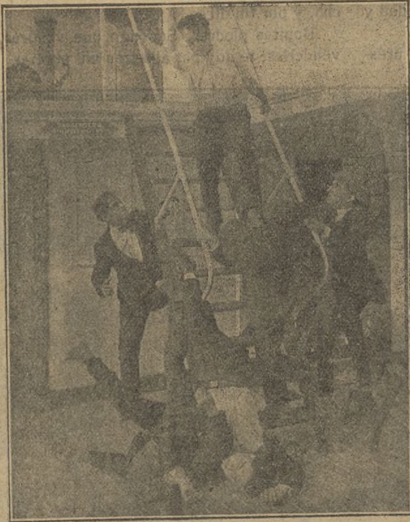
Una escena de la película «El buque fantasma»

— Vindicador! —exclama para sí el cuita-