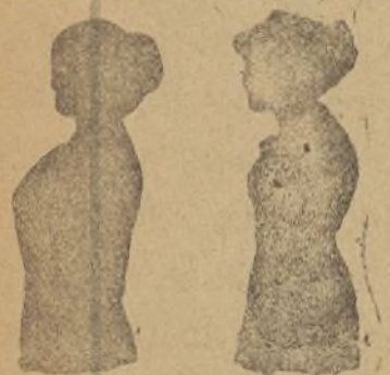
Sin Benefactor Con Benefactor