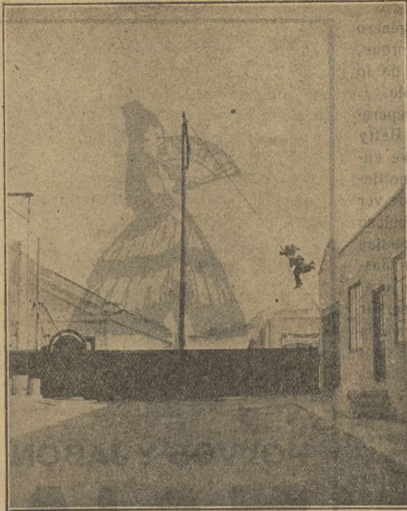
Una emocionante escena de la película «El Buque Fantasma».

Al entregar el plano a su hija, Lee le mostró una carta de su compañero Gaston, en la que éste le advierte que la muerte que tenía premeditada para él, la sufriría Miles Gaston, sus herederos o allegados. «El encargo que te doy, hija mía, está preñado de dificultades. Mis enemigos te acecharán constantemente; pero del que más debes prevenirte, es del hombre con una cicatriz en forma de