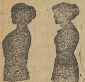
Sin Benefactor Con Benefactor