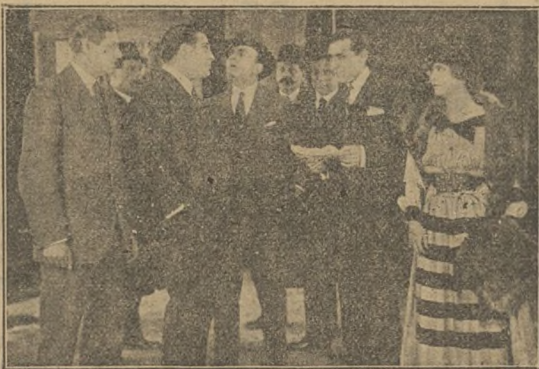
Una escena de la interesante película «Arsenne Lupin»

para los seres felices, con su perezoso resbalar, entre angustias, para Maillefort y la condesa María. Al país extranjero en que Ubaldo buscara refugio, llegó una carta de su adorada; huracán violento que arrancaba de cuajo el árbol, aún robusto, de sus ilusiones; condena bárbaramente inapelable, como el lasciate ogni speranza que viera el Dan-