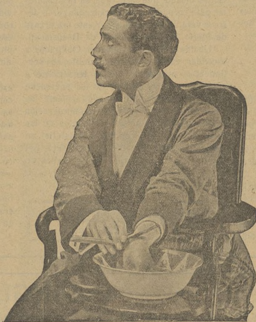
Genial intérprete, protagonista de la película «Geo el misterioso»

La macabra procesión sigue su marcha hacia el encendido cráter del volcán, en donde el jefe de la tribu se dispone a sacrificar a su víctima para apaciguar las iras de su vergativolos. Gaston y Armando contemplan impávidos desde lejos la espeluznante ceremonia.