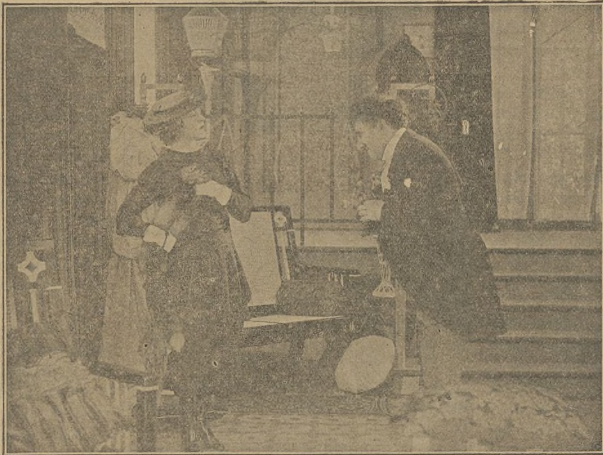
Una interesante escena de la magnífica película «La Princesa Virtud»

En la primera, «Sobria», la eximia artista hace un nuevo alarde de su impecable arte, colocándose a una altura tal vez no alcanzada en sus anteriores creaciones, lo que hace augurar para las restantes jornadas un éxito clamoroso y definitivo.