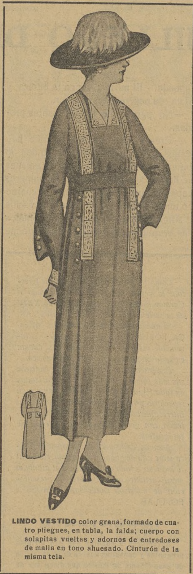
LINDO VESTIDO color grana, formado de cuatro pliegues, en tabla, la falda; cuerpo con solapitas vueltas y adornos de entredoses de malla en tono ahuesado. Cinturón de la misma tela.