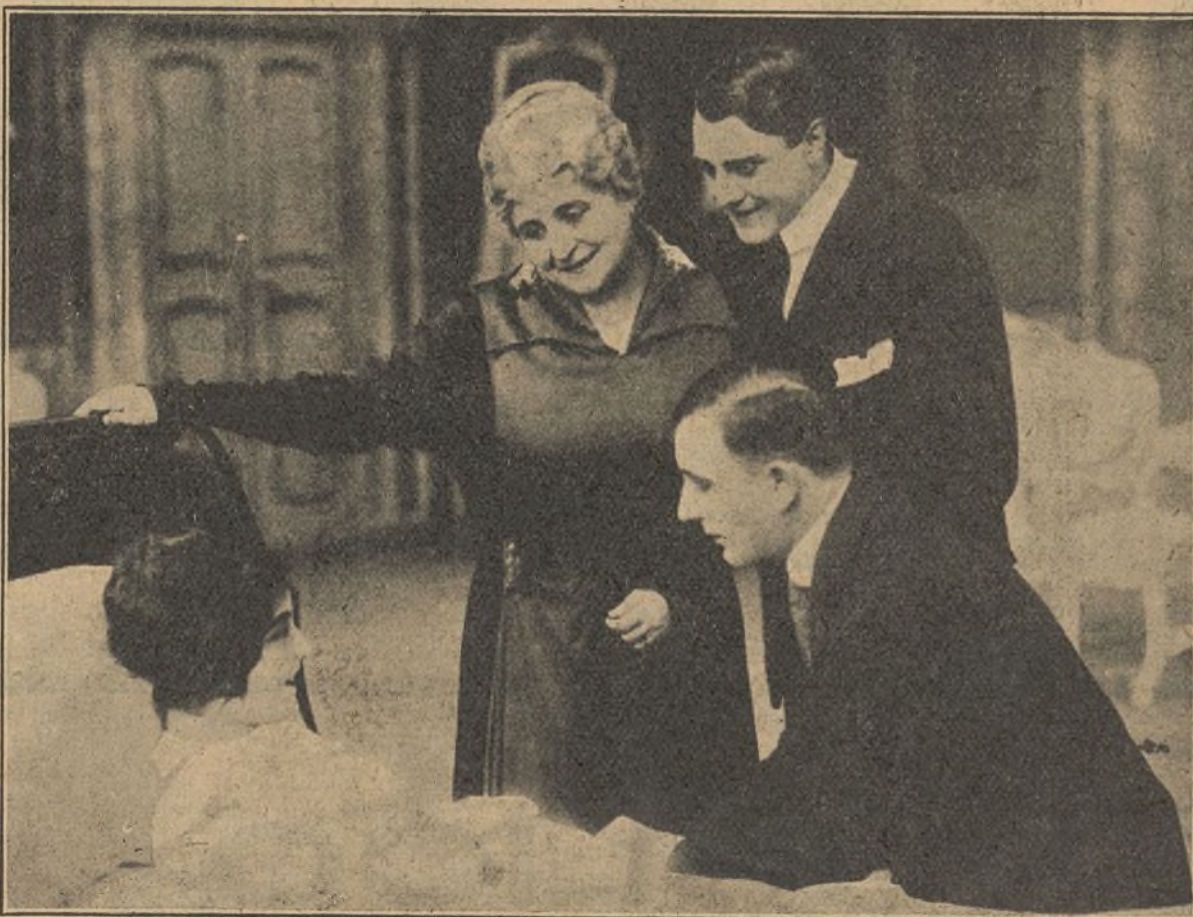
Una escena de la película «Derecho de amor»