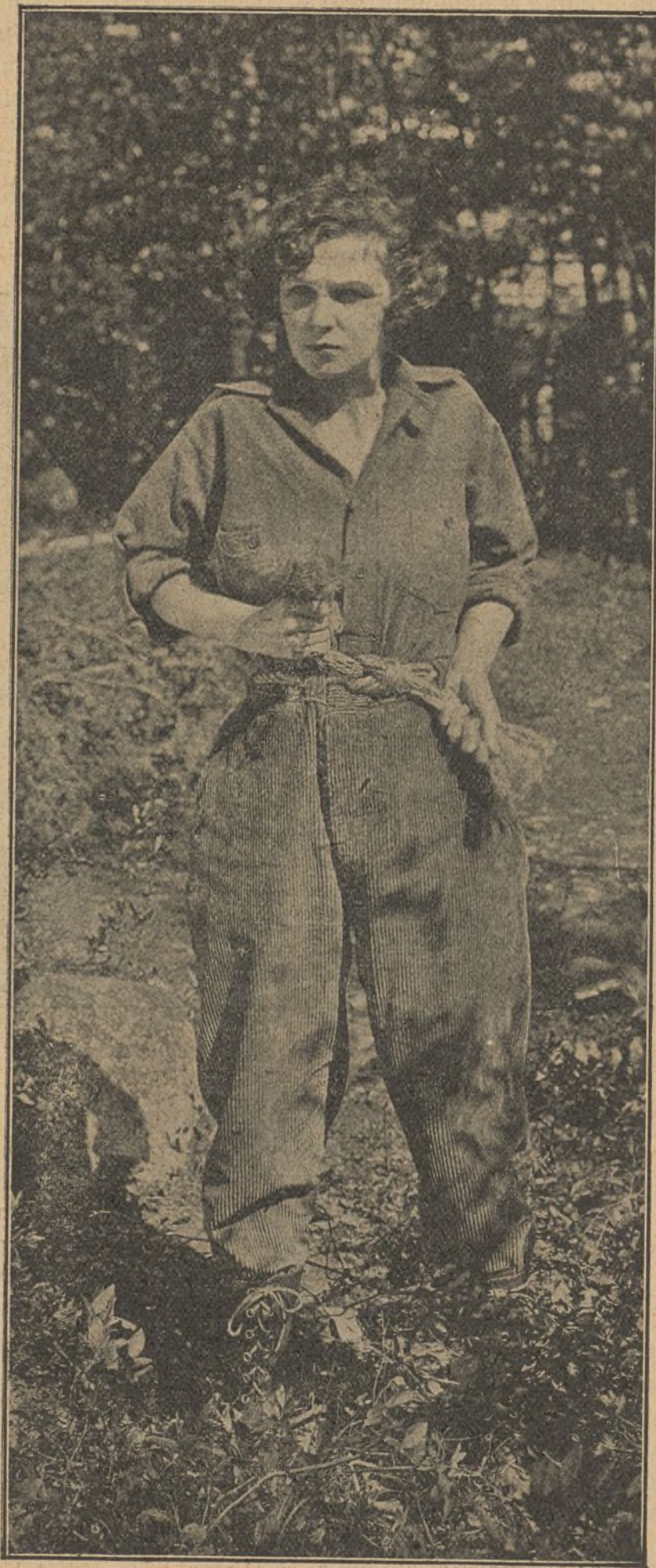
Una escena de la película «Robinsones modernos»

—Hay gente afortunada en el juego— exclama sentenciosamente la pitonisa;— gente afortunada en amor... Su horóscopo me dice que es usted afortunada en ambas cosas: veo a su estrella dominar todas las eventualidades. No tema usted,