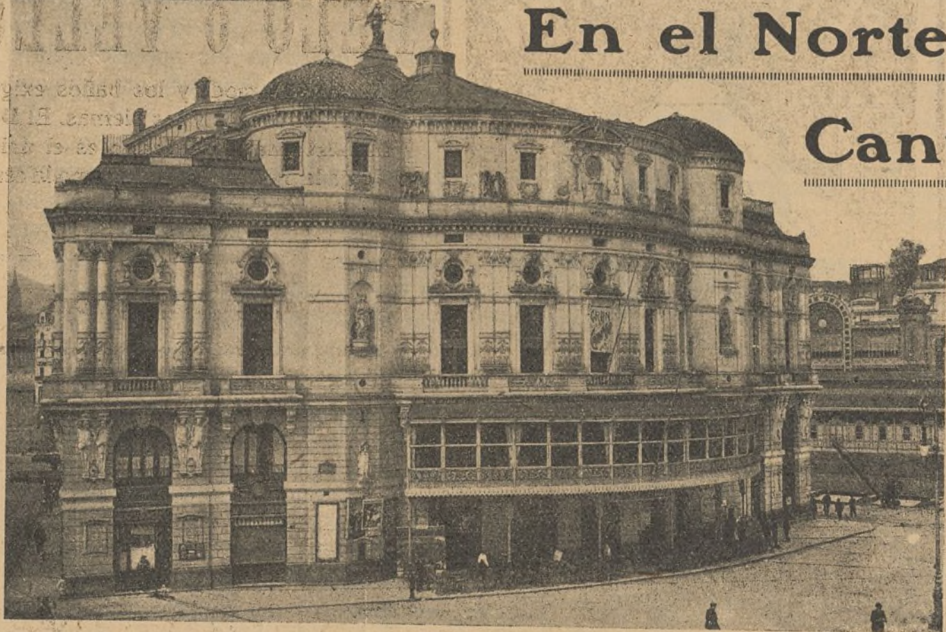
BILBAO.—Vista general del reconstruido Gran Teatro Arriaga