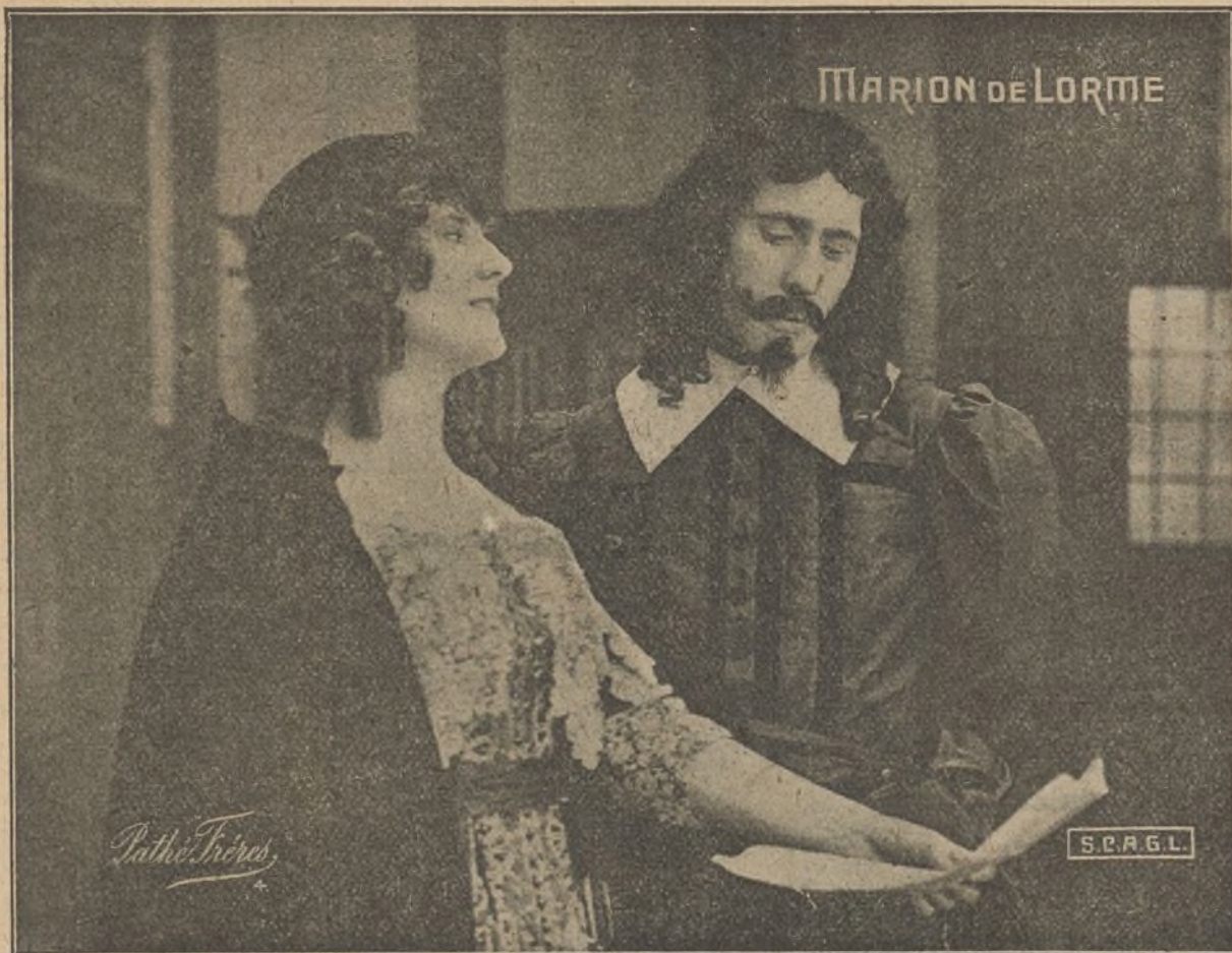
Una escena de la película «Marion de Lorme»

Se dedicará en lo sucesivo a la operación de una nueva empresa cinematográfica internacional que aun no tiene nombre y que servirá de órgano de distribución de películas por todo el mundo incluso los Estados Unidos y Canadá.