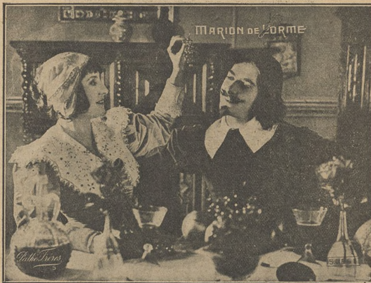
Una escena de la película «Marion de Lorme»

Una hora después, Le Page y Ruth desembarcaban en Nueva York.