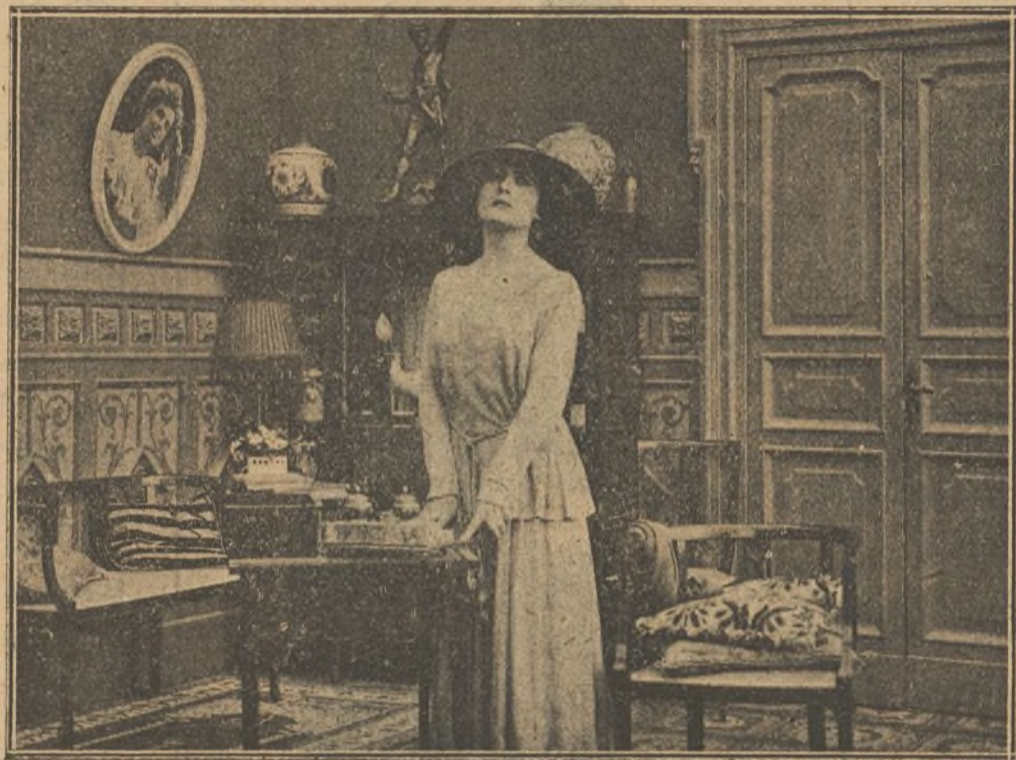
Una escena de la película «Los siete pecados capitales», Soberbia .

plaza, nos ruega la inserción de la siguiente carta, lo que con sumo placer hacemos.