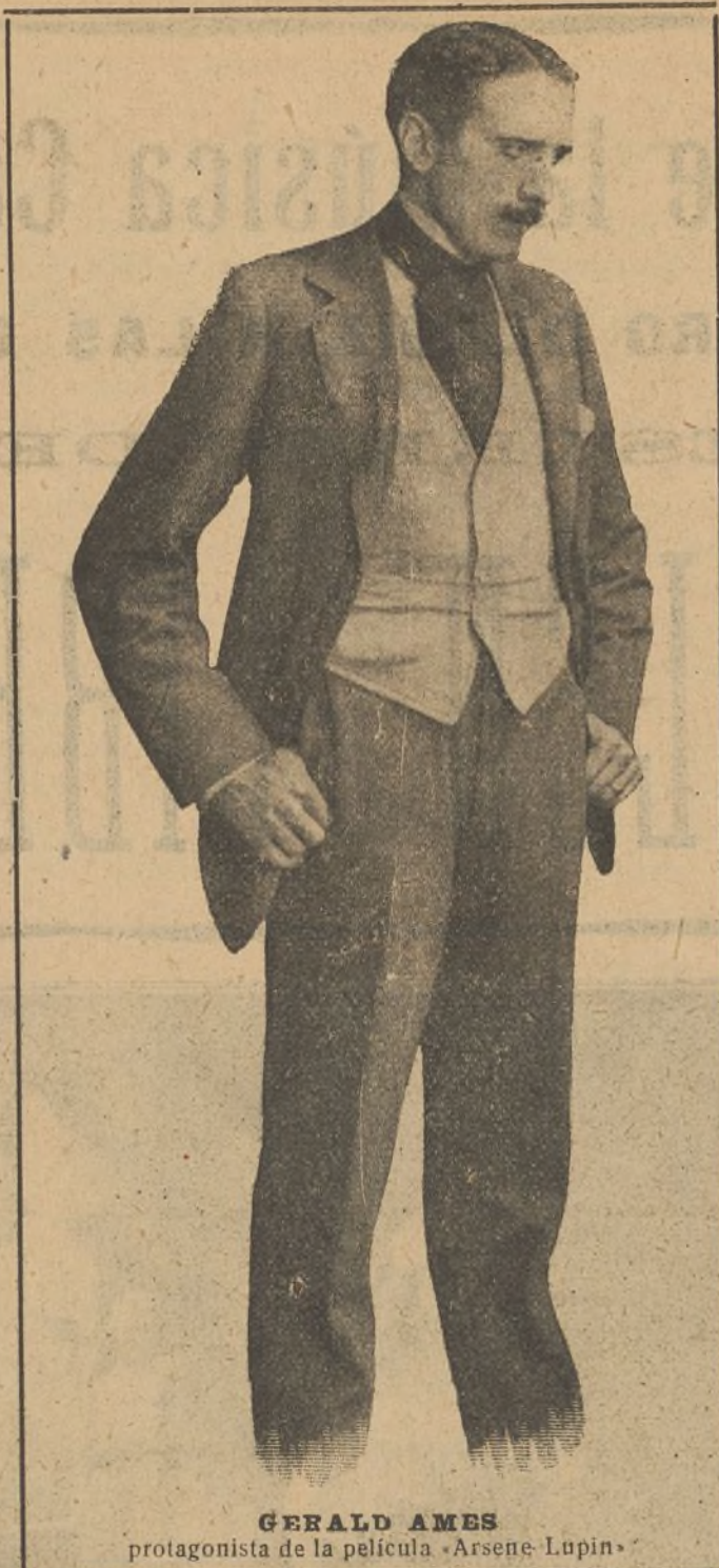
GERALD AMES protagonista de la película «Arsene Lupin»

Herminia, hija del rey de Antioquia y apasionada por Tancredo, viste la armadura de Clorinda para ver a su amado; su voz semejante a la de la heroí-