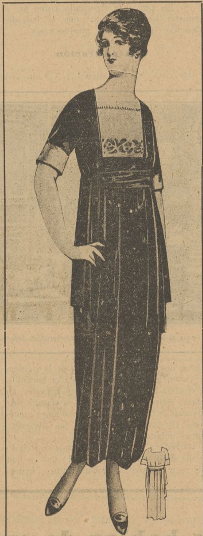
ELEGANTE TOILETTE de terciopelo negro. La falda es recta; lleva faja de lo mismo que cuelga en doble por ambos lados. Cuerpo liso muy abierto sobre bajo blanco, bordado en azul vivo, como la faja.