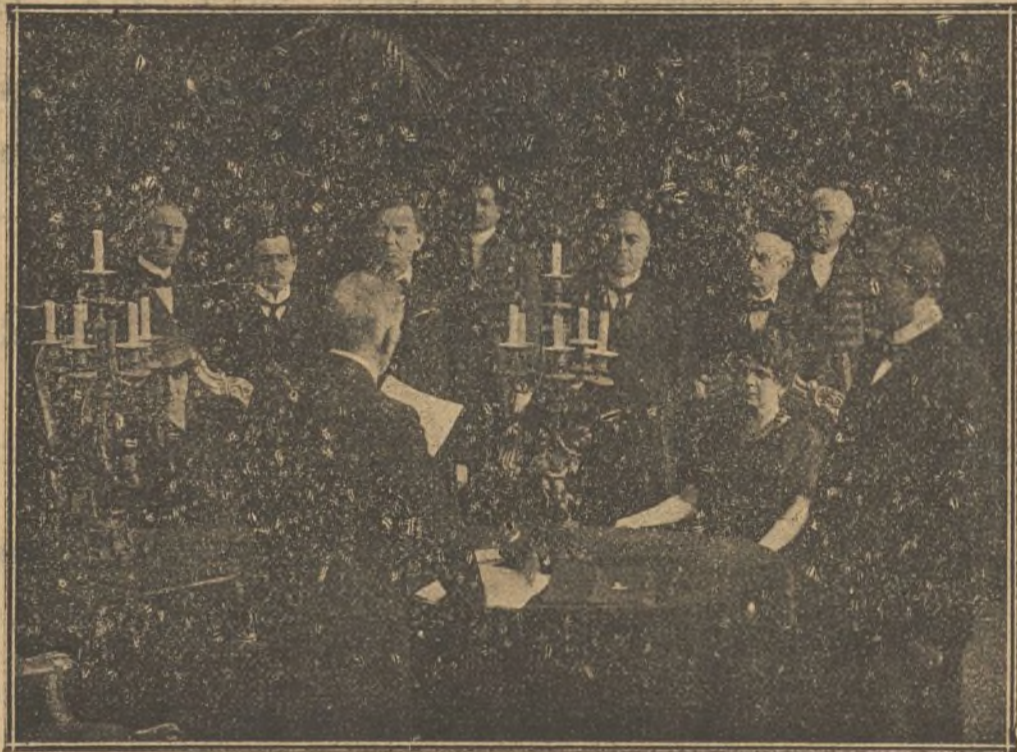
Una escena de la película "Los siete pecados capitales", Soberbia .

que Miles Gaston y Armando les seguían los pasos, sacaron a Betty del automóvil y la embarcaron en una locomotora sin freno, creyendo que de esta manera el «Hombre Misterioso» acudiría en su auxilio, como era su costumbre cuando Betty se hallaba en un grave peligro. Más Gaston y Fay observaron la maniobra de los espías y, acercándose a la locomotora, que corría a toda velocidad, le arrojaron una