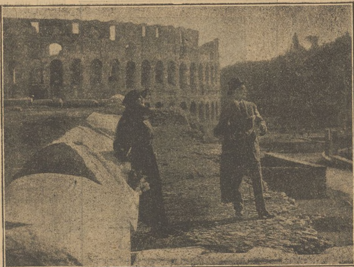
Una interesante escena de la hermosa película «El otoño del amor».

La ornamentación que habrá para armonizar el recuadro de la pantalla cinematográfica con el hemicycle del «Palau de la Música Catalana», ha sido confiada al conocido escenógrafo don Salvador Alarma, quien lo ha dispuesto recordando las dos columnas de bronce, de unos once metros de altura, que Salomón hizo construir por Hiram. Unirá las dos columnas, una imitación del velo sagrado, con bordados de carácter religioso, velo que tapaba el holocausto y candelabro de Moisés el que al descorrerse, dejará al descubierto la pantalla cinematográfica.