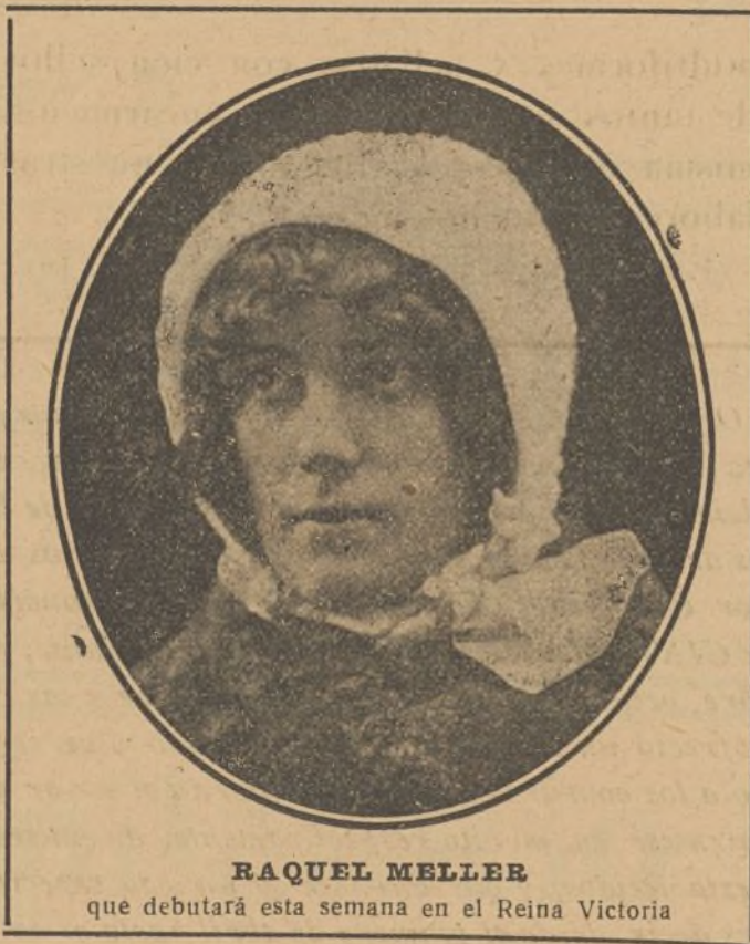
RAQUEL MELLER que debutará esta semana en el Reina Victoria