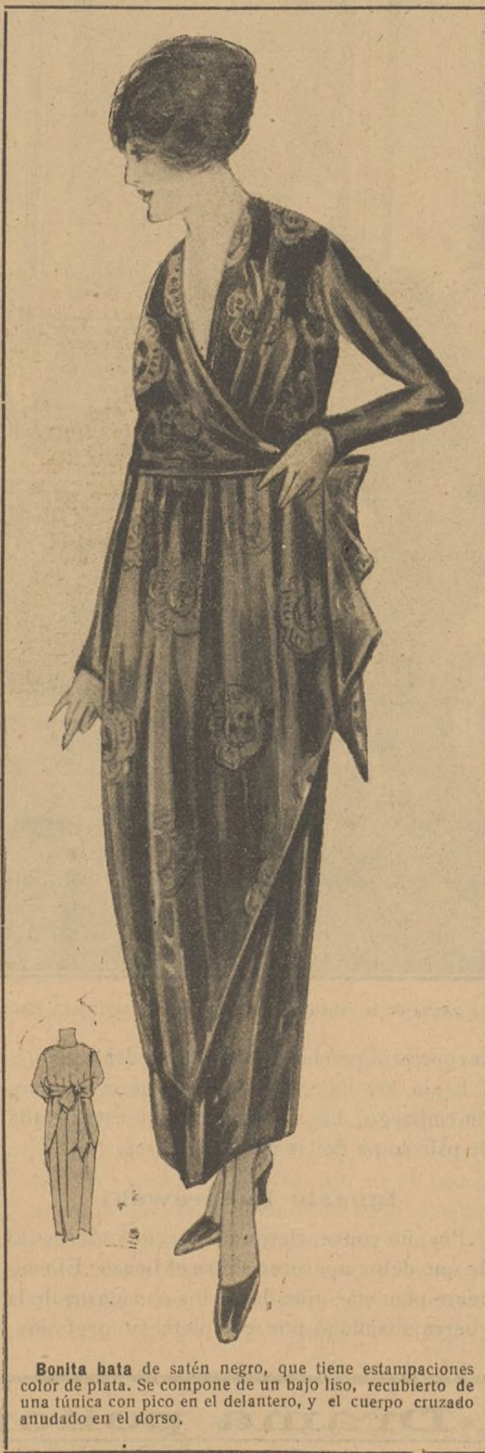
Bonita bata de satén negro, que tiene estampaciones color de plata. Se compone de un bajo liso, recubierto de una túnica con pico en el delantero, y el cuerpo cruzado anudado en el dorso.

No deje V. de comprar el número XXV de Música Popular dedicada al Maestro Barta