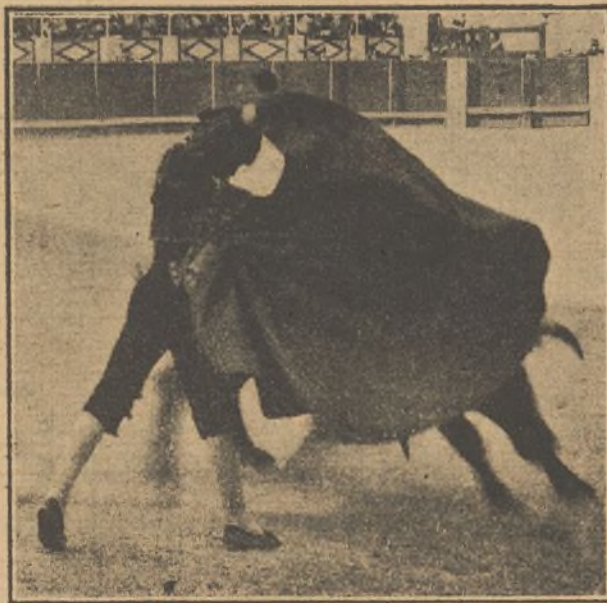
Chicuelo en una gran verónica

La faena de muleta en el 2.º fué movida y no mandó nunca. Dió un pinchazo,