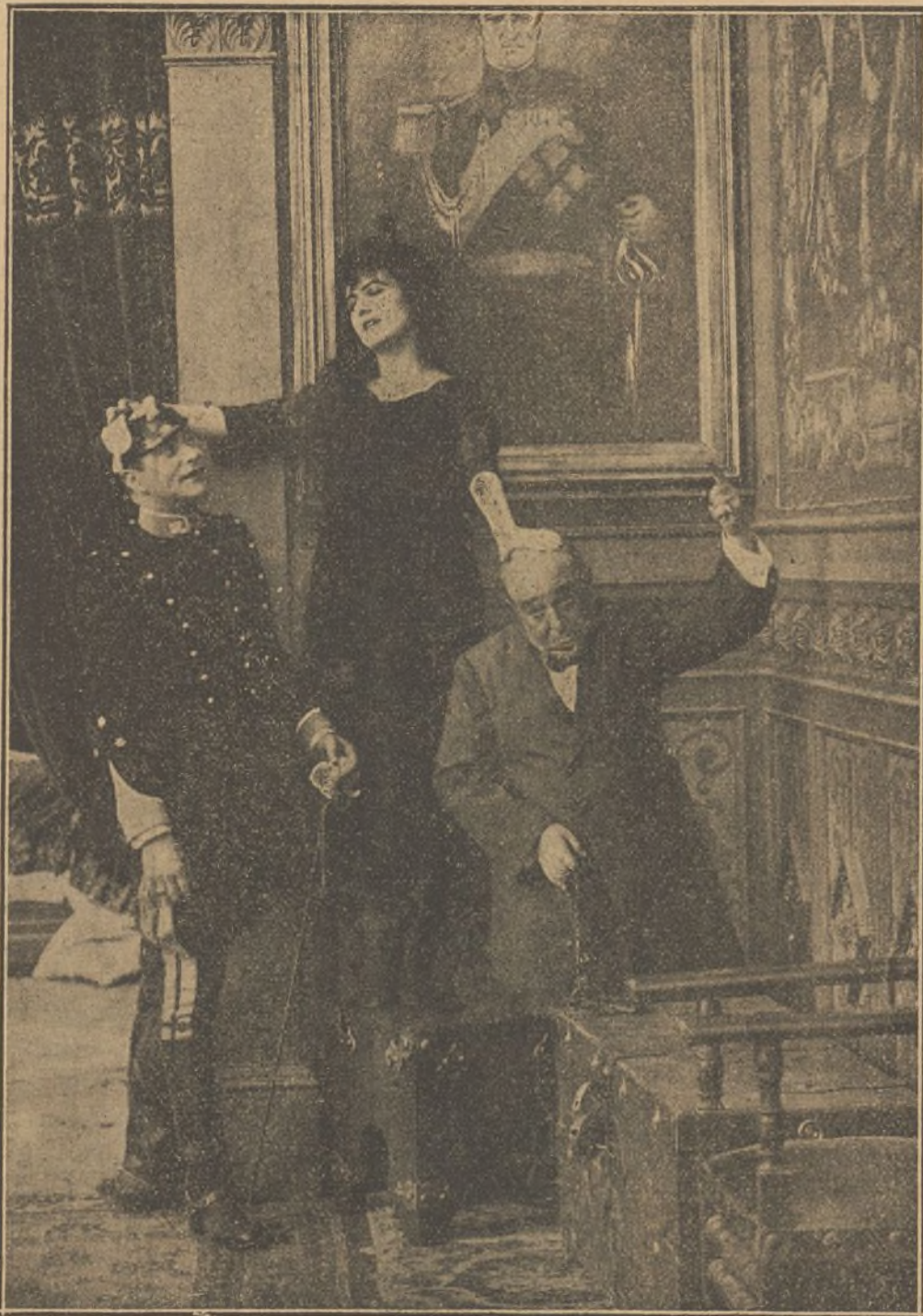
Una escena de la película «Los siete pecados capitales», Gula

Nosotros mejor informados, podemos anticipar a nuestros lectores la falsedad de tal noticia, pues Mary Pickford contrajo matrimonio hace varios años con el célebre artista Owen Moore, con el que estuvo a punto de divorciarse meses atrás.