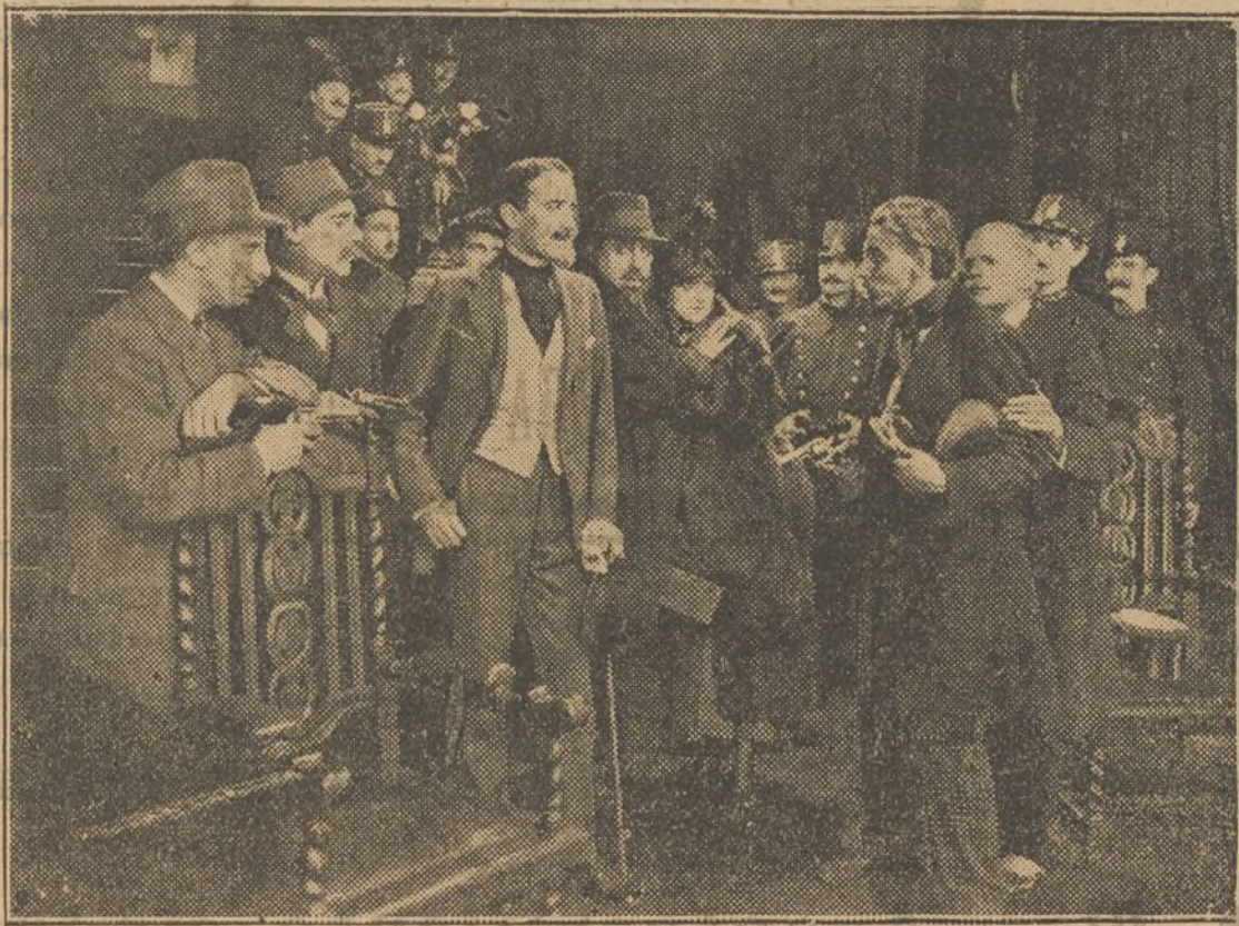
Una escena de la interesante película "Arsenio Lupin"

Entre tanto, en la habitación de Lorini alcanzaba la tragedia su grado más agudo, María, viendo el doloroso acabamiento de sus esperanzas, había caído por tierra, presa de un violento ataque convulsivo; y la enferma, al choque de tan terribles conmociones, sintió paralizarse en su pecho la máquina vital y dejó su existencia en un estertor rápido, definitivo. María al volver de su paroxismo y ver a su tía muerta, lanzó un grito de horror; pero luego mirando el oro que lanzaba sobre el mísero lecho de la anciana sus amarillos reflejos, maldijo la avaricia insensata que de tal modo cegaba las fuentes de la bondad en los corazones.