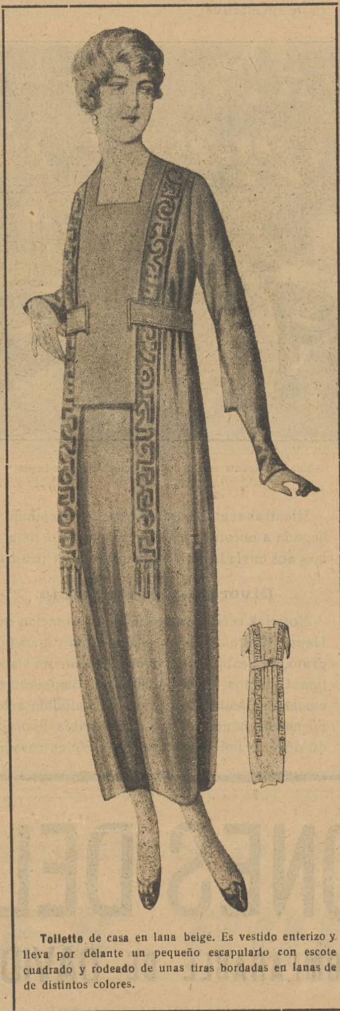
Tollette de casa en lana beige. Es vestido enterizo y lleva por delante un pequeño escapulario con escote cuadrado y rodeado de unas tiras bordadas en lanas de de distintos colores.

Representante A. AMBROA - Claris, 80 - Barcelona