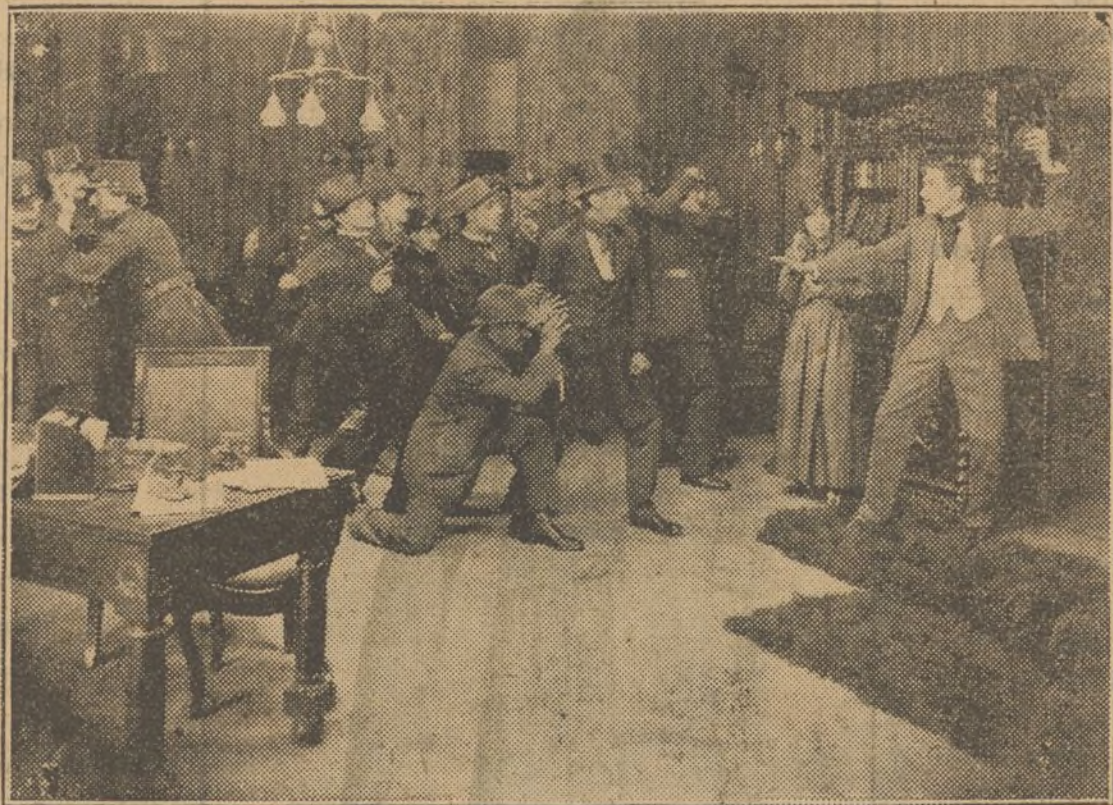
Una interesante escena de la película «Arsenio Lupini»

tra vista cifras que nos asombran... Inglaterra ha pagado por la exclusividad de esta película 950,000 dollars, o sea aproximadamente unos cinco millones de pesetas. El Estado de California, solamente, ha pagado 250,000 dollars... ¿Qué habrá pagado el audaz cinematografista que la ha adquirido para España? Los magnates norteamericanos con qué nación habrán comparado a España, para fijar el precio? Todo esto es misterio. Misterio impenetrable que el cinematografista en cuestión se encargará de revelarnos.