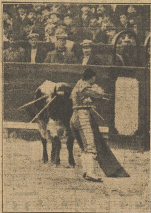
Chicuelo iniciando el volapié en su primer toro

Chicuelo. —(De azul pavo y oro). Ha toreado las dos primeras novilladas del año con los cuatro novilleros de más cartel: Méndez, Valencia, Casielles y Facultades. Bueno, pues a los cuatro los ha borra-