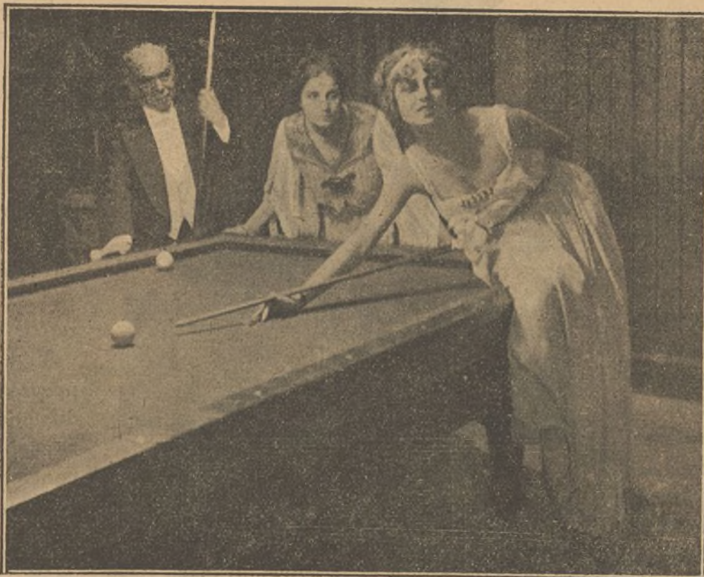
Una escena de la interesante película «La Reinecita Isora»

Debido al rápido desarrollo que en breve