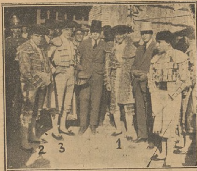
Los matadores de mañana. Joselito, Belmonte y Sánchez Mejías que toma la alternativa en la Monumental de Barcelona