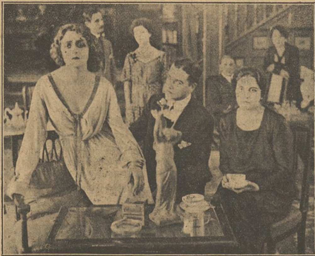
Una escena de la interesante película «La Reinecita Isora»

El millonario está consternado. Le consta que Arsénio Lupin es hombre que cumple su palabra. Y telefona a Guerchard —el Sherlock Holmes de Francia— rogándole envíe a