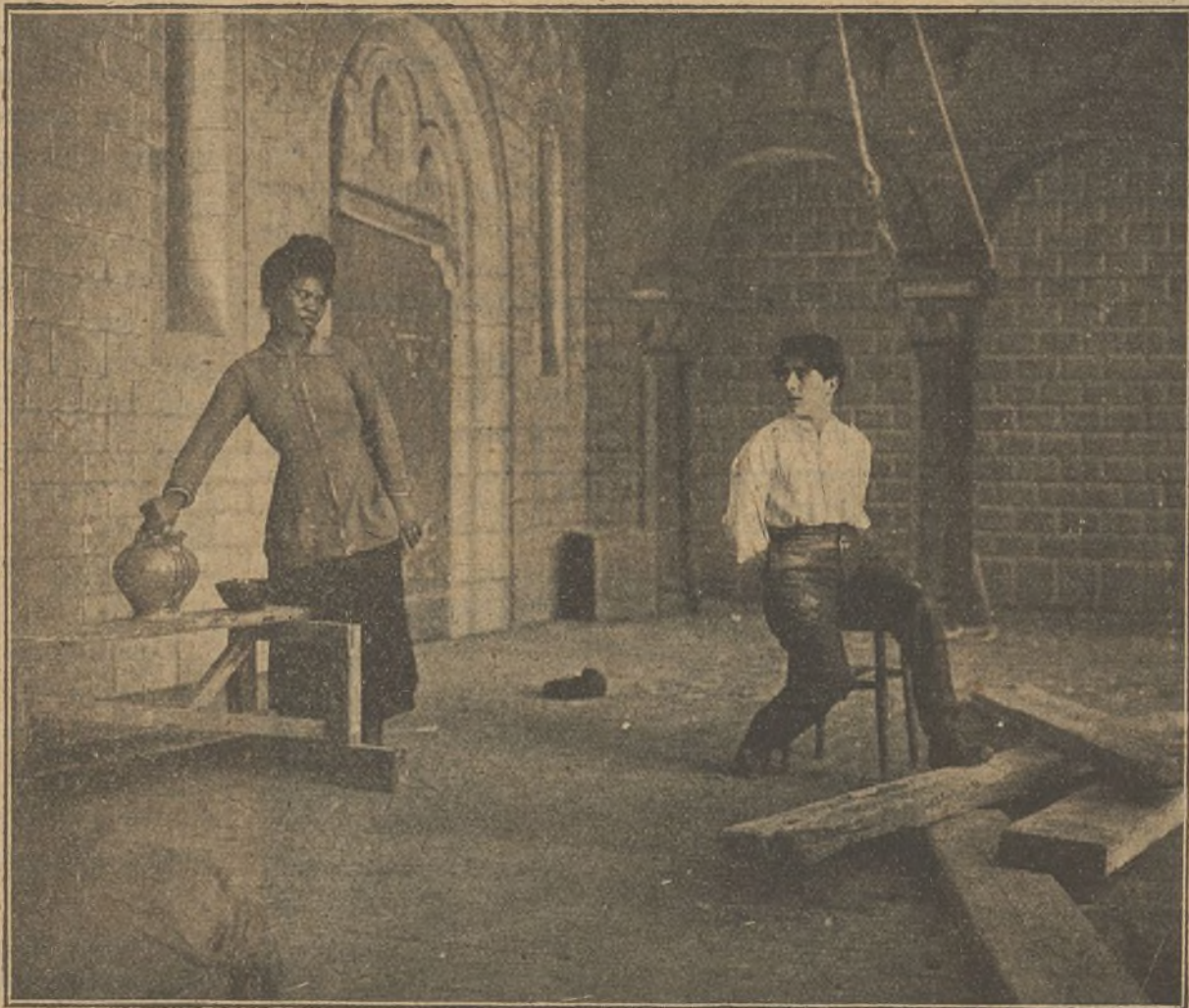
Una escena de la interesante película "Voluntad que vence"

Los minutos pasan para el policía lentos, incabables, como eternidades. Arsenio Lupin saca la petaca y ofrece un cigarrillo al policía. El sarcasmo y la ironía le sube a los labios. «Si yo fuera Arsenio Lupin — dice — habría puesto opio en ese cigarrillo.» El policía vacila. Pero al ver la perfecta sangre fría de su contricante que enciende otro cigarrillo, hace lo propio con el suyo. La calma abandona a Guerchard.