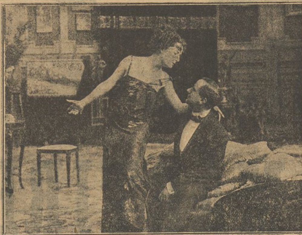
Una escena de la película Ira "Los siete Pecados Capitales".

El rico banquero Tom Bridge ha recogido a su sobrina Alicia, huérfana, educándola como si fuera su propia hija. El banquero tiene además otro sobrino, James Kayn, joven audaz, un poco aventurero y algo rebelde a sus consejos, así es que cuando éste viene a solicitar una comandita, Bridge se niega, cruzándose entre los dos hombres, con tal motivo,