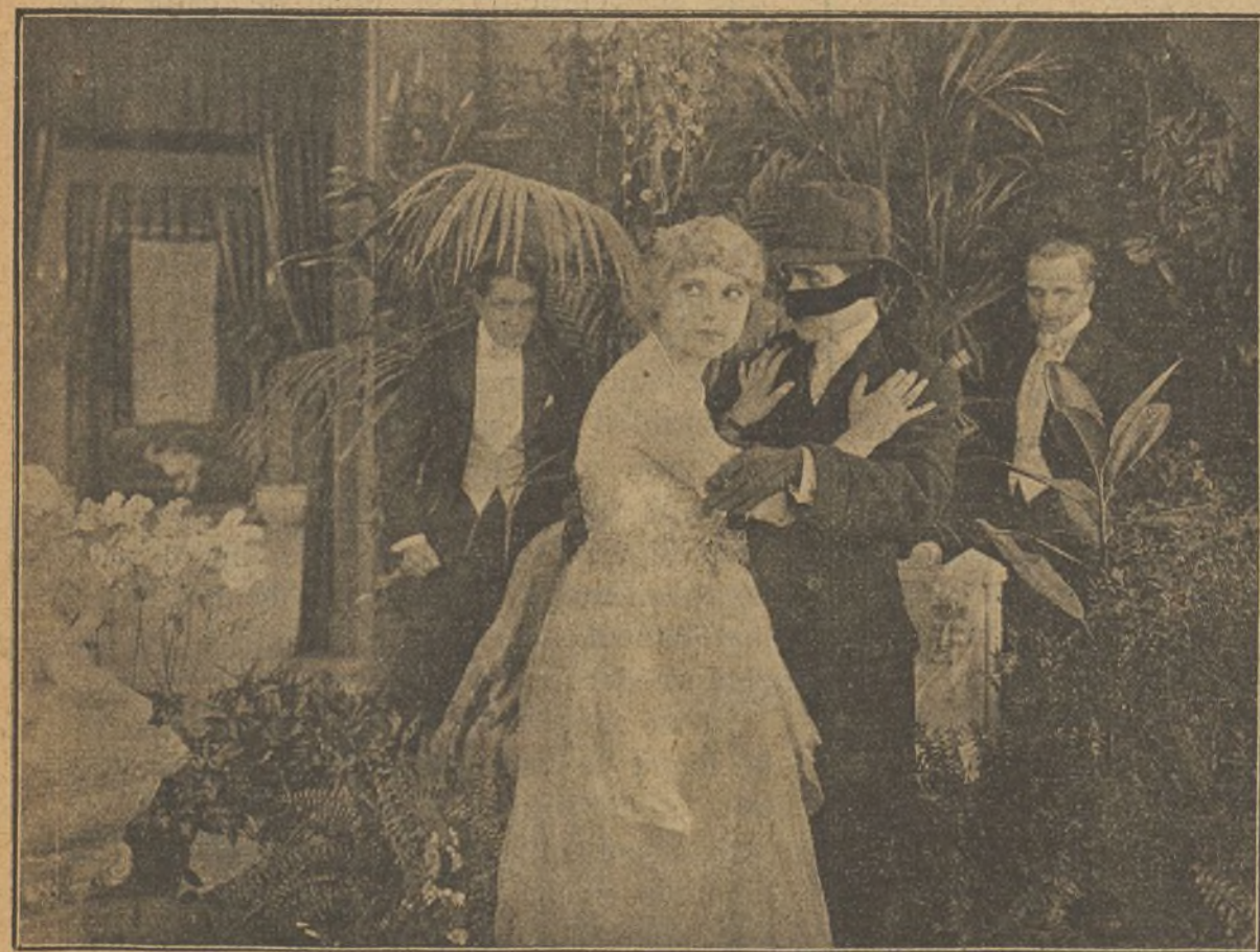
Una escena de la hermosa película «El misterio de la doble cruz»