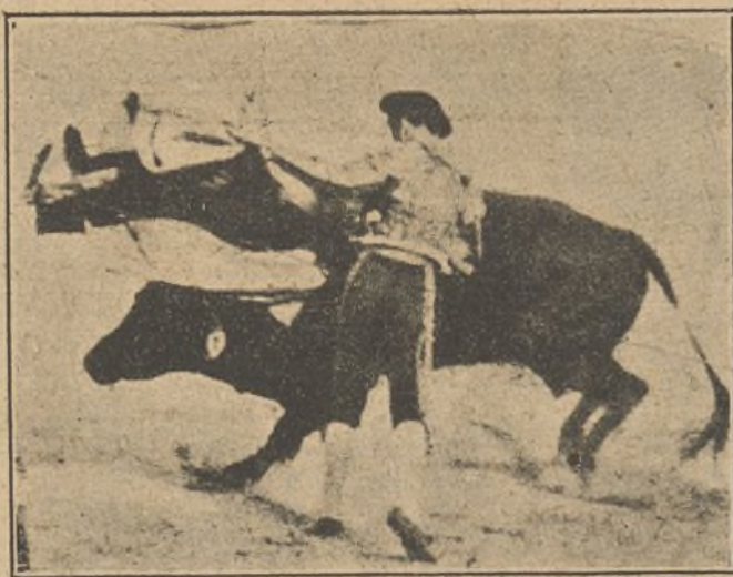
LIMEÑO, el domingo en Madrid.

Belmonte. —De azul eléctrico y oro.—Aunque el 2.º toro salió abanto y se iba del capote, Belmonte dibujó varias verónicas. Llegó el toro al último tercio quedadísimo, amansado. Pero gracias al temple maravilloso del torero, a ese mando suyo característico, el toro pasó unas ocho veces seguidas, ligado un pase con otro: parecía un solo pase. Se arrodilló después de espaldas al bicho y luego dió un molinete entre los dos pitones. Y cuadrado el parladé, entra Belmonte a herir, despacio, suavemente, se queda el toro, lo hace él todo y mete el estoque en la