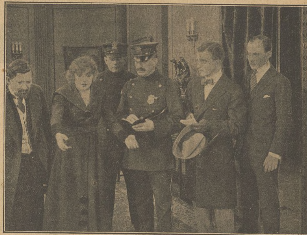
Una escena de la interesante película "El misterio de la Doble Cruz"

Obedeciendo a un interés diferente, los dos buscan el consentimiento de Miss Brewster, dando lugar a la lucha que tal rivalidad agsita entre ambos.