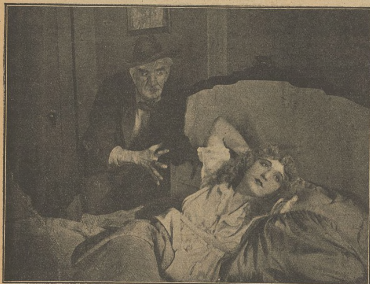
Una escena de la interesante película "El misterio de la Doble Cruz"