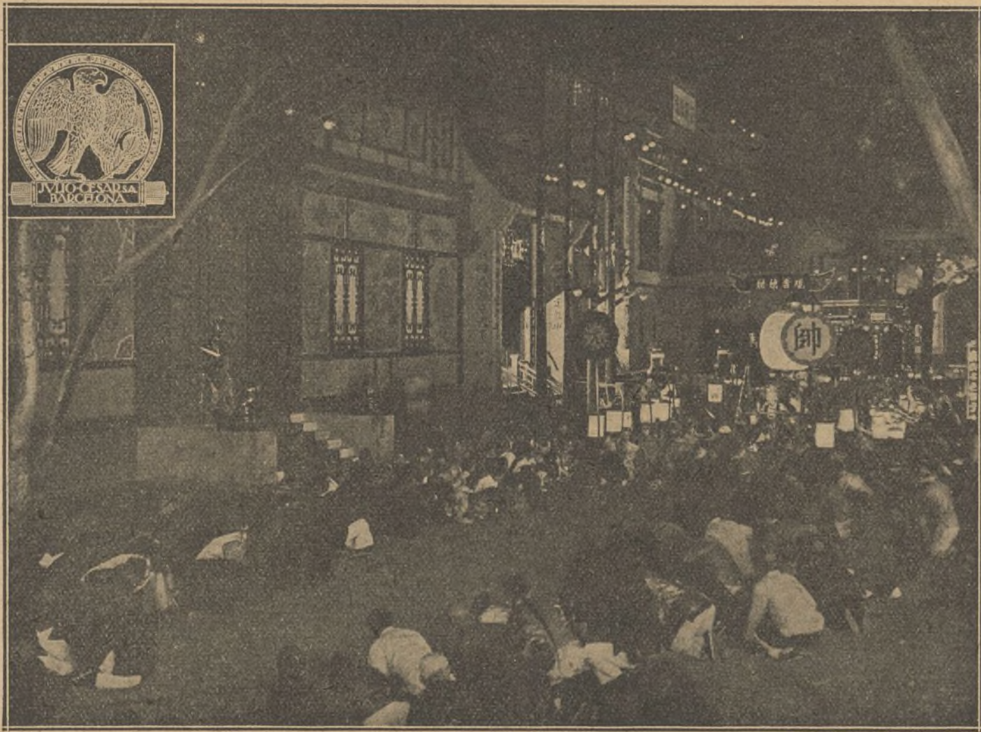
Una escena de la película «El farol rojo»

Vilaseca y Ledesma. —«Las fiestas de la Independencia Day en París», «La alcazaba de Rabat» (Marruecos), del natural, y el suntuoso drama, de 1.800 metros, «Los héroes del aire».