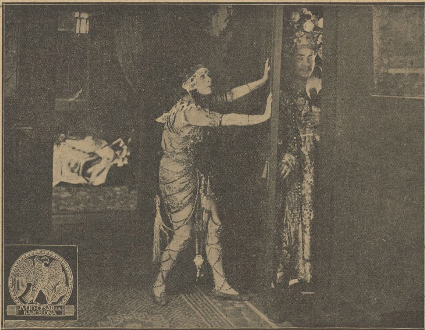
Una escena de la película «El farol rojo»

Y en el mismo minuto el amor, santificado por el heroísmo, aleteaba en una apartada cabaña, cerca de la playa, entre rumor de besos y de caricias dulcísimas.