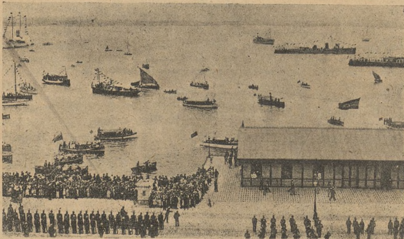
La bahía de Santander a la llegada de SS. MM.