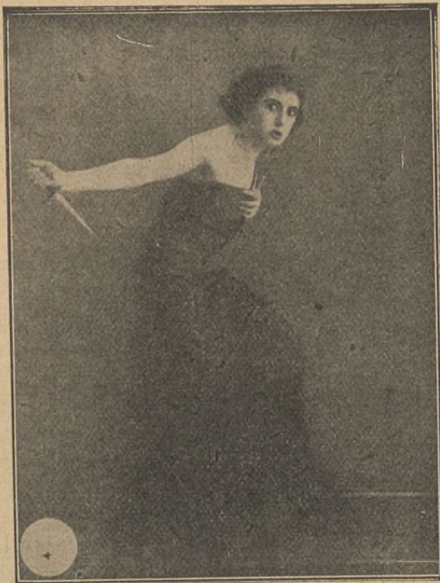
Francesca Bertini en la película «Lujuria»

róicas, se engrandeció la figura del valiente; compasiva, acudió a curarle una herida leve recibida en la contienda. El héroe, que era nada menos que el sobrino del