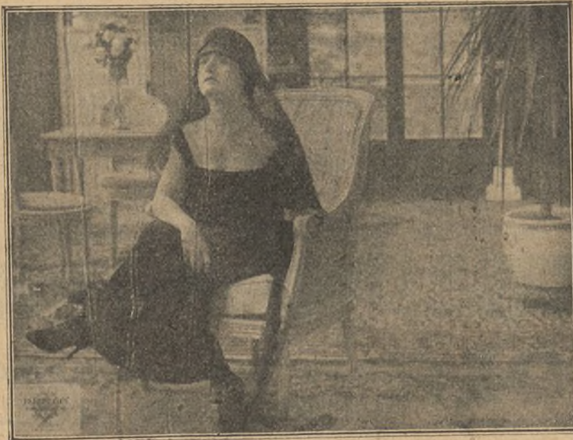
Francesca Bertini en la película «Lujuria»

Leonardo Pascal, que aquella tarde no había asistido al club, no pudo enterarse de esta maravillosa identificación de la duquesa de Miranda; otro asunto le inquietaba a él en aquellos momentos: el descubrimiento de quién pudiera ser el hombre feliz que reinaba en el corazón de Amelia; y lo supo por conducto de una agencia de informaciones. Así, mientras la hermana de Magdalena bebía dulces mieles en las palabras de su enamorado, en las promesas de un porvenir henchido de venturas inacabables, Pascal leía la carta en que se le informaba de que el novio de la costurera era el conde Franco, sobrino del príncipe Maximiliano. Y