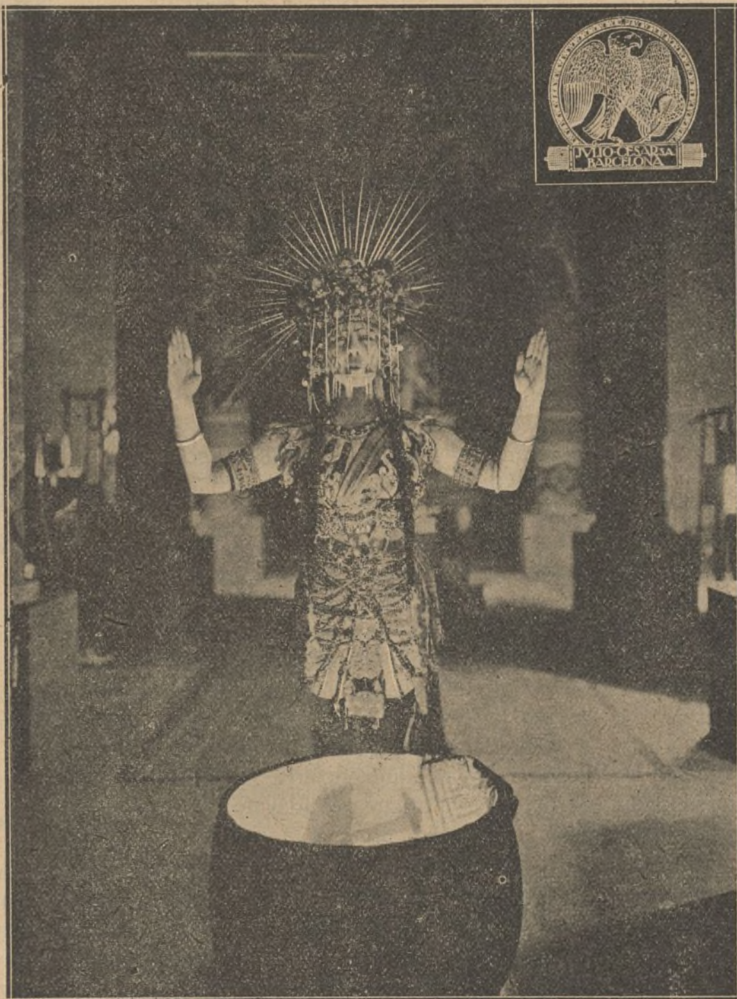
Una escena de la película «El farol rojo»

El argumento es original y está llevado a la pantalla con tan notable perfección, que logra despertar y sostener el interés del público, aumentando éste, a medida que adelanta el curso de la proyección, hasta su desenlace que es de efecto y muy real.