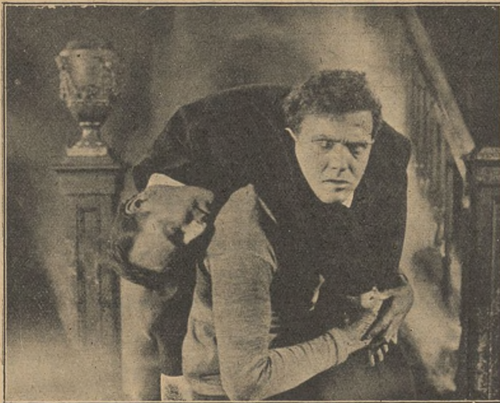
Una escena de la película «El poder ajeno»

Al ver al conde Franco, un escalofrío mortal estremeció la bella escultura de carne de la duquesa de Miranda... ¡Era él! El hombre adorado, objeto de sus ensueños de ventura, era el novio de Amelia. Y mientras Pascal, que esperaba fuera, se consumía de celosas impaciencias, suponiendo entre Magdalena y el príncipe el germinar de un idilio, la hermosa desventurada se despedía, entre frases balbucientes de gratitud, para volver a su casa con una tristeza indefinible, sangrante el corazón por la herida impiadosa de la fatalidad... ¡Acariciar una ilusión, consagrar a perseguirla todas las aspiraciones de una vida y ver que escapa al corazón, como huye de entre las manos el girón de niebla, la columna de humo!... Y ella no quería luchar