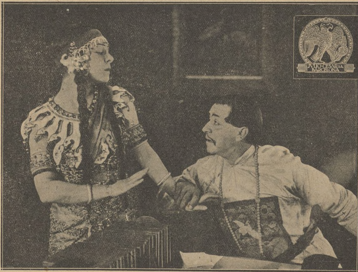
Una escena de la película «El farol rojo»

de cenizas entre los escombros de la destrucción que preparaba su mano. Pronto el incendio tiñó de siniestras púrpuras la noche, entrando, invasor, en todos los aposentos de la casa Dutertre. Los trágicos resplandores despertaron a Magdalena que, horrorizada, trató de huir inútilmente, cayendo sin sentido entre la humareda asfixiante... Borracho de sensualidad, Leonardo Pascal lanzóse en-