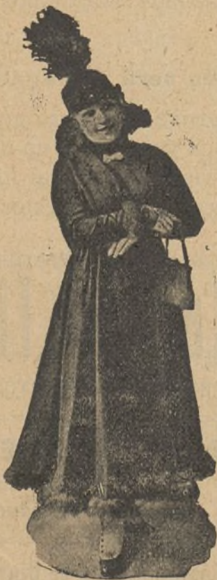
Cupletista contristada con el cierre de los music-halls

Complacidos de tan grata visita, esperamos que sus negocios sean todo lo fructíferos que a su elevada inteligencia corresponde, haciendo así su estancia agradable entre nosotros.