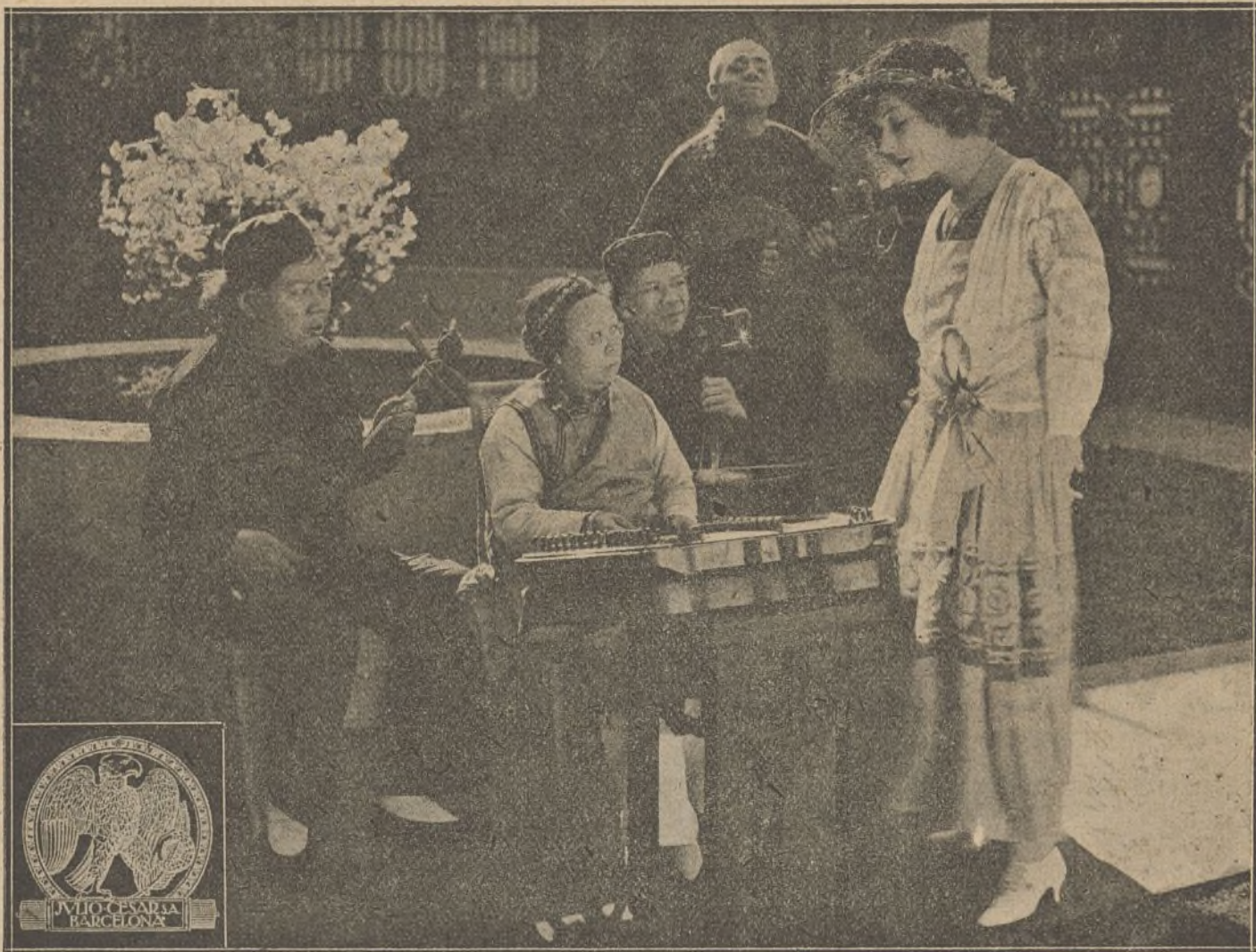
Una escena de la película «El farol rojo»

La dirección artística a cargo del señor Benavente, muy acertada y los títulos que también se deben al célebre dramaturgo, constituyen verdaderas joyas de la literatura española.