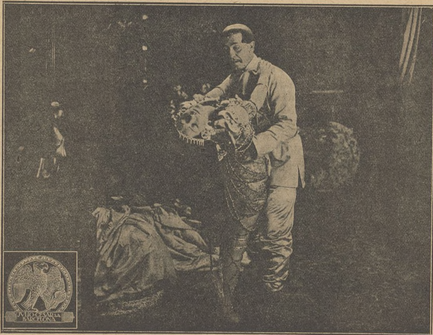
Una escena de la interesante película «El farol rojo»

Ernesto suplica a Carlos que le acompañe otra vez al depósito para cerciorarse por última vez de la certeza de que es Carlota la muerta.