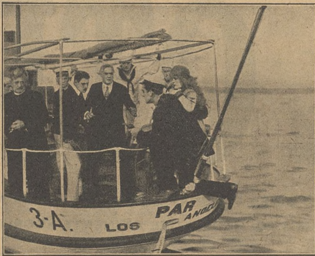
Una escena de la película «La bala de bronce»

Y aquella extravagante novatada, fue el origen feliz de un amor puro, grande y verdadero que eternamente unió dos corazones.