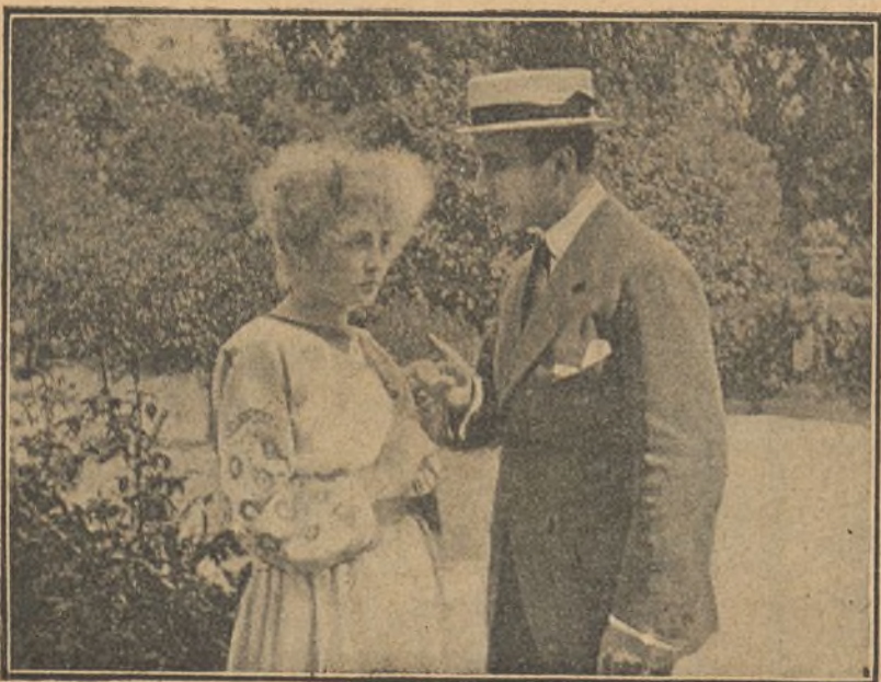
Una escena de la película «El escándalo»

En el cabaret de «El Perro Rojo», antro de corrupción que sirve hoy de centro a las reuniones de los piratas, tiene Mil Ojos citado a Ricardo Graham, el hermano borracho de Betty, ambicioso de la alta cotización que obtendrán los secretos navales de su padre. Betty, como