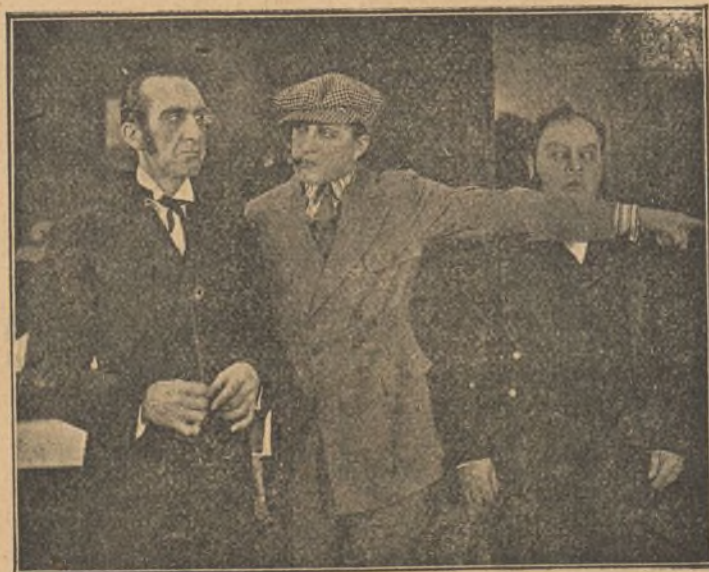
Una escena de la película «Veintiuno»