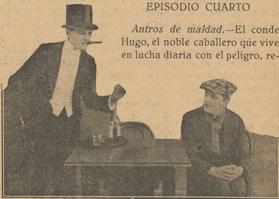
Una escena de la película «Veintiuno»

Antros de maldad. —El conde Hugo, el noble caballero que vive en lucha diaria con el peligro, re-