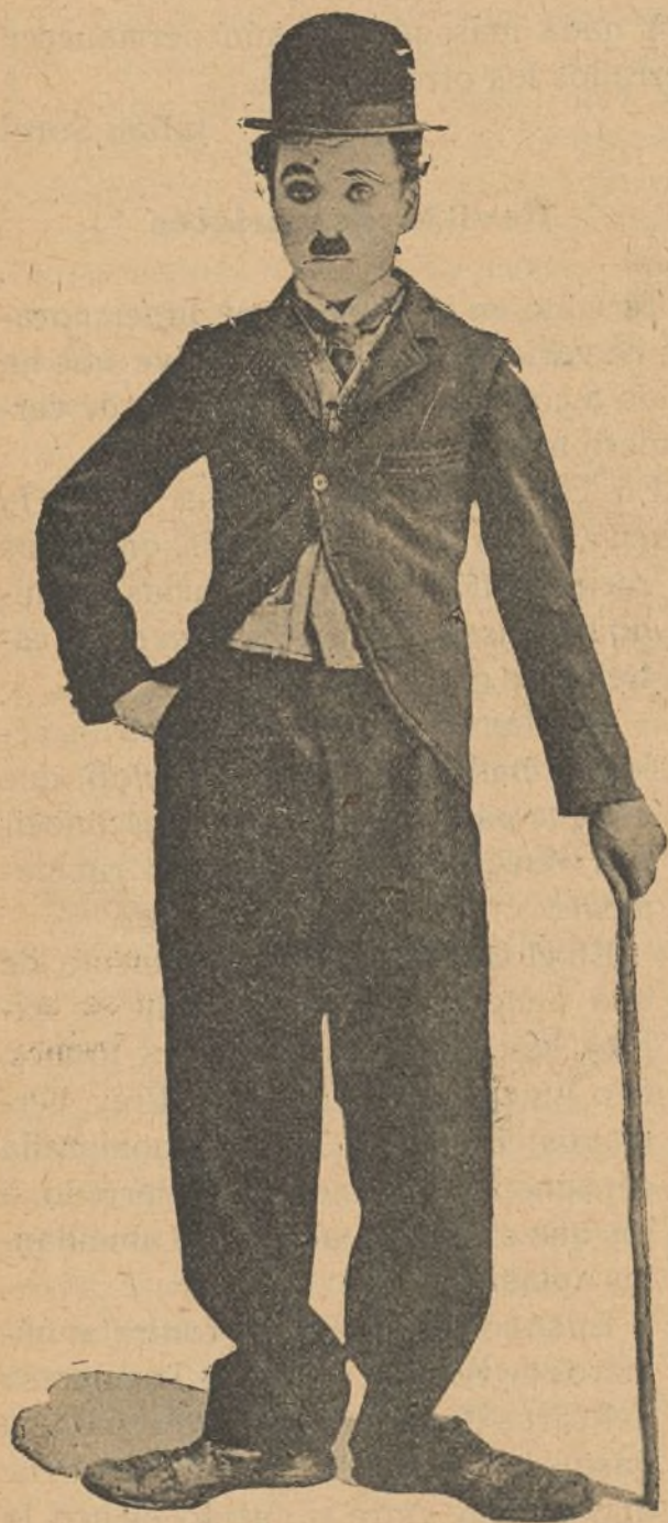
El gran bufo cinematográfico Charles Chaplin (Charlot)