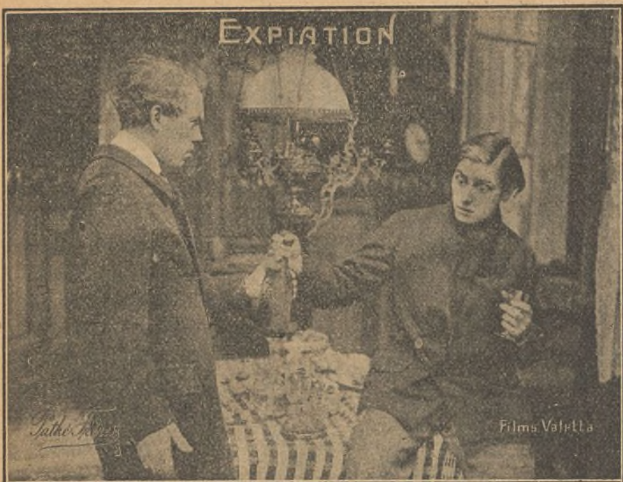
Una escena de la película «Expiación»