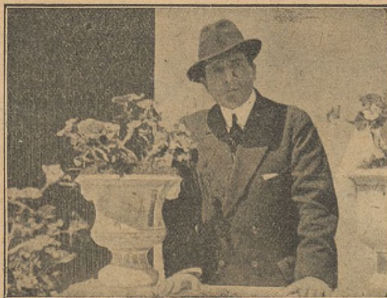
Una escena de la película «El escándalo»

Este es a grandes rasgos el argumento en que Fabreges pone en juego todas las exquisiteces de su arte excelso.