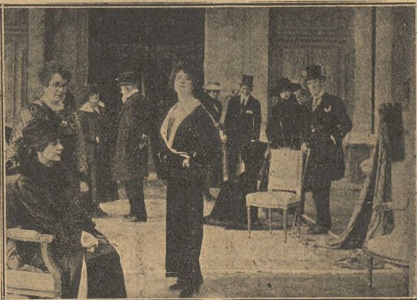
Una escena interesante de la película "Avaricia"

Betty deambuló largo tiempo. Cerca de una profunda cortadura hecha en una pequeña eminencia, una voz de hombre que demandaba socorro, atrajo su com-