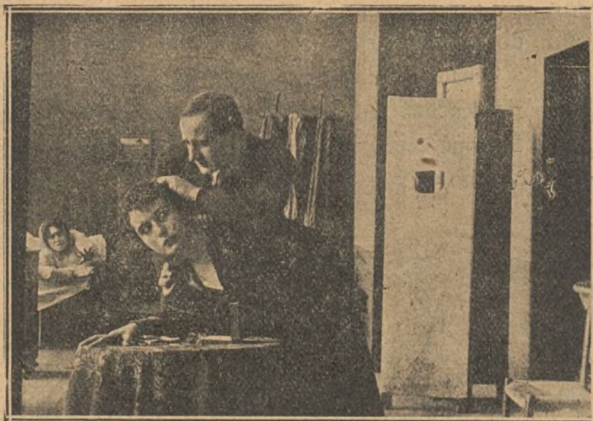
Una escena interesante de la película «Avaricia»

cilio en la Vía Montenapoleone, 28, Milano.