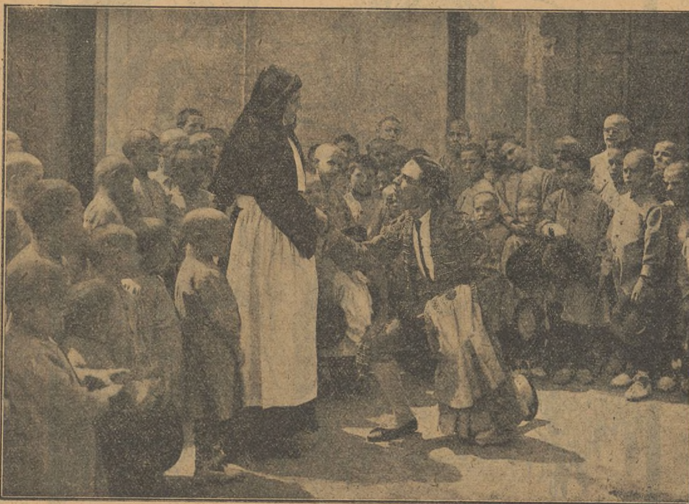
Una escena de la película «Los arlequines de seda y oro»

Han llegado a América. Kah se ha instalado en una casa llena de trampas y resortes, con un dispositivo secreto, por medio del cual podía gozar en cada momento de la vista de la ejecución de sus venganzas. Hugo ha llamado a su casa a Jorge Graham para pedirle consejo contra la roja mano del odio de Egipto.