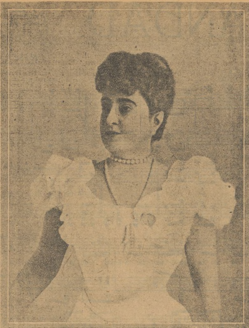
Adelina Patti, baronesa de Roff Caderstrom, hermosa y distinguida cantatriz que acaba de fallecer en su castillo de Craig-y-Nos (Gales)

Preciosilla , que se dirigía con su madre a la isla de Cuba, en donde tenía que cumplir algunos contratos pendientes, ha sido una de las víctimas del naufragio