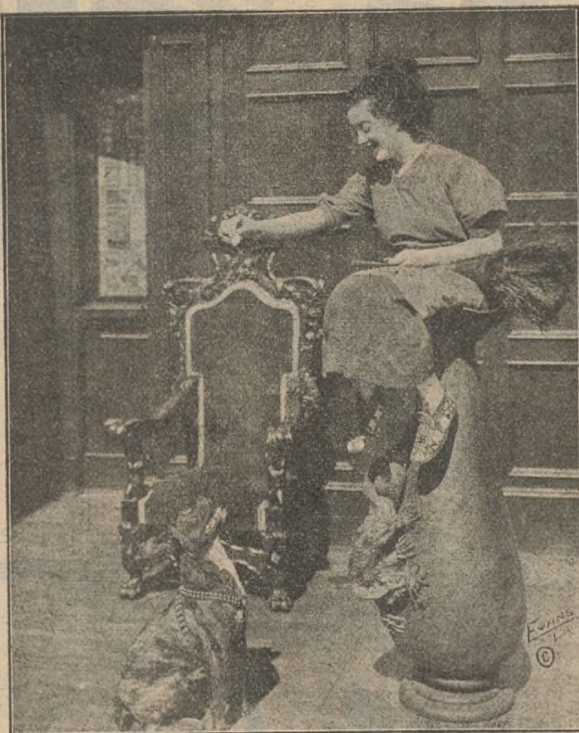
Una escena interesante de la película «Mickey»

«Soy la enfermera del Doctor Allen —dijo María al sorprendido Roberto. La relación de sus dificultades a vivir sin poder trabajar me ha sugerido un remedio que voy a proponer a V. Yo seré muy rica, si usted lo quiere. Usted será muy rico si acepta mi proposición. Quizá le extrañará mi idea; no obstante, es beneficiosa para ambos. Debo casarme antes de mañana para conseguir un dote de cuarenta mil duros. ¿Quiere usted ser mi protector? ¿Quiere usted casarse conmigo? Una vez efectuada la ceremonia