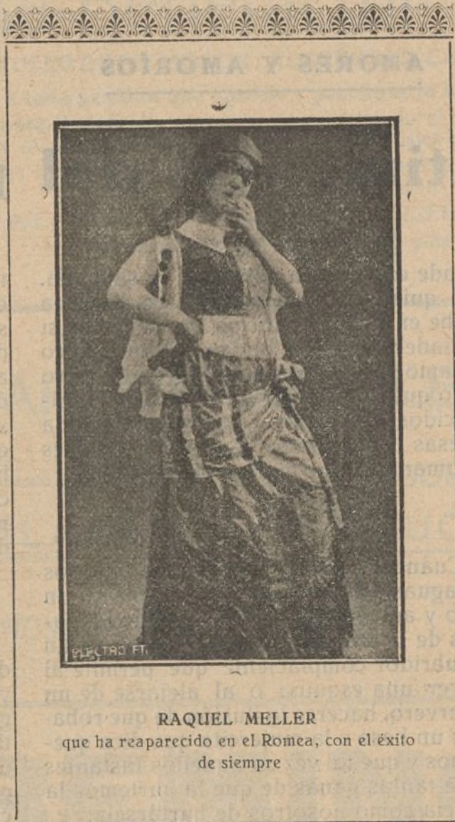
RAQUEL MELLER que ha reaparecido en el Romea, con el éxito de siempre

Pudiéramos decir al referirnos a La Garduña lo que casi siempre se dice cuando hay estreno en el Cómico; un éxito más de la excelente artista Loreto Prado y del notable Enrique Chicote. Toda obra que se representa en el coliseo de la calle de Capellanes constituye un triunfo para los simpáticos artistas. Un