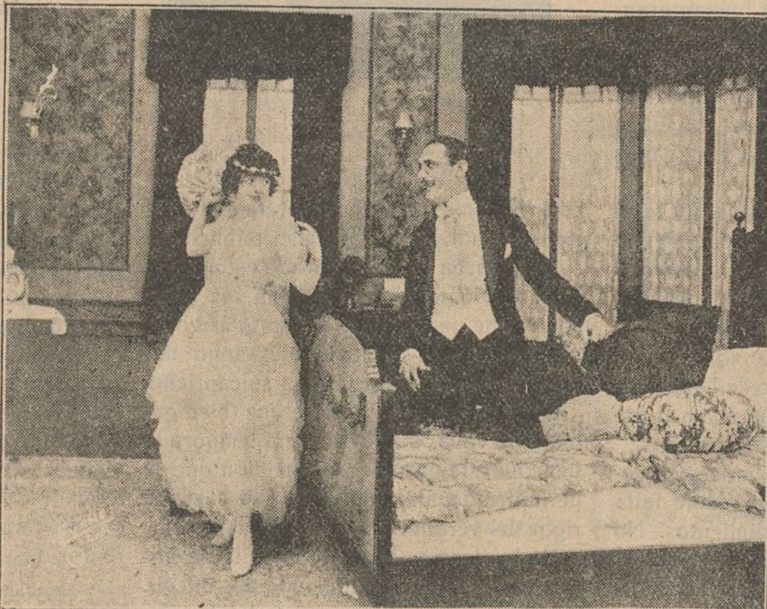
Una escena interesante de la película «Mickey»

La dirección de la cinta fué encomendada a Aubrey K. Kennedy y Lewis Lewyn, y hecha con la cooperación del teniente coronel Lawrence W. McIntosh, comandante del campo de aviación de Ellington.