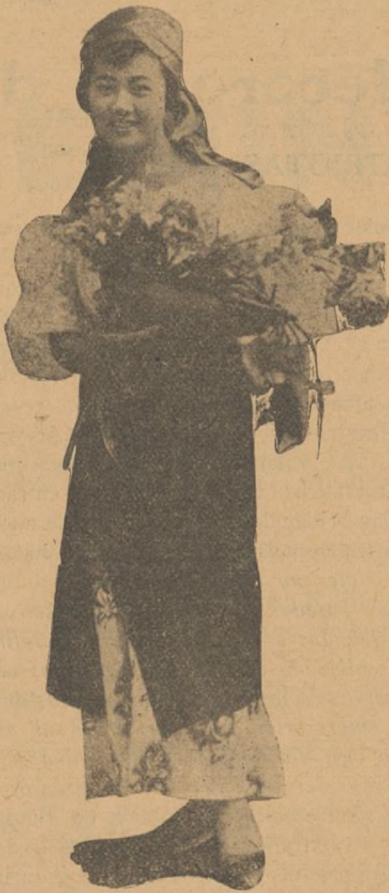
Honorata de la Rama

Después queda el recuerdo de una obra cuyo asunto es tremebundamente angus-