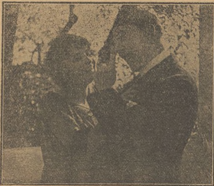
Una escena de la película "El Salón de Salustiano"

Entre las muchas obras que Metro está preparando para adaptar al lienzo se cuentan "La Maison Des Danses" y