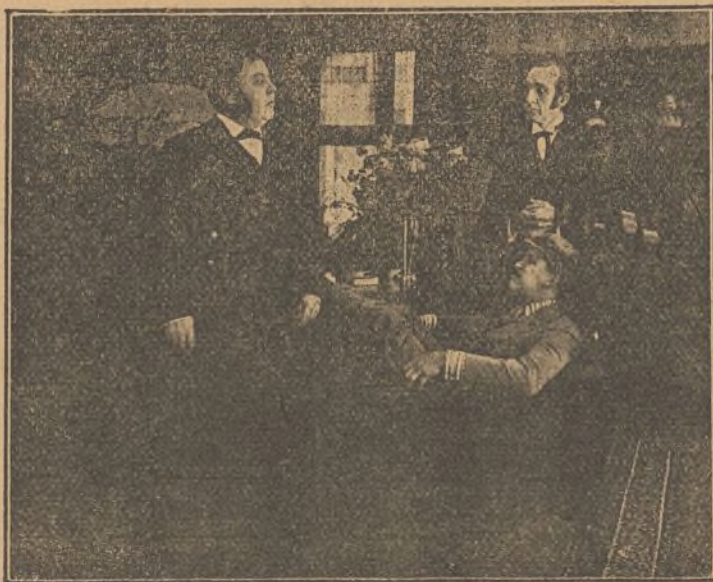
Una escena de la película "Veintiuno"

El pavoroso presentimiento de Roberto d'Aubenas parecía confirmarse. Enloquecido, había marchado al lugar del espantable siniestro, y visto con horror que el incendiado era el tren en que debía