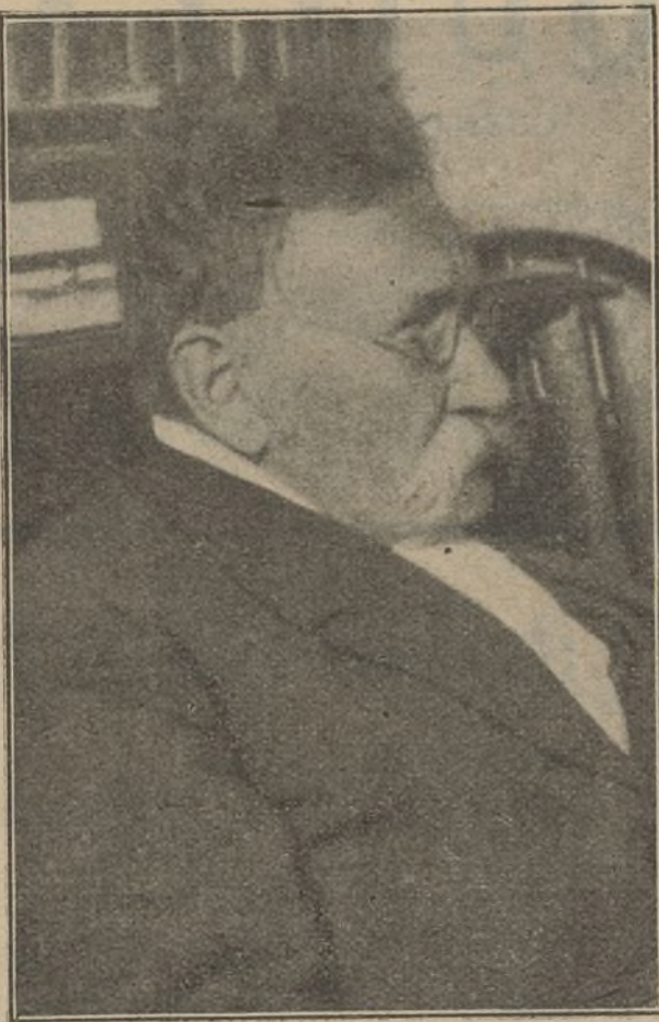
El inmortal autor de EL ABUELO , cuya muerte ha constituido el gran duelo nacional de estos días

De Muñoz-sequerías, recogeremos los estrenos de El colmillo de Buda , en la Comedia, una gansada más, regiamente puesta en escena, y Los amigos del alma , en Cervantes.