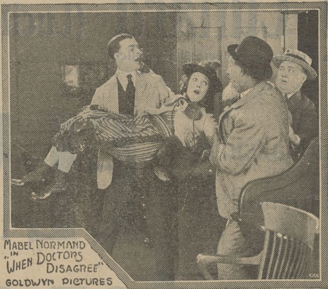
MABEL NORMAND "IN WHEN DOCTORS DISAGREE" GOLDWYN PICTURES

Aquella noche Clower hace balance de sus fondos... Las treinta y cinco mil pesetas tocan a su fin... Ella mira con tristeza que se acerca el final de su hermoso sueño; no está pesada de lo que ha hecho: ha querido vivir «La novela de la duquesa» y la ha vivido... Precisamente es aquella noche cuando el Hotel de Aguas Manas da un baile en honor de la ilustre viajera... Clower quiere disfrutar el epi-