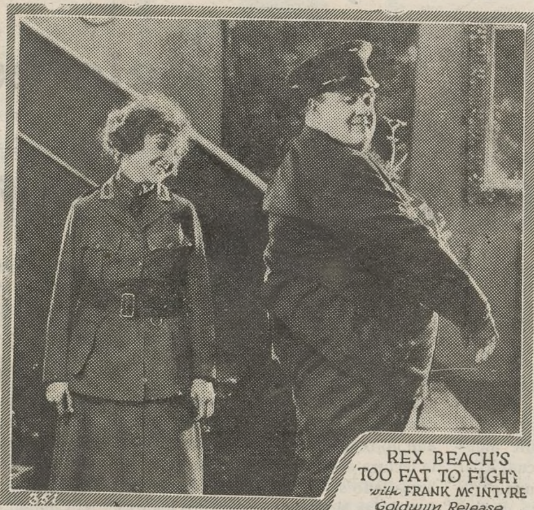
REX BEACH'S 'TOO FAT TO FIGHT' with FRANK MCINTYRE Goldwyn Release

Gerardo luchó por su amor hacia Paulina, pero las palabras de su madre eran tan lógicas; la obediencia y cariño que le debía y su mismo amor propio lastimado por la negra aureola que circundaba el