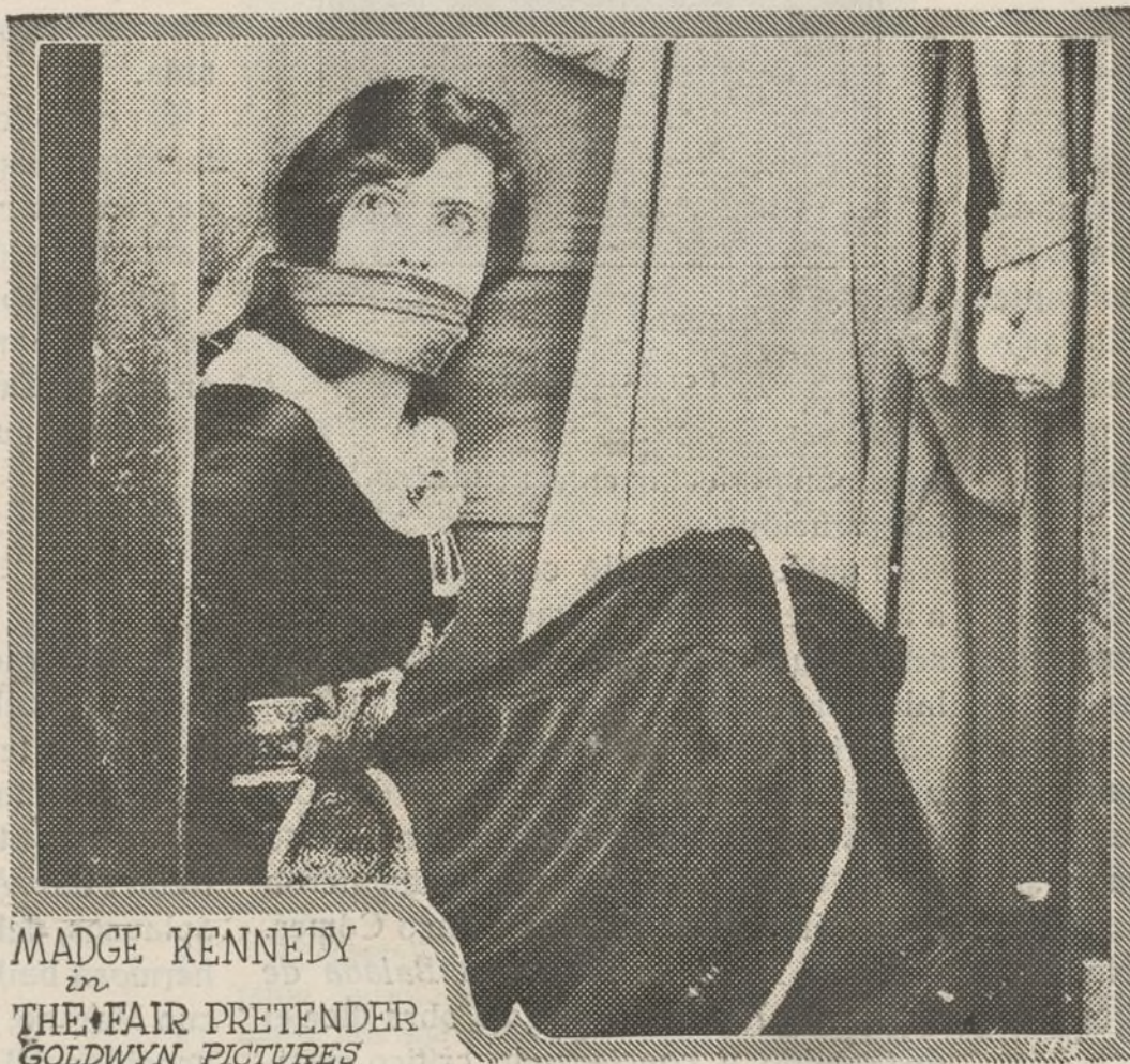
MADGE KENNEDY in THE FAIR PRETENDER GOLDWYN PICTURES

Pathé. — «El correo de la noche», maravillosa cinta de hermosa fotografía y sorprendentes efectos de luz, y los episodios tercero y cuarto de la interesante y sensacional serie titulada «La huella del tigre».