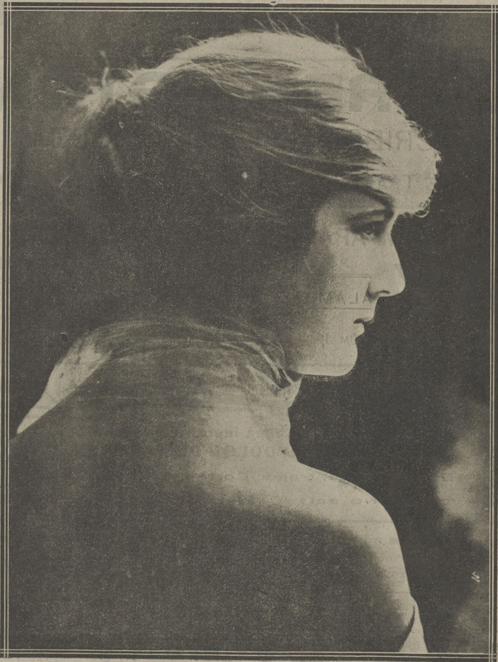
Mary Mac Laren

Célebre artista americana que forma parte del programa de la CASA VERDAGUER