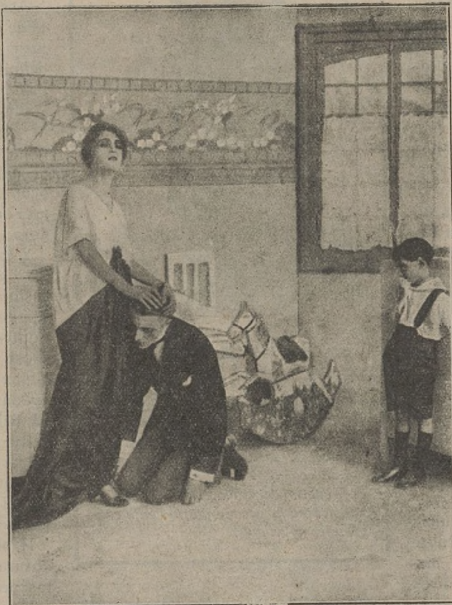
Una escena de la interesante película «Pecadora casta».

La organización de que hablamos representa, en personal y en capital, los antiguos «Mutual Film Corporation» y