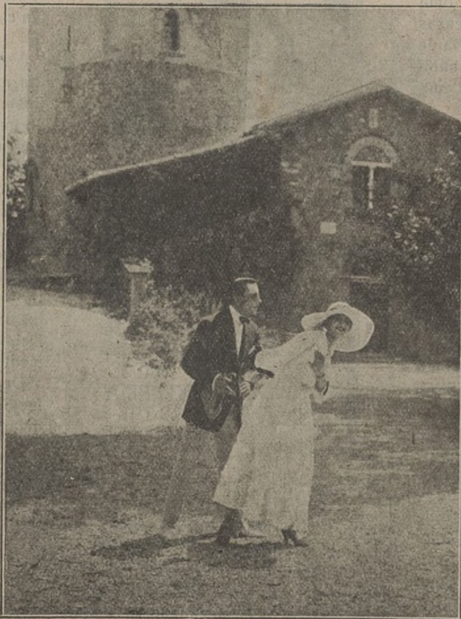
Una escena de la interesante película «Pecadora casta»

taria ad hoc , en visitar los sitios de peor fama de la ciudad. Sus pesquisas obtienen el resultado esperado, pues en un tabernucho aislado, la joven encuentra a los cómplices del Encapuchado, esforzándose por obtener de ellos el verdadero nombre del misterioso personaje. Por desgracia para Perla, entre dichos cómplices figura una sirvienta despachada por la joven algunas semanas antes, y