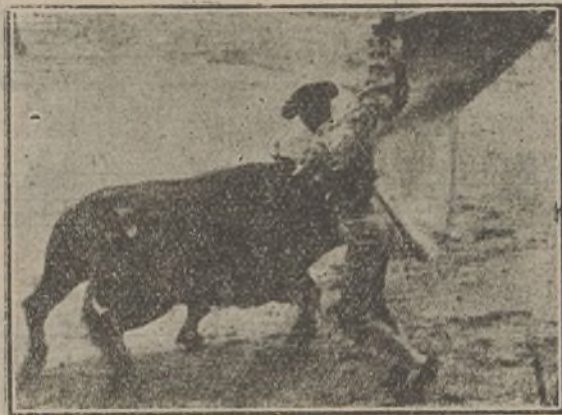
Camará lanceando con su peculiar «estilo»... El día de Pascua sufrió un puntazo leve en la cara, toreando en la plaza de Madrid

El Gallo—de morado y oro—empezó la tarde animoso, con deseos...; lanceó bien al 1.º: de las cuatro verónicas tres fueron buenas y el recorte a la media verónica muy ceñido. Con la muleta, a pesar de lo revoltosillo que