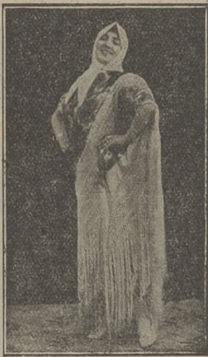
LA PRECIOSILLA artista de varietés que obtiene grandes aplausos en el Edén