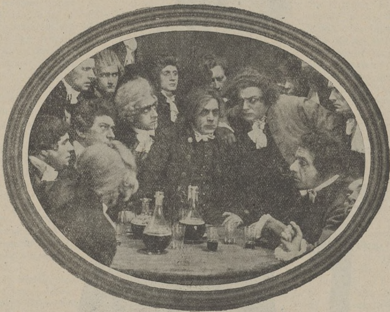
Interesante escena de la grandiosa película «Madame Dubarry»

Al verse libre Armando acude a una reunión de conspiradores que quieren solicitar una entrevista con el Rey para poderse quejar personalmente de la Dubarry y de lo perjudicial que esta mujer es para el país y para el propio prestigio del Rey. Madame Dubarry, advertida por su fiel criado, logra penetrar en la reunión y escucha las palabras de odio de Armando que excita a los reunidos a que vayan a Palacio para abrir los ojos del Rey sobre la conducta de esta funesta favorita. Juana, cuando los conspiradores han salido y en la amplia sala débilmente alumbrado solo quedan ella y Armando, le pregunta con amargo reproche: «¿Por qué quieres aniquilarme? ¿Qué mal te he hecho?». Y cuando ella le pregunta qué puede hacer para que él le