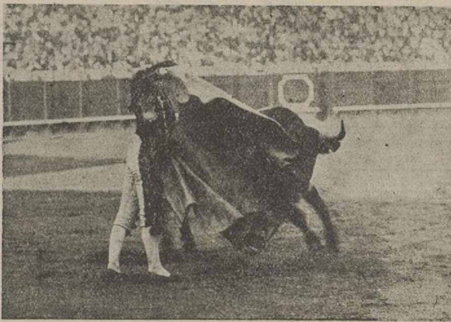
Maravillosa verónica de Chicuelo en Sevilla

Chicuelo—de malva y oro—estuvo inmensurable con el capote. Veroniqueó colosalmente y remató con un lance de pecho a capote