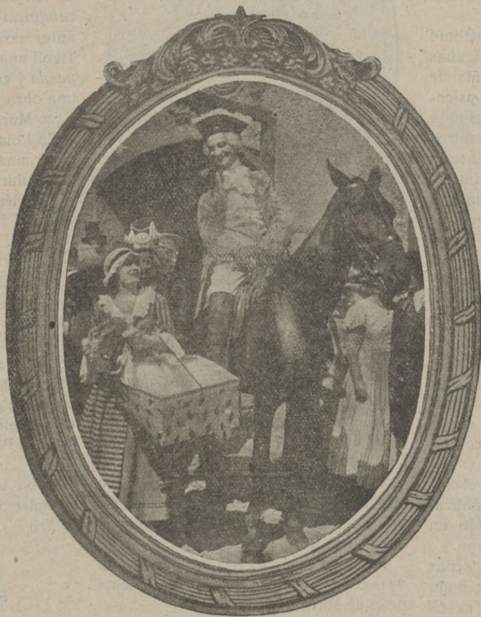
Una interesante escena de la grandiosa película «Madame Dubarry»

En cuanto a presentación la Studio, como vulgarmente se dice ha echado el resto, pues nada tiene esta que envidiar a la fastuosidad a que nos tienen acostumbrados las casas extranjeras, estando en «El león» escrupulosamente atendidos hasta los más mínimos detalles.