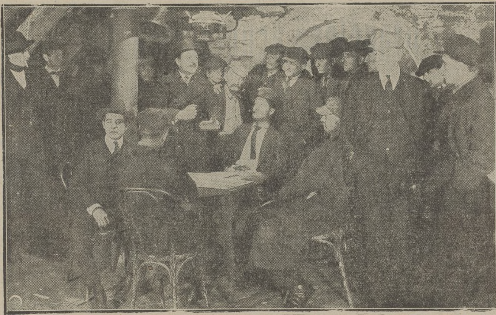
Una interesante escena de la película de series «El caso Carter»

vida ni quitar de ante sus ojos el prisma a través del cual ve un porvenir de tintes sombríos. Oprimido por el miedo su corazón, Carter pasa la mayoría de sus horas en «El Cuarto de los Enigmas», explorando con su telescopio la proximidad de los peligros que amenazan su existencia.