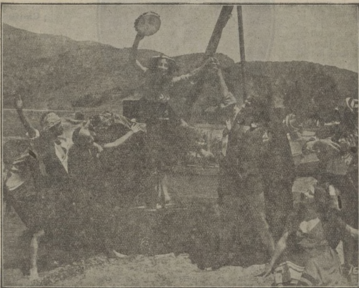
Una interesante escena de la película «La mucca di Portici»

El conocido ingeniero italiano Caproni, que como es sabido es el inventor de