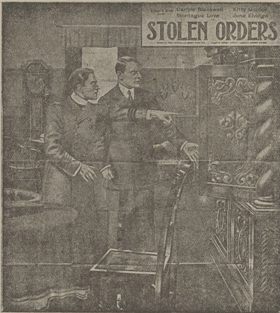
Una escena de la interesante película «Ordenes robadas»