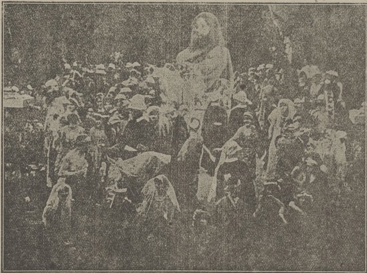
Una escena de la grandiosa película «El nacimiento de una nación».

de Dixon; momentos después, cuatro hombres se presentaban en casa de Carter y solicitaban en nombre de Kennedy hablar con Anita; ésta los recibió y cayó en el lazo, siendo metida en el saco por los cómplices de Avión y llevada a «La Mazmorra». Para que Kennedy no se apercibiera del secuestro de su protegida entablóse una ficción de lucha entre los secuestradores y los asíduos del antro