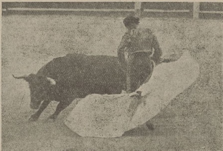
Una larga serpentina de Joselito

Belmonte—de perla y oro—no hizo sino acercarse al fogueado, que estaba difícil; y en seguida estocada atravesada, pinchazo y dos intentos. (Palmas y pitos). Bien con la capa en el sexto, le muleteó con sosería, parado y templado, pero sin angel, tan soso el toreo como el toro. Media delantera y tres intentos. El pú-