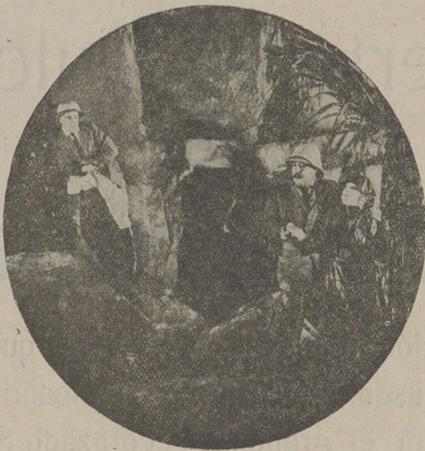
Una escena de la interesante película «Por amor»