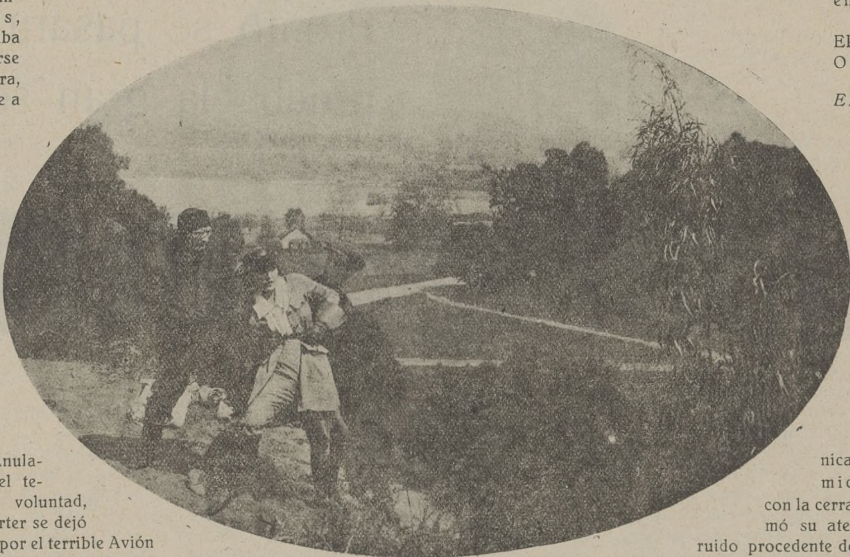
Una escena de la interesante película «La huella del tigre»

Apenas llegados a Dixonia, Kennedy dejó a Anita en el hotel al cuidado de Jameson, y se dirigió a la vivienda de Culpeper, en cuya presencia halló a Ema-