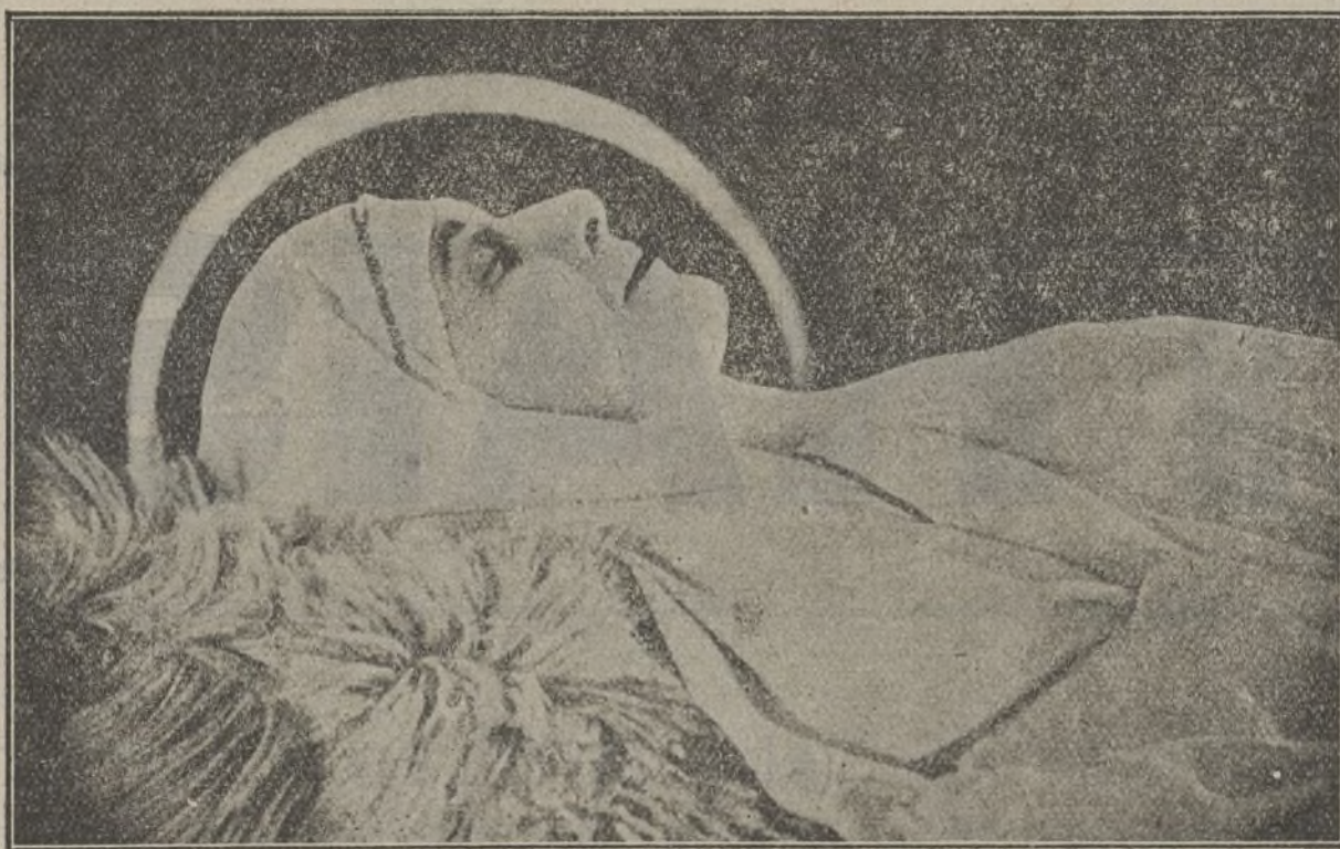
Una escena de la interesante película Thais

Mientras tanto, Dixon, para ganarse a Giest, que quería hacer por sí solo el negocio de la venta de las minas, colocó en la entrada del cuarto de Kennedy una marmita de hierro, que estallaría por percusión al abrirse la puerta; pero Dixon