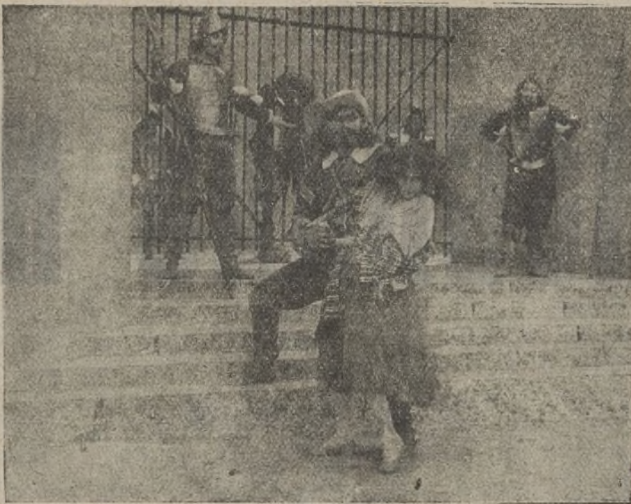
Una interesante escena de la película «La muda de Fortici»

Kennedy sorprendió e impidió el intento de fuga de Dixon, que había robado