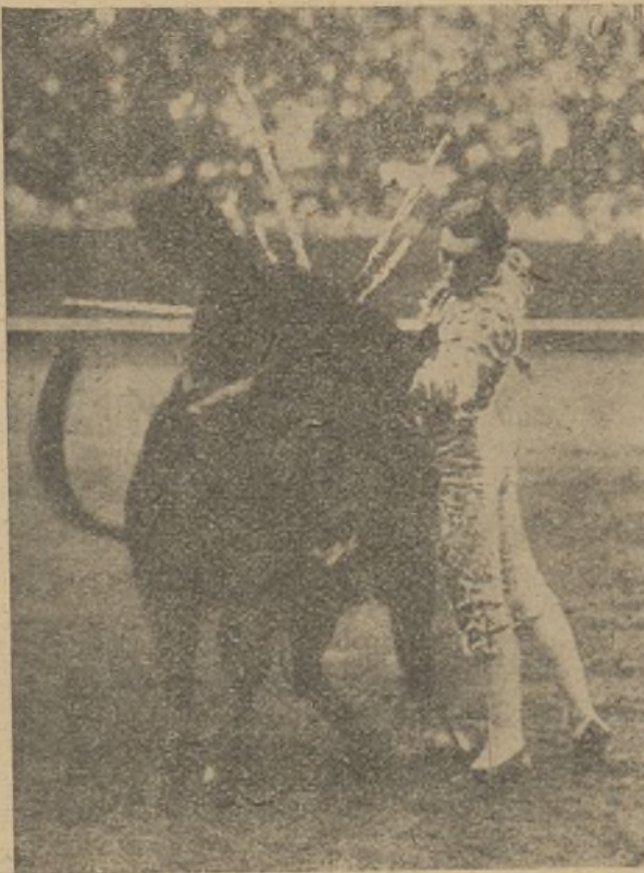
Dominguín, rematando un quite entre los cuernos

aguanta, como no los despide en el tercer tiempo, tiene que irse, y resulta una birria. Pero esta tarde todo salió a derechas, y estas verónicas y todas las de todos los quites fueron impecables, personalísimos, naturales, sin descomponer la figura ni arrastrar la pierna de goma... El toro llegó quedado. Dominguín inició la faena con un natural, uno de pecho y otro natural, magníficos. Exactamente los mismos tres pases dió en seguida con la derecha,