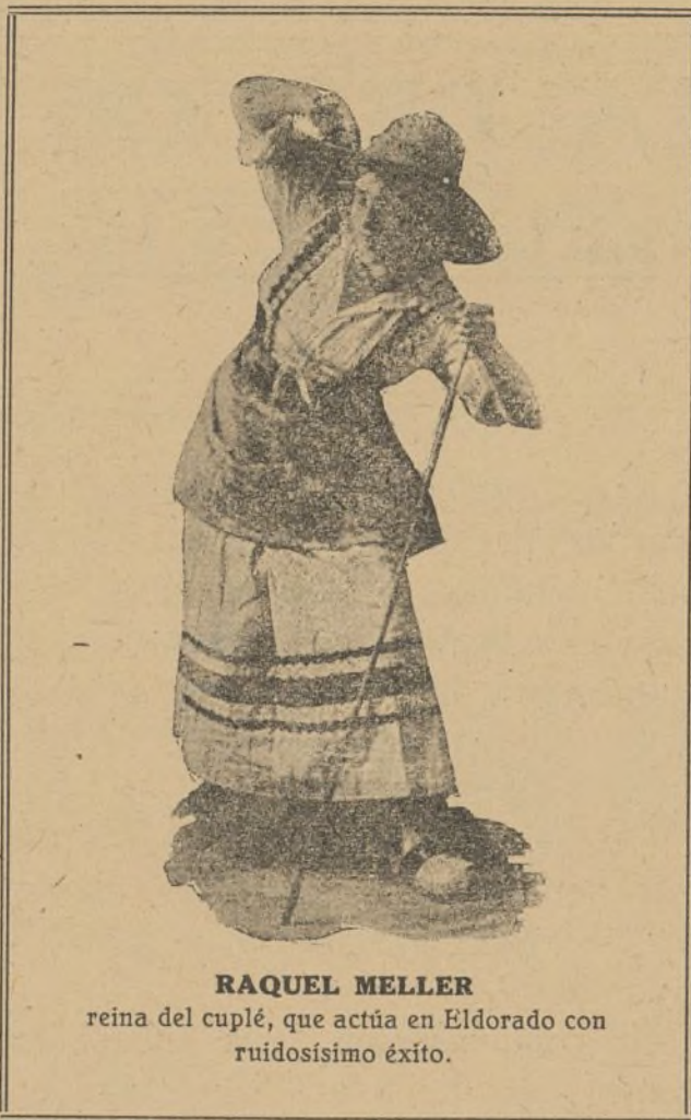
RAQUEL MELLER reina del cuplé, que actúa en Eldorado con ruidosísimo éxito.