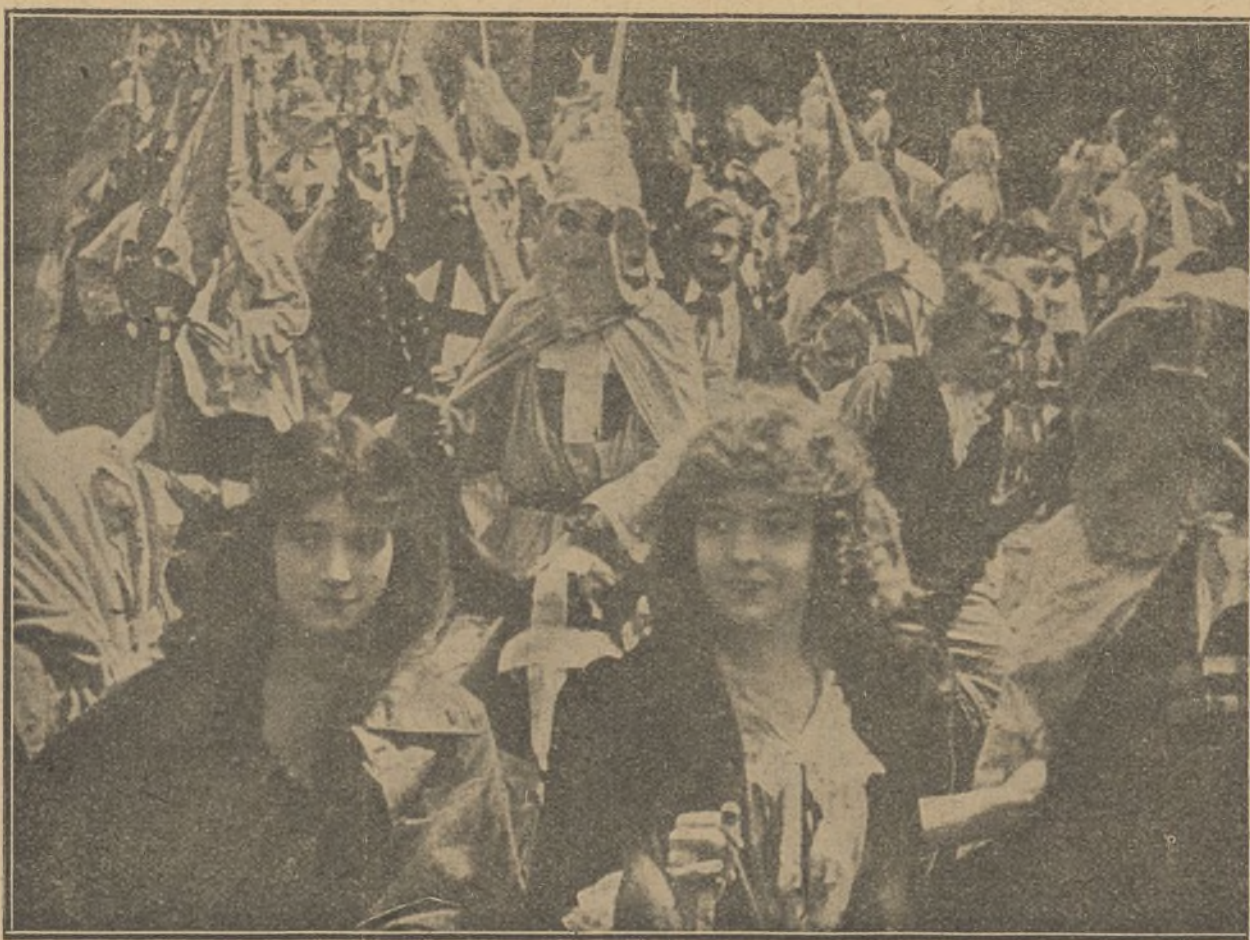
Una escena de la película «El nacimiento de una nación»

En las regiones cálidas, las sombras parecen azules en lugar de grises, de tal manera que los objetos parecen alumbrados, de un lado, por la luna clara, y por el otro, por el sol sin embargo, como no hay ningún color oscuro, resulta un conjunto que rebosa vida y alegría.