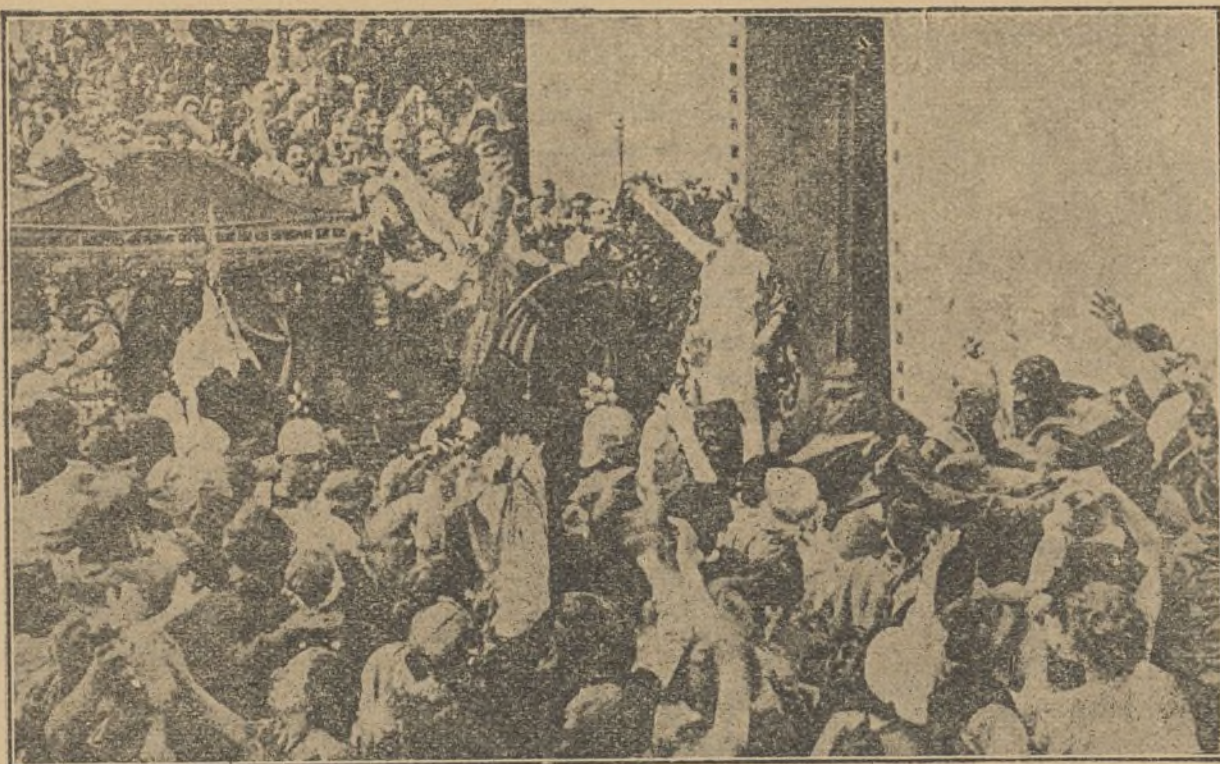
Una interesante escena de la grandiosa película «Thais»

El Ayuntamiento de Marsella ha apro- bado por unanimidad un presupuesto para dotar de cine una escuela de cada