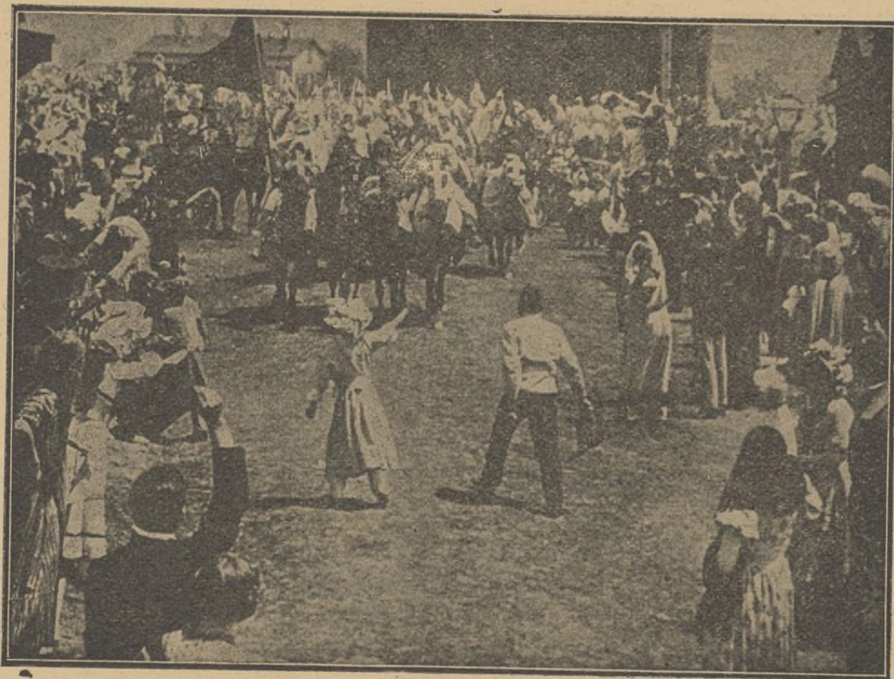
Una interesante escena de «El nacimiento de una nación»

una franca acogida en la casa del obispo, que le dió de comer y le albergó, no sin la muda protesta de su hermana, Baptistina, y de su criada, Magloria. Juan Valjean cayó rendido en el mullido lecho; pero de madrugada, despertóse. El recuerdo de los cubiertos de plata que había visto guardar a la criada en una alacena próxima obsesionaba su mente. Levantóse con sigilo, y tomando de su morral un taladro de cantero, dirigióse de puntillas hacia el lecho donde dormía