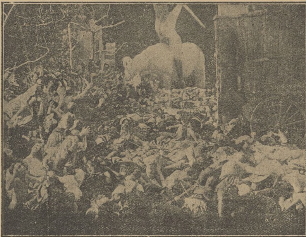
Una escena de la película «El nacimiento de una nación»

En la actualidad existen en Alemania unos veinticinco talleres cinematográficos, de los cuales once están situados en Berlín y sus inmediaciones.