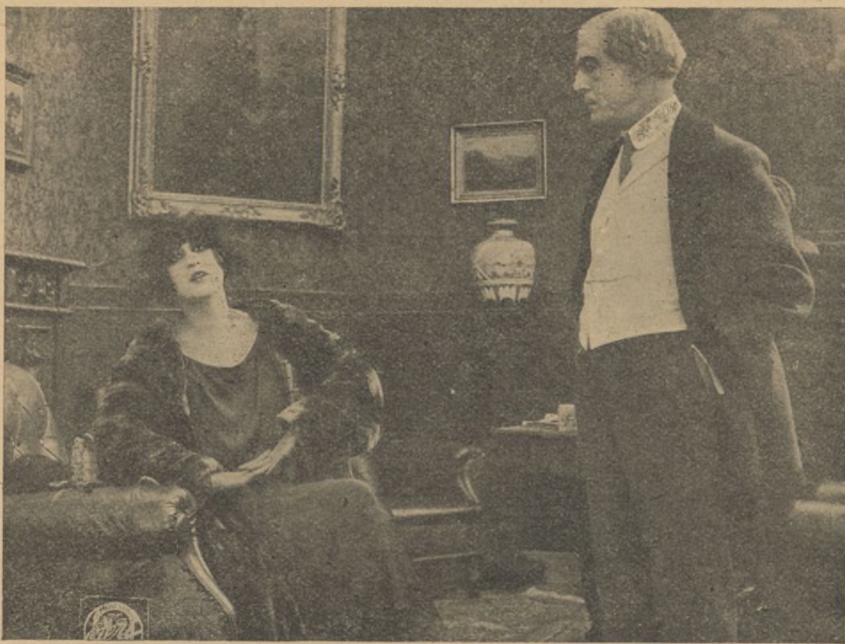
Una interesante escena de la película: «Eva pecadora»

En los jardines, y bajo las arcadas tenebrosas de la sabia naturaleza vegetal, multitud de formas blancas imprecisas y fugitivas parecían arrastrarse por el césped y huir con furia desordenada.