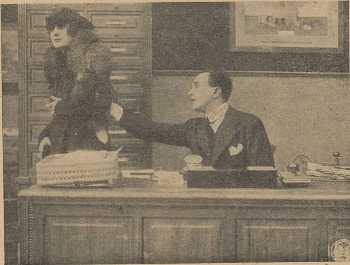
Una escena de la magnífica película «Eva pecadora»

Nuestra enhorabuena a la nueva manufactura Gnomo Film, a la que, a proseguir por el camino tan felizmente emprendido, auguramos brillantes éxitos.