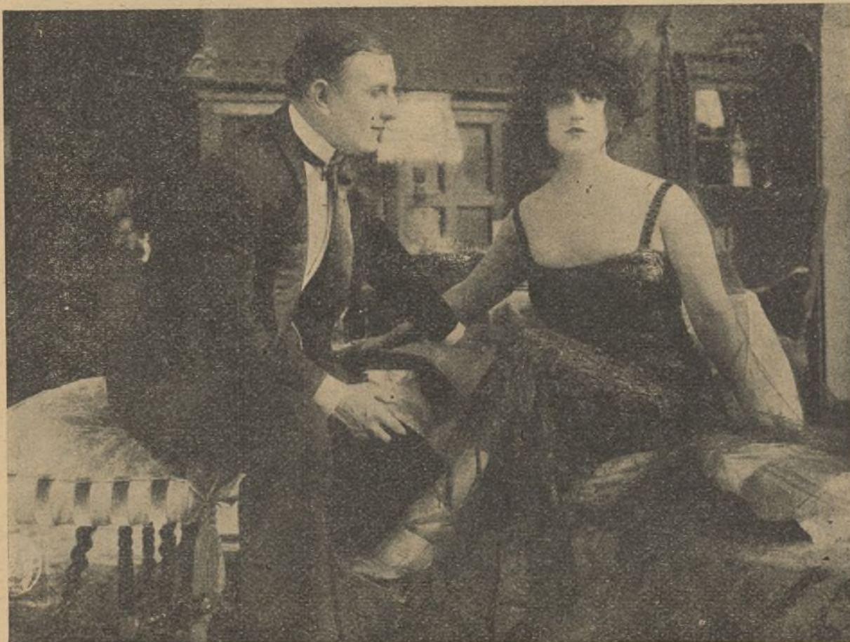
Una escena de la magnífica película «Eva pecadora»

Al día siguiente de esta desaparición, uno de los huéspedes más influyentes de la «Villa Circé», el asiático Kistna, se basaba en ser vecino del explorador para hacerle una visita interesada. Se trataba