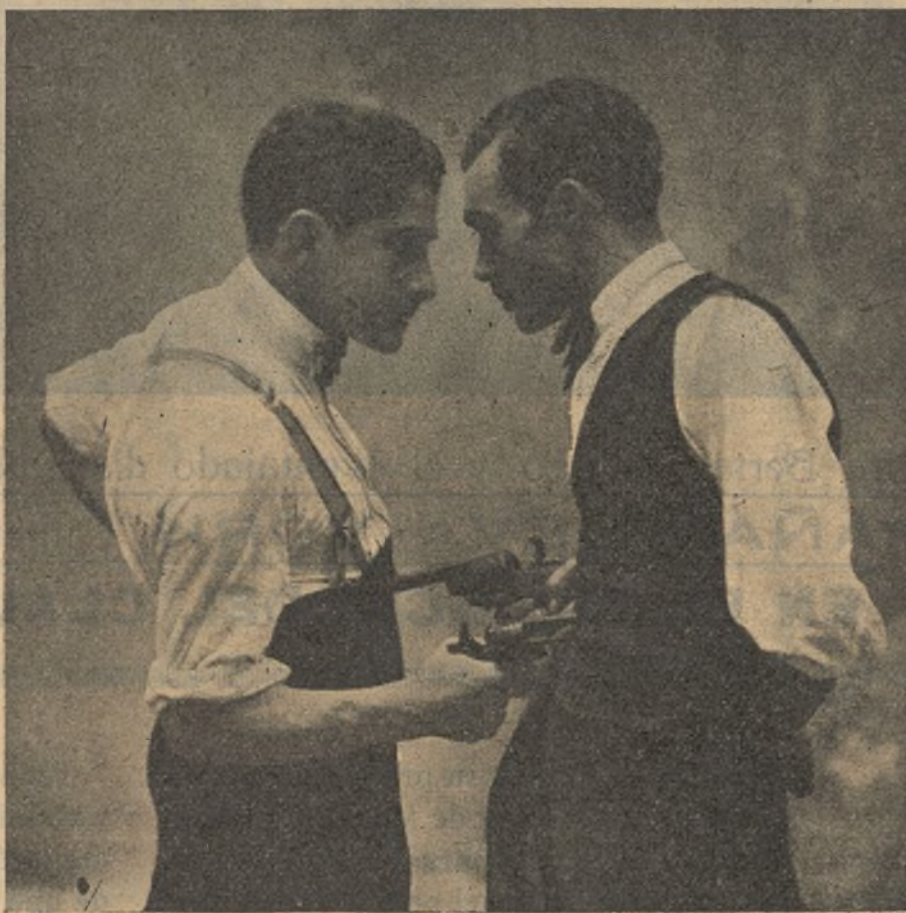
Una escena del argumento «El más fuerte»

Temiendo la elocuencia de su adversario, Dearing decide destruirlo como un obstáculo que contraría sus planes; pero