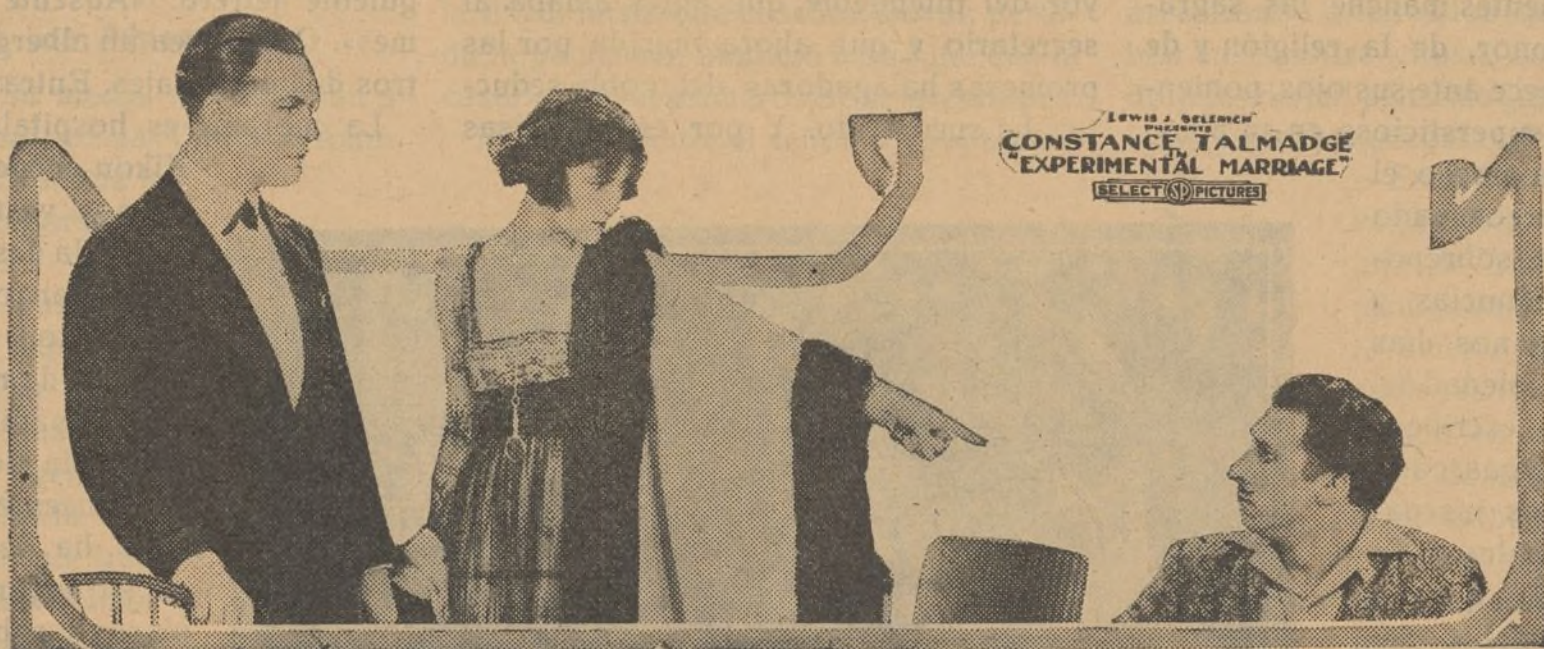
LEWIS J. BELMONT PRESENTS CONSTANCE TALMADGE "EXPERIMENTAL MARRIAGE" SELECT PICTURES

Y un día la Fortuna empieza a prodigar de nuevo sus favores a Gustavo de Montresor. El viejo notario recibe la noticia de que el barón de Montresor, un tío de Gustavo, ha dejado heredero a éste de su inmensa fortuna y de su legendario castillo, que se alza soberbio sobre lo alto de una montaña, y empieza la busca del noble, cuyos misteriosos escondites nadie conoce. En el círculo de donde ha sido expulsado Montresor, encuentra, por fin, el notario a un amigo suyo, el cual le indica el paradero de Gustavo. Y hacia el muelle se dirigen los dos hombres, hasta hallar en una taberna al afortunado conde.