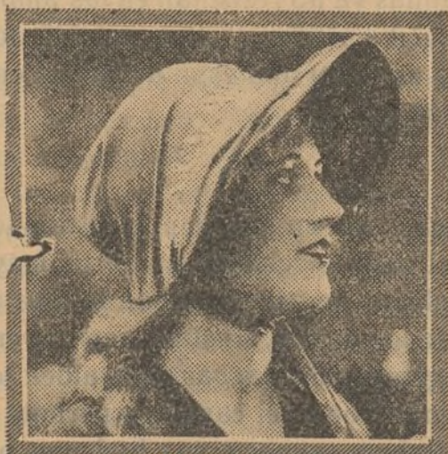
MARION DAVIES "THE BELLE OF NEW YORK" SELECT PICTURES

ofreciendo flores a los transeuntes. De pronto, Elena, que desde lejos ha visto a Gustavo, se acerca sin darle tiempo a separarse de su pareja, y, en aquel conflicto, a Montresor no se le ocurre cosa más sensata que presentar a las dos mujeres, haciendo pasar a su amante por una dama distinguida. El escándalo es mayúsculo. Se asustan los viejos, y a las jóvenes les parece excesivo el cinismo del noble vicioso. Y aquella boda, que era