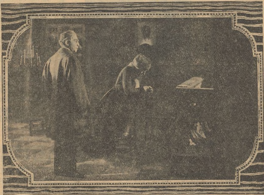
Una interesante escena de la película «El pensador»