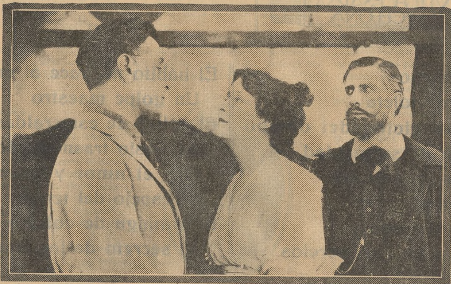
CLARA KIMBALL YOUNG IN "THE FOOLISH VIRGIN" SELZNICK PICTURES

un bolsillo bien provisto, acompañado de un lacónico billete: «Pago de una antigua deuda», y sin ocuparse del posadero Tuttle, que haido abusarle una botella de cerveza, éste desaparece. En aquellos momentos penetra en la posada Big Rivers. Tuttle le ve sentado en el sitio ocupado momentos antes por