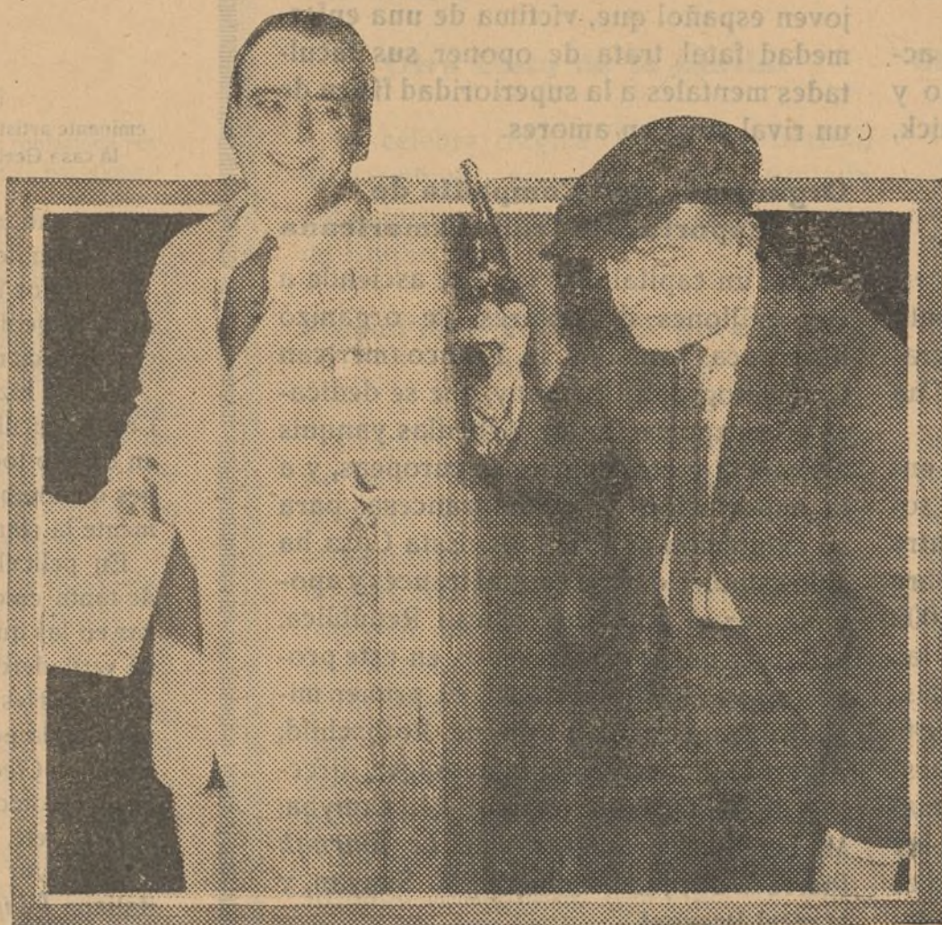
DOUGLAS FAIRBANKS in "A Modern Musketeer" An ARTCRAFT Picture

Mientras tanto, los miembros de la pequeña banda de Hugo, tras de buscar infructuosamente a su jefe y amigo, con el cansancio en los cuerpos y el desaliento en los corazones, se refugiaron en unas cuevas. Hugo, al fin, halló en el subterráneo un sillar giratorio y salió al campo; los amigos tuvieron el placer de verle llegar alegre y triunfador. Sin embargo, "Los Trece" le perseguían; trepar por la montaña, brotando de sus profundas quebraduras cual monstruos fantásticos. Rosa, perdida en las negras cavernas laberínticas, gritó en demanda de socorro. Su voz atrajo a los infames sectarios, que la hicieron prisionera, así como a Hugo, en ataque de traición. Rosa fué encerrada en una casita aislada, próxima a los muelles, y Hugo en la bodega de la casa del crimen. Y Mariana, sabiendo que ya no habría compasión para él, decidió salvarlo aunque en la empresa dejara la vida; a este fin volvió