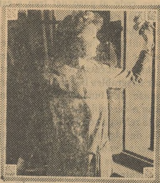
BILLIE BURKE in "Let's Get a Divorce" A Paramount Picture

Sentado en una roca, en actitud de honda meditación, estaba el que poco