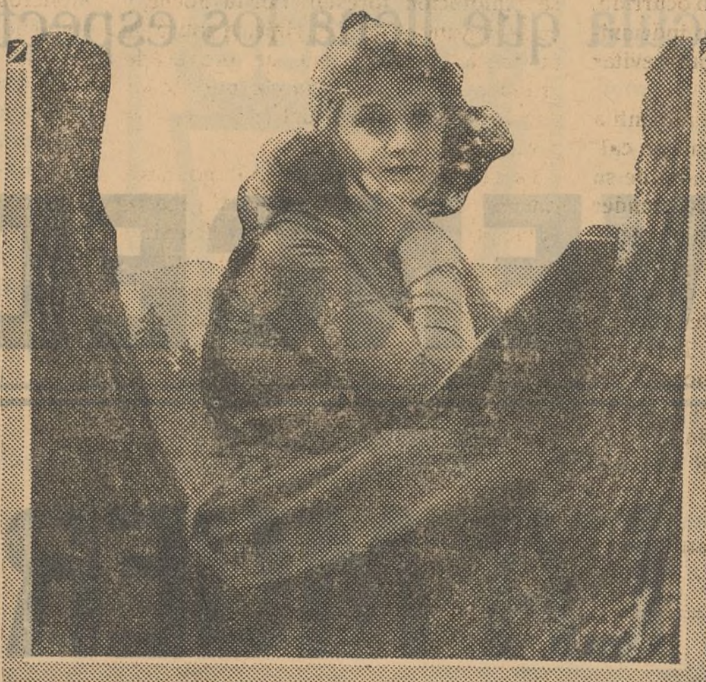
BILLIE BURKE in Let's Get a Divorce A Paramount Picture

La simpática María Osborne y su amigo el Africa dan lugar en esta comedia familiar a una serie de escenas tan deliciosas y de tanto candor, que admiran y distraen a la vez que enseñan cómo puede una niña de talento llevar la felicidad a un corazón y la tranquilidad a una casa, como ocurre a la abuelita de Mary, que siendo una señora de genio adusto y a quien molestaban los chiquillos, después que tuvo en su compañía a su nieta cambió de tal manera en su genio y en sus costumbres que parecía otra señora, hasta el punto que ya no quiso separarse más de su adorable nietecilla.