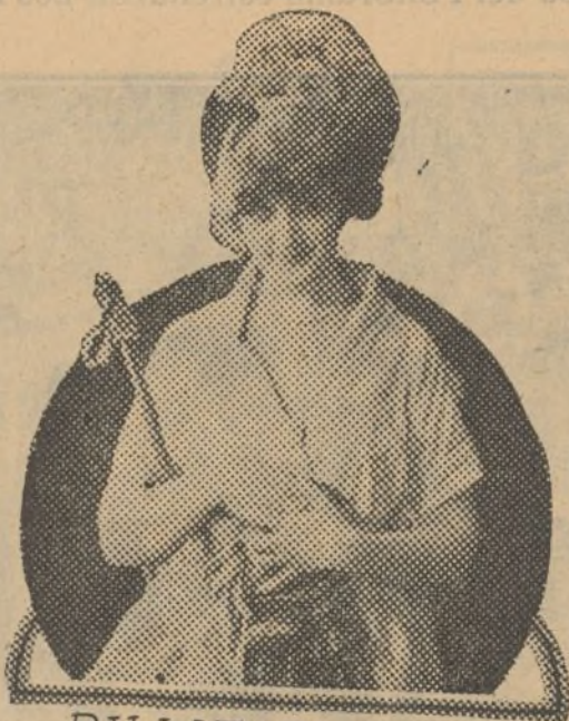
BILLIE BURKE in "Let's Get a Divorce" A Paramount Picture

La mejor prueba de que Locklear se daba cuenta del gran peligro que corría en sus extraordinarios vuelos, es que siempre llevaba consigo una carta «urgente» dirigida a su madre y que jamás se separaba de la placa de identificación