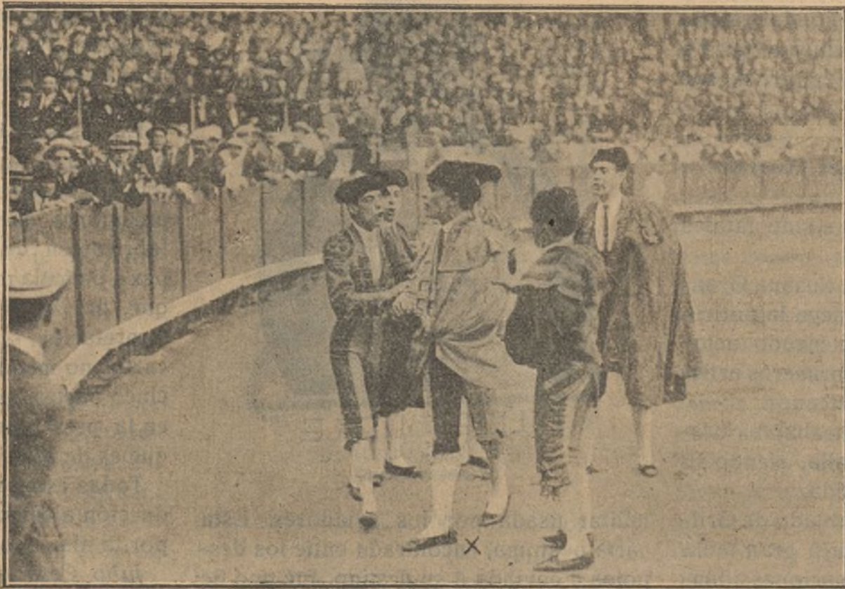
AMLETO NOVELLI (x) en la plaza de toros de Barcelona el último domingo, interpretando la escena de una película de la Gert-Film

terios de la Guardia . Quiere decirse que en aquella casa están de enhorabuena. Muchas veces las obras de Muñoz Seca no responden a las esperanzas que en ellas puso la empresa. Pero esto no es óbice para que en aquella casa reine el júbilo cuando consiguen tener en los carteles un estreno, exclusiva, del autor de El contrabando .